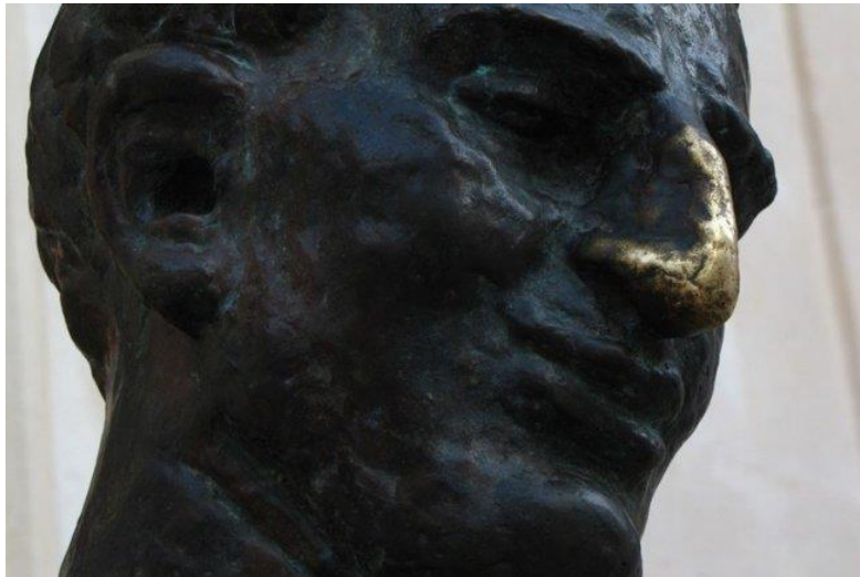
Slika 2. Marin Držić, spomenik Ivana Meštrovića (06. 02. 2018.)

Tezu o značaju vrline u ljudskom životu možemo usporediti s onom Držićevom. U njoj autor govori o odnosu prema dobrim, plemenitim, skromnim i pravim ljudima – „ljudima nazbilj“. Na osnovu toga s pravom možemo pomisliti kako je Držić svoju tezu o postojanju oprečnih odnosno različitih ljudi, pronašao upravo u starim filozofskim koncepcijama.