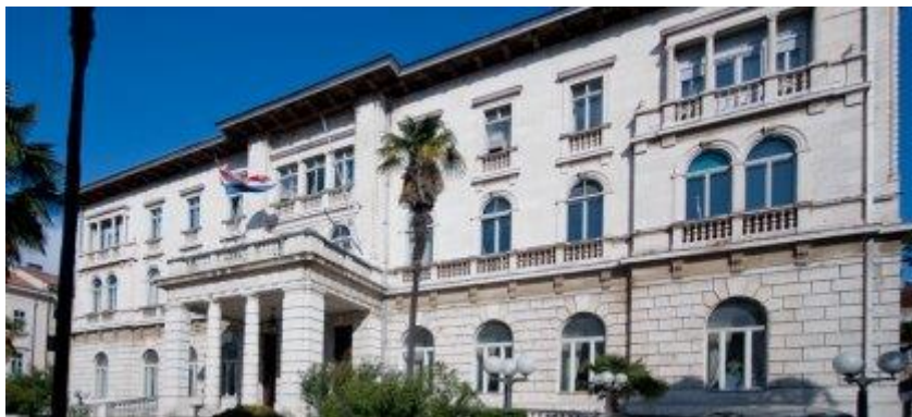
Slika 5. Dom hrvatskih branitelja

Rame uz rame rimskoj arhitekturi idu i mnoga djela austrijske arhitekture kao što su: austrougarske palače stare jezgre Pule – Kuća Benussi, Skrazinova palača, Palača Demartini, Palača Marinoni – te utvrde Fort Bourguignon, Verudela, Casoni Vecchi ili Monteparadiso, Punta Christo, San Giorgio ili Sv. Juraj, Monvidal. Nadalje Mornarička bolnica, Mornaričko groblje, Mornarički park, Mornarički kasino ili današnji Dom hrvatskih branitelja (Slika 5.), Istarsko narodno kazalište, Crkva Gospe od mora, Pulska tržnica, vile – Vila von Trapp, Vila braće Nauta, Vila Emma, Vila Matilde, Vila Franza Murina i druge. Potom pulski parkovi i zelene zone: Giardini, Huguesov park, Lungomare, Monte Zaro, Park pod Arenom, Titov park (Slika 6.), Park Franje Josipa i. i Park kralja Zvonimira, Šijanska šuma i drugi.