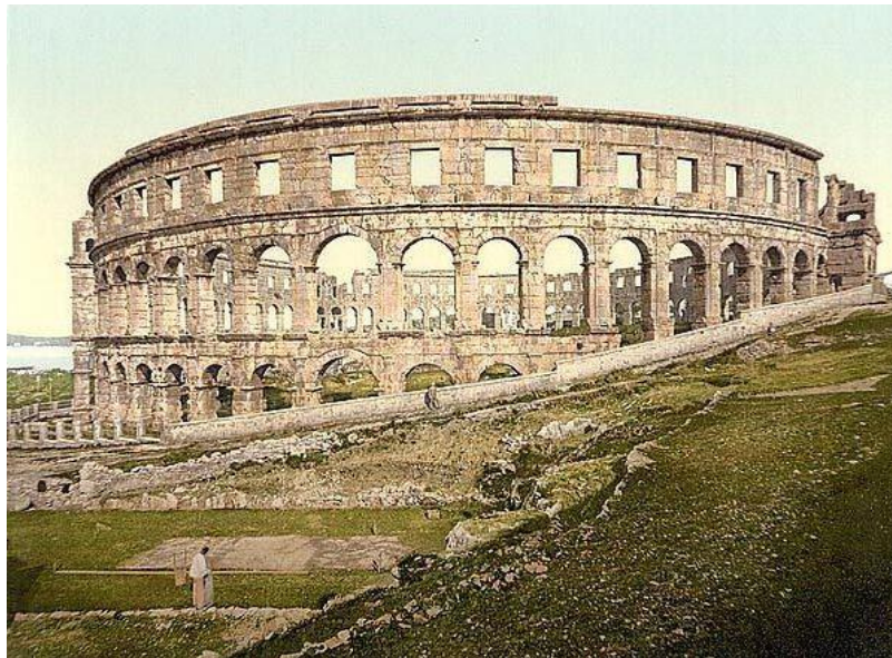
Slika 3. Amfiteatar

Dugačak povijesni period življenja na ovom prostoru ostavio je bogato kulturno povijesno nasljeđe, te se ne kaže uzalud da je Istra, a ujedno i Pula, jedan od najbogatijih europskih regionalnih muzeja. (Blažević, 1984: 63) Pula u svojoj povijesno, kulturnoj i arhitektonskoj riznici ima brojna djela rimske i austrougarske umjetnosti. Među spomenicima arhitekture važno je istaknuti: Amfiteatar (Slika 3.), Slavoluk Sergijevaca, Dvojna vrata, Herkulova vrata, Forum, Augustov hram, Malo rimsko kazalište, Kaštel, Gradska Vijećnica, sakralne spomenike kao što su bazilika Marije Formoze, Katedrala uznesenja Blažene Djevice Marije, crkva sv. Franje. Važne su kulturne ustanove Arheološki muzej Istre te Povijesni i pomorski muzej Istre. (Slika 4.)