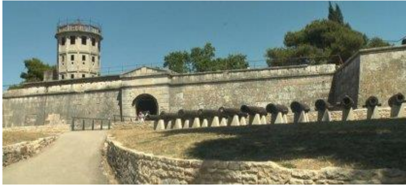
Slika 4. Povijesni i pomorski muzej Istre