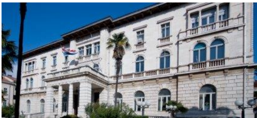
Slika 5. Dom hrvatskih branitelja

Rame uz rame rimskoj arhitekturi idu i mnoga djela austrijske arhitekture kao što su: austrougarske palače stare jezgre Pule – Kuća Benussi, Skrazinova palača, Palača Demartini, Palača Marinoni – te utvrde Fort Bourguignon, Verudela, Casoni Vecchi ili Monteparadiso, Punta Christo, San Giorgio ili Sv. Juraj, Monvidal. Nadalje Mornarička bolnica, Mornaričko groblje, Mornarički park, Mornarički kasino ili današnji Dom hrvatskih branitelja (Slika 5.), Istarsko narodno kazalište, Crkva Gospe od mora, Pulska tržnica, vile – Vila von Trapp, Vila braće Nauta, Vila Emma, Vila Matilde, Vila Franza Murina i druge. Potom pulski parkovi i zelene zone: Giardini, Huguesov park, Lungomare, Monte Zaro, Park pod Arenom, Titov park (Slika 6.), Park Franje Josipa i. i Park kralja Zvonimira, Šijanska šuma i drugi.