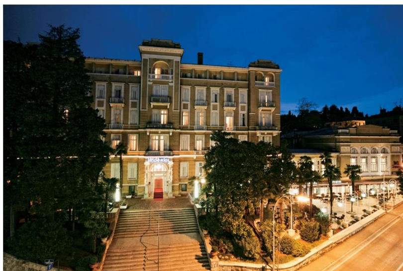
Slika 2. Hotel Imperial