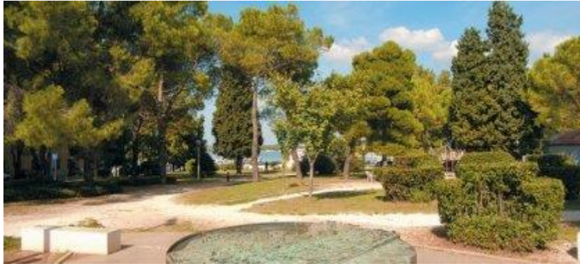
Slika 6. Titov park