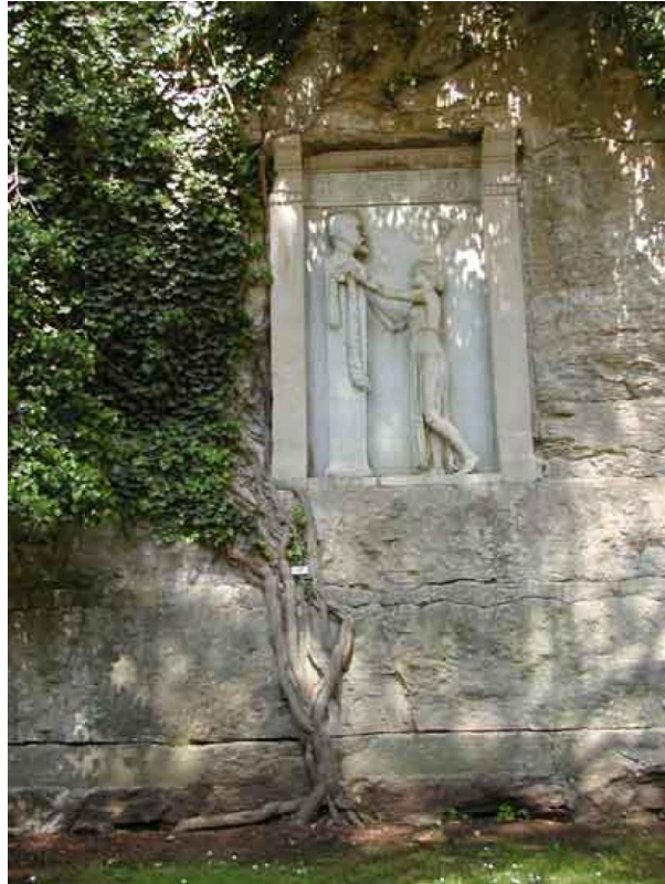
Slika 7. Spomenploča obitelji Kupelwieser na Brijunima