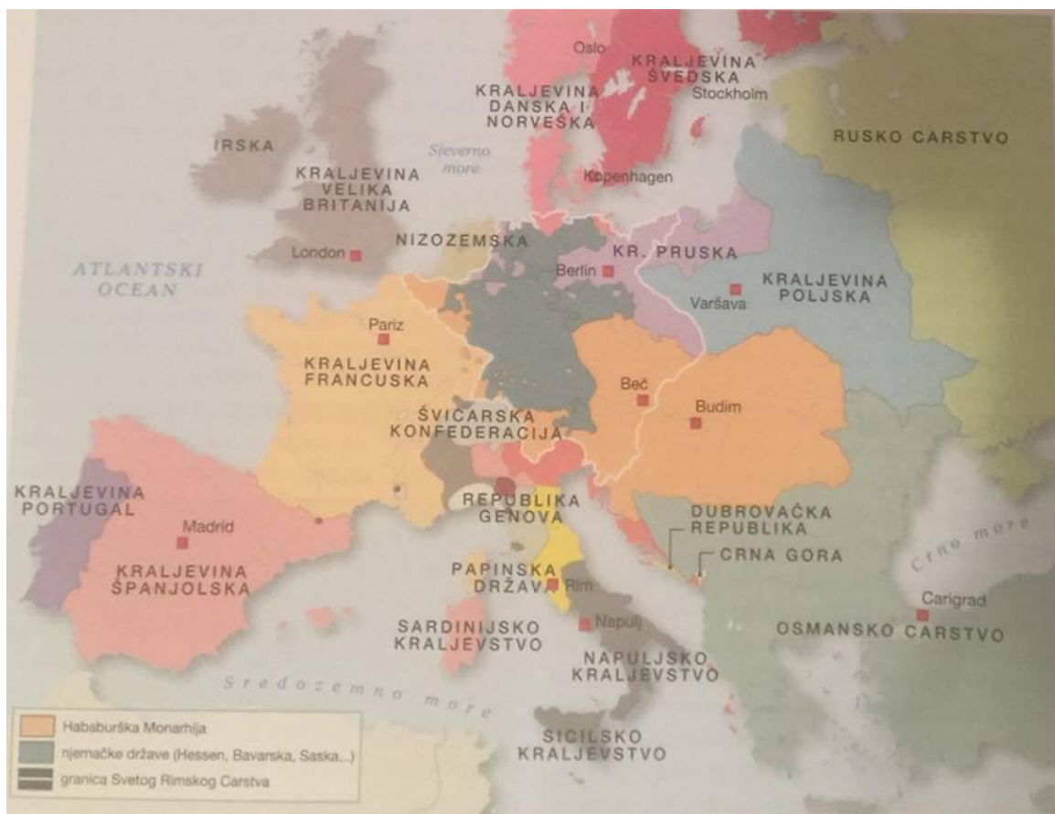
Slika 18. Europa u 18. stoljeću

je izumrla zadnja dinastija Wittelsbachovaca, dolazi do toga da se zemlja našla pod vojvodom Karlom Theodorom Falačkim (koji nema potomaka). Josip II. se dogovara s Karlom Theodorom i nastoji ojačati austrijski položaj u carstvu širom teritorijalnom bazom. Karla nagovara da prizna najproblematičnije zahtjeve za nasljedstvom u donjoj Bavarskoj. Iako se Marija Terezija tome protivila, Josip II. zaposjeda to područje te u Prusiji izbija otpor. Tako izbija Rat za bavarsko nasljedstvo, nazvan još i Krumpirskim ratom ili Ratom košticama šljive, zbog izostanka većih borbi. Ovaj rat je završen na inicijativu Marije Terezije i to mirom u Teschenu. Austrija dobiva dio bavarskog teritorija s oko 60.000 stanovnika. To područje oko rijeke Inn priključuje se zemlji na Ennsi. Ovaj mir je zadnji uspjeh vanjske politike Marije Terezije. 75