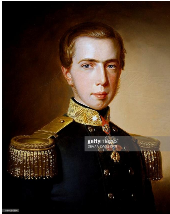
Slika 12. Maksimilijan