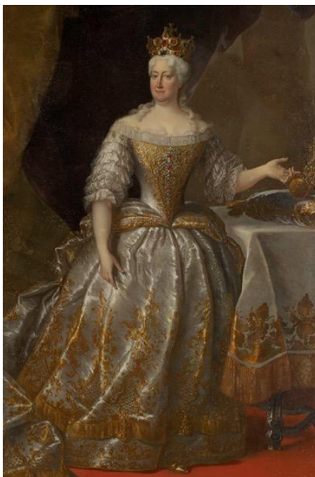
Slika 2. Elizabeta Kristina