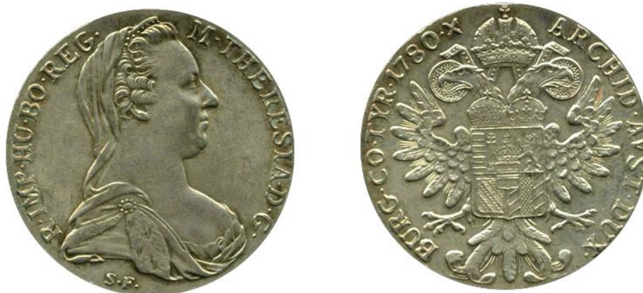
Slika 19. Talir Marije Terezije