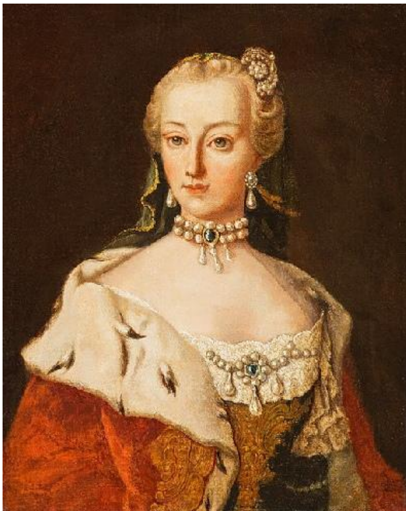
Slika 7. Marija Amalija