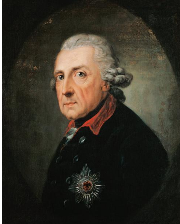
Slika 16. Fridrik II. Pruski