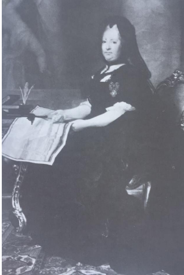
Slika 20. Marija Terezija kao udovica, 1773. godine