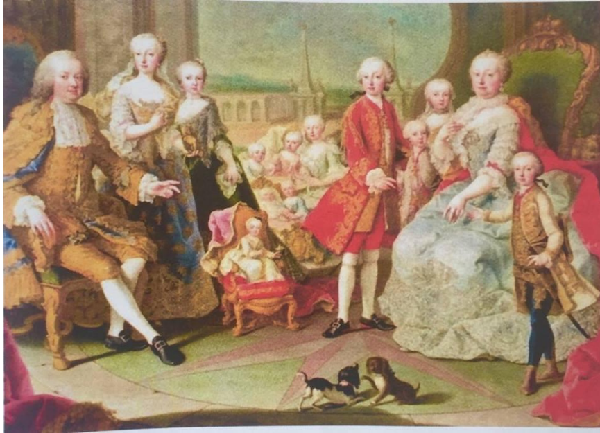
Slika 13. Marija Terezija i njezina obitelj (oko 1754.)

Izvor: Gračanin, Hrvoje, Slavne povijesne ličnosti , Zagreb: Meridijani, 2015., str. 189.