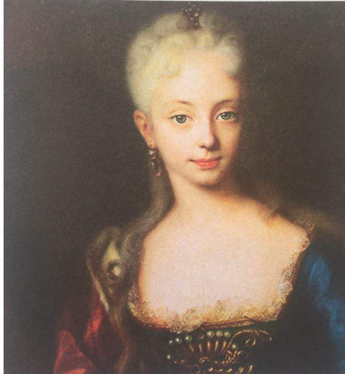
Slika 4. Marija Terezija u dobi od 11 ili 12 godina (Andreas Möller)