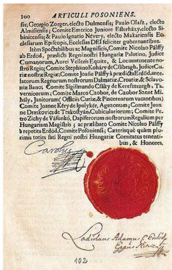
Slika 3. Pragmatička sankcija