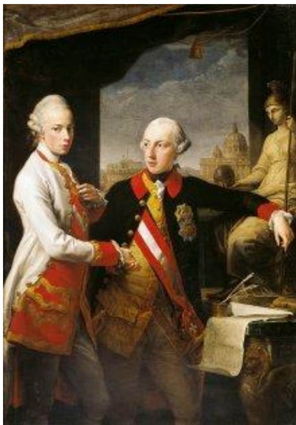
Slika 14. Josip II. i Leopold