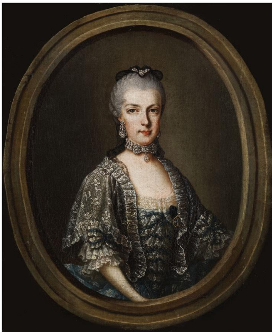
Slika 6. Marija Kristina, oko 1766.