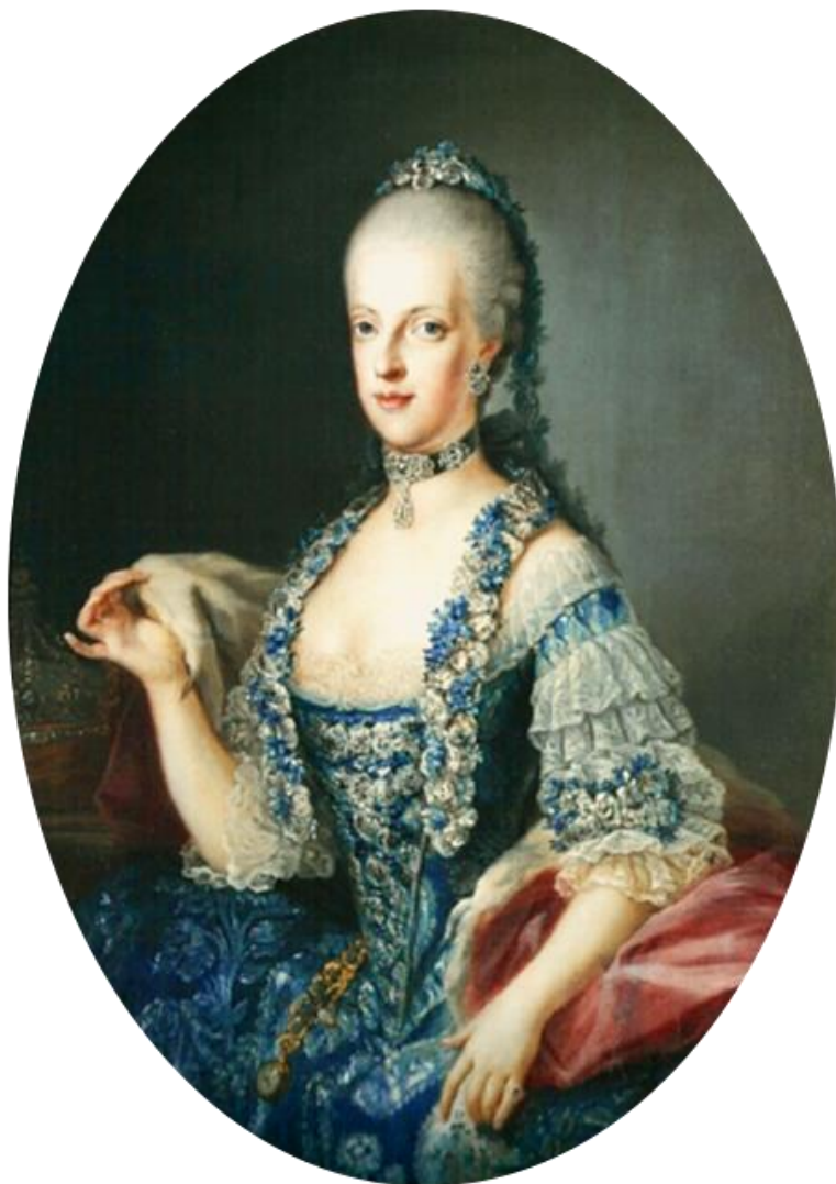
Slika 9. Marija Karolina

Marija Karolina postaje kraljica i ostvaruje san za kojim uzdiše svaka princeza. Prijestolnica joj je postala palača Caserta koja je bila najveća u tadašnjoj Europi. Svojega supruga je htjela voljeti kao što je njezina majka voljela Franju Stjepana pa mu je zato rađala dijete za djetetom, kako ne bi osramotila svoje podrijetlo. 54