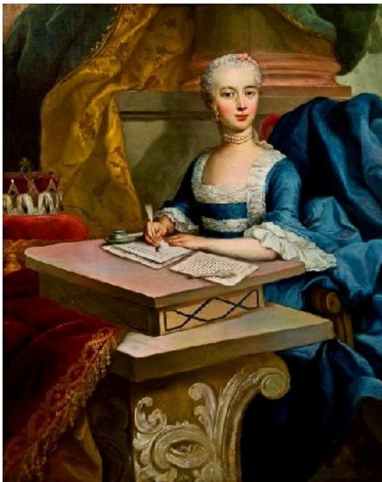
Slika 8. Marija Josipa