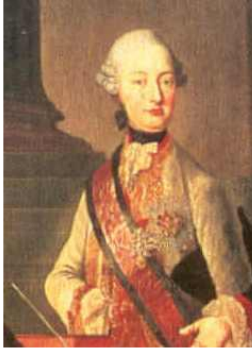
Slika 10. Ferdinand Karlo

Marija Terezija 1. srpnja 1754. rađa četvrtog nadvojvodu, Ferdinanda Karla (1754. – 1806.). Ferdinandu je odabrana žena, princeza Beatrice d'Este, budući da se brak između brata Leopolda i te princeze nije ostvario. Svadba se održava u Milanu 1771. i biva najpogodnija. Tako se još jednom učvršćuju veze s Italijom.