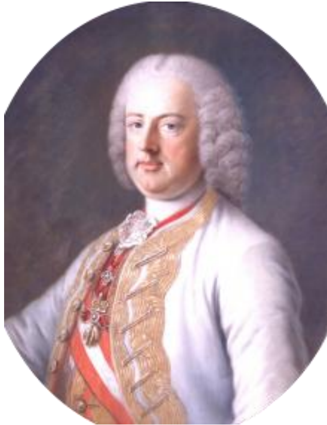
Slika 5. Franjo Stjepan Lotarinški