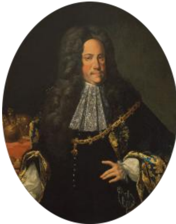
Slika 1. Karlo VI., 1720./1730.

nakon šest mjeseci umire. Elizabeta Kristina je, nedugo nakon toga, opet trudna. Na svijet donosi djevojčicu po imenu Marija Terezija. 12