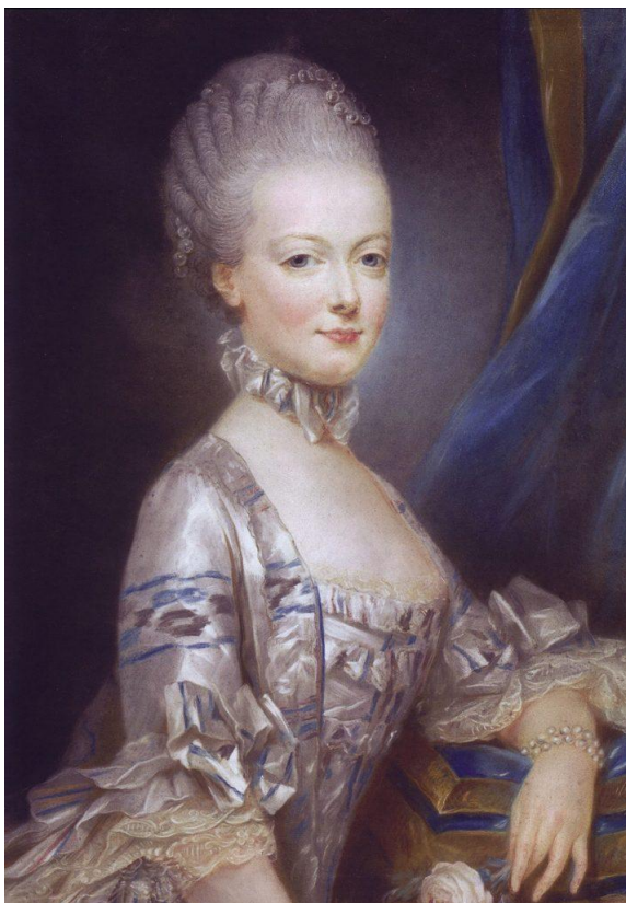
Slika 11. Marija Antonija