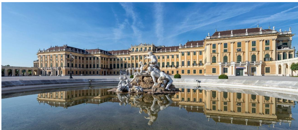
Slika 22. Dvorac Schönbrunn

Izvor: Gračanin, Hrvoje, Slavne povijesne ličnosti , Zagreb: Meridijani, 2015., str. 195.