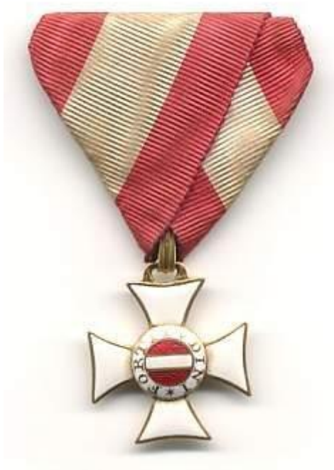
Slika 17. Vojni orden Marije Terezije