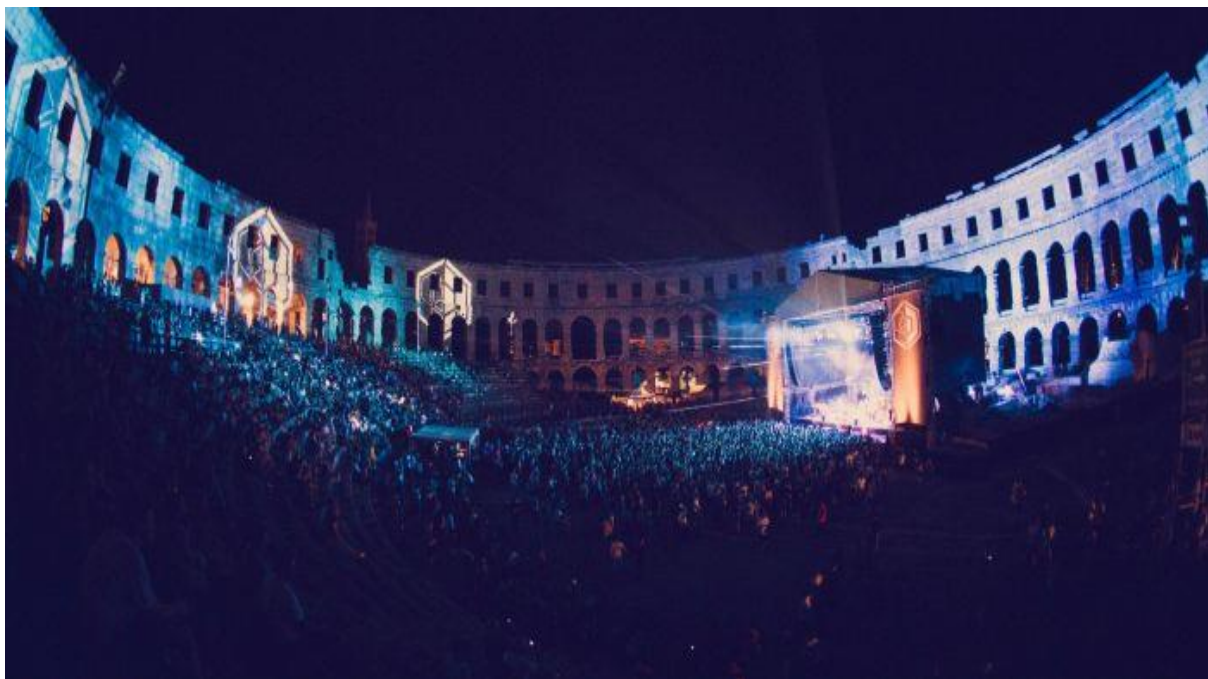
Slika 3. Dimensions festival 15

Dimensions festival dovodi neka od mnogobrojnih najvećih imena svjetske elektronske glazbe. Posjetitelji ovoga prepoznatljivog festivala uživaju u nastupima više stotina izvođača, na niz dnevnih i noćnih pozornica, u zabavama na brodovima i u kampu uz plažu. Izvođači na festivalu predstavljaju house, techno, jazz, funk, soul, drum and bass, psy i pop glazbu. Dimensions festival, također kao i gore navedeni Outlook festival započinje koncertom u amfiteatru Areni te se dan nakon seli na poznatu nam tvrđavu Fort Punta Christo u Štinjanu.