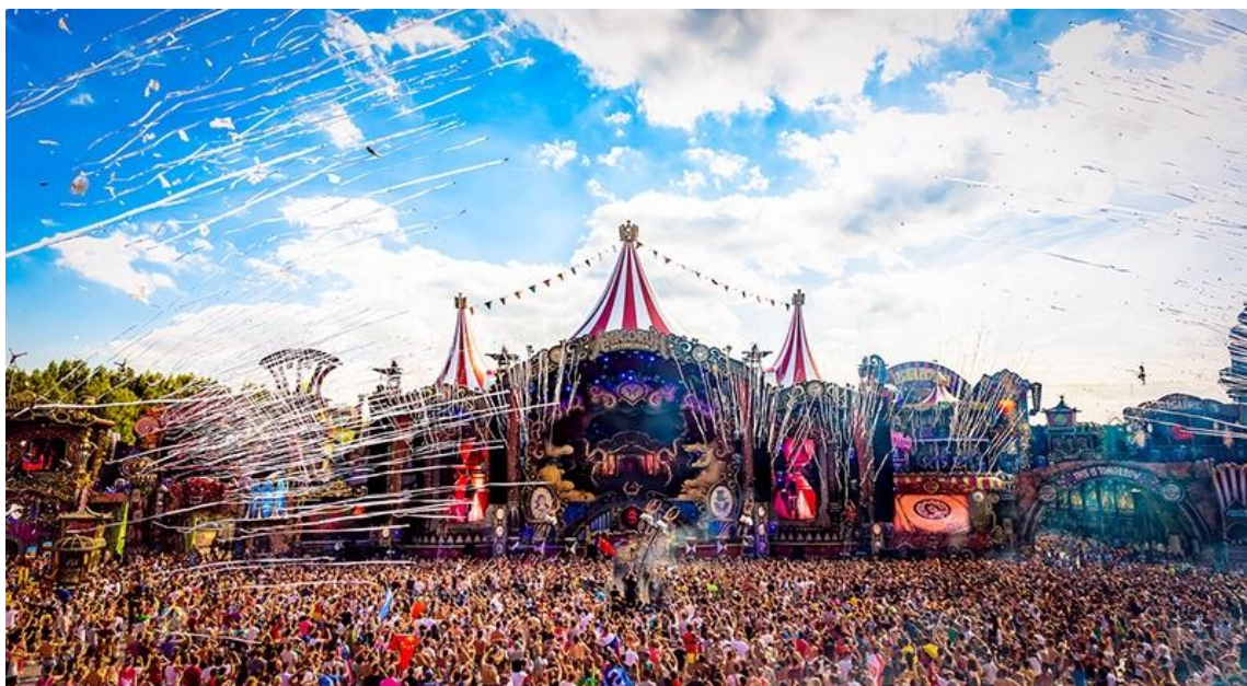
Slika 6. Tomorrowland festival 17

Preko 58 000 posjetitelja borave u festivalskom kampu. Od njih se ostvari prihod u iznosu od 11 400 000 eura koji ne uključuje potrošnju za hranu, piće i ostalo. Od ostalih 142 000 posjetitelja koji potroše na kartu 170 eura se ostvari prihod u iznosu od 24 140 000 eura te u taj iznos ne ulazi potrošnja za hranu, piće i ostalo.