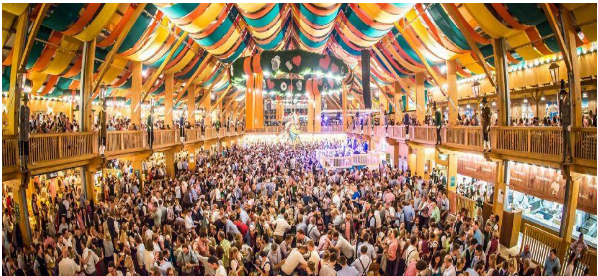
Slika 5. Oktoberfest festival

Traje 16 dana a subotom u točno dvanaest sati u šatoru Schottenhammel gradonačelnik otvara prvu bačvu piva uz povik „Otvoreno je“. Od tada se Oktoberfest smatra otvorenim. Zahvaljujući Oktoberfest-u lokalna zajednica ostvari prihod preko milijardu eura.