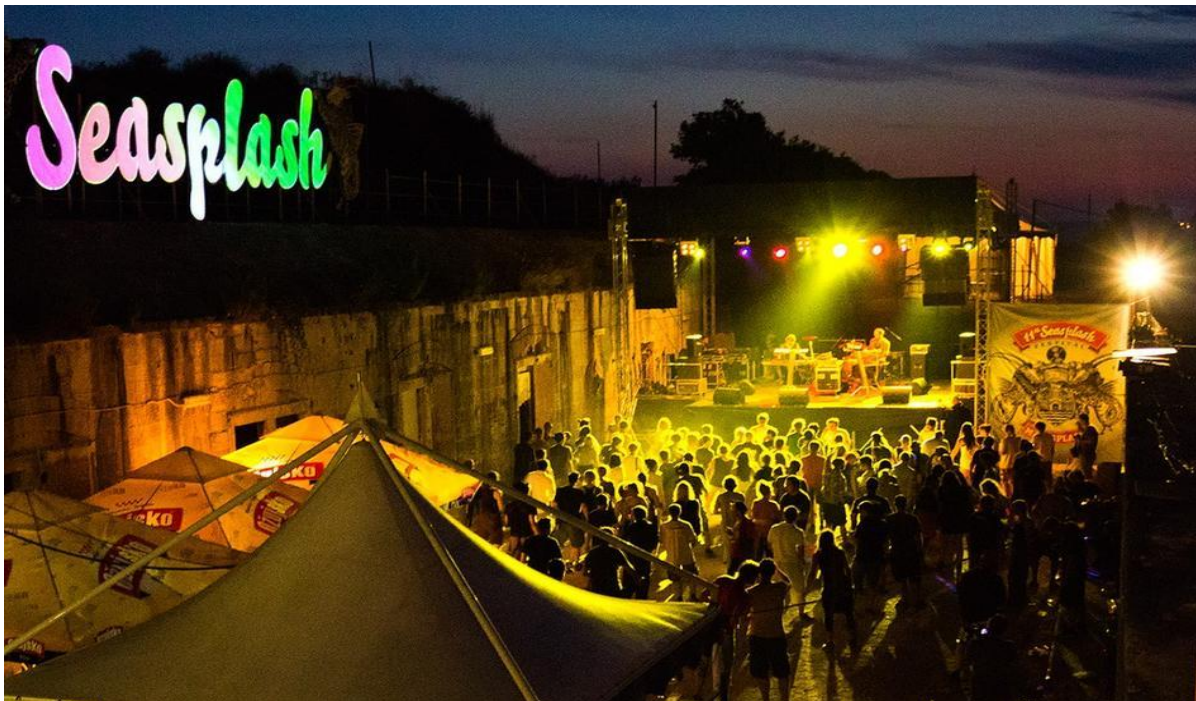
Slika 4. Seasplash festival

Na našoj prekrasnoj tvrđavi Punta Christo u Štinjanu također se svake godine odvija Seasplash festival sredinom srpnja. Seasplash festival je poznat kao dugovječni regionalni festival bass glazbe i soundsystem kulture. Navedeni festival okuplja ljubitelje dub, reggae, drum'n'bass glazbe iz čitavog svijeta. Svake godine organizatori se trude oko organizacije Seasplash festivala i nanovo iznenađuju raznim vizualnim efektima, ukrasima te životnim pozornicama. Ljubitelji Seasplash festivala imaju mogućnost besplatno kampirati neposredno uz more što im pruža tipični ljetni ugođaj i opuštenu atmosferu te se Seasplash smatra jednim od najomiljenijih festivala. U organizaciji Seasplash festivala sudjeluje pulska udruga pod nazivom Edusplash koja aktivno sudjeluje u raznim događanjima i omogućava domaćinima i stranim posjetiteljima da se opuste i dožive festival na pravi način. Prije petnaest godina, točnije 2003.godine održan je prvi Seasplash festival na tvrđavi Punta Christo gdje se i sada odvija. Dvije godine kasnije festival je održan na Marsovom polju te par godina nakon na Monumentima.