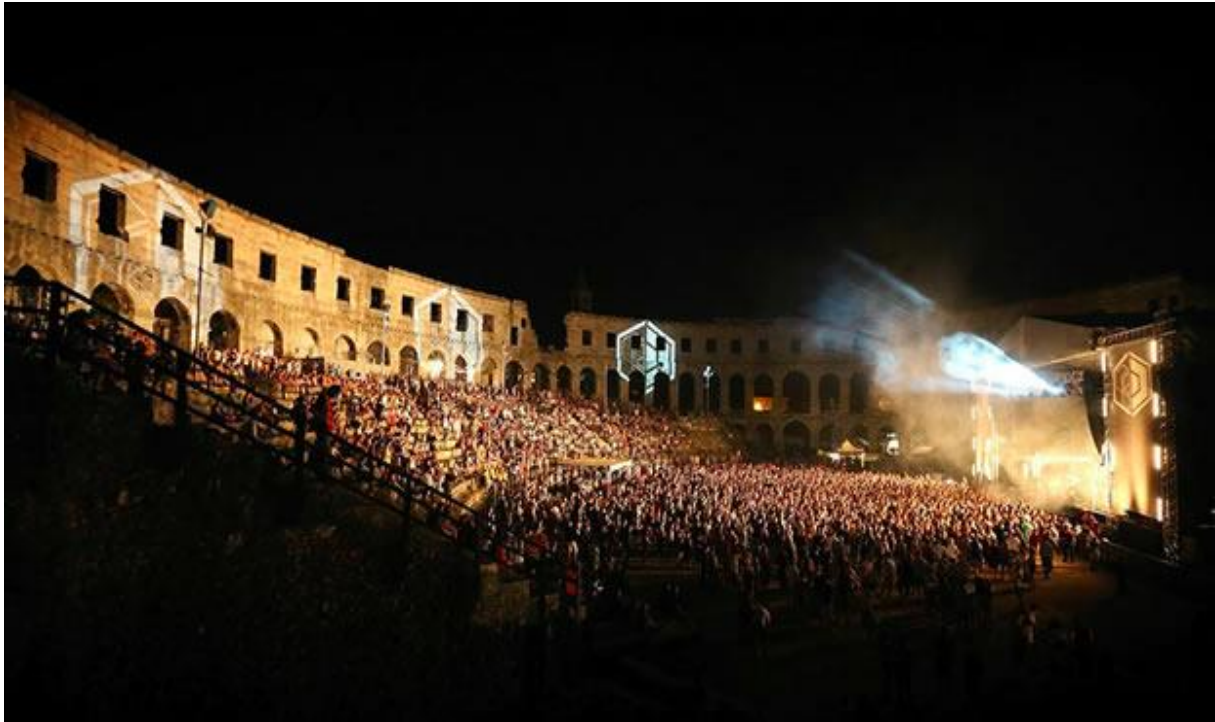
Slika 2. Outlook festival 13

Najveći broj posjetitelja dolazi iz Engleske od kuda i potječe taj festival. Organizatori su nakon prvog održavanja festivala u Štinjanu uvidjeli pozitivne ocjene od posjetitelja te su odlučili da se festival još neko vrijeme održava u Štinjanu. Također puno posjetitelja dolazi i iz Hrvatske, te prisutno je i mnoštvo lokalnog stanovništva.