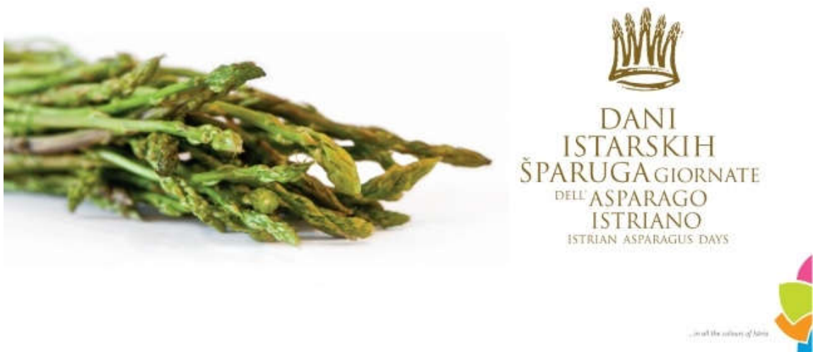
Slika 3. Dani istarskih šparoga