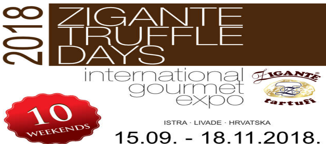
Slika 2. Dani tartufa 2018.