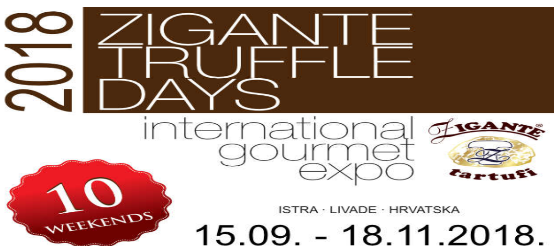
Slika 2. Dani tartufa 2018.