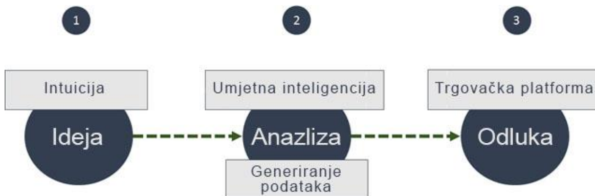
Slika 1: proces inovacijske analize