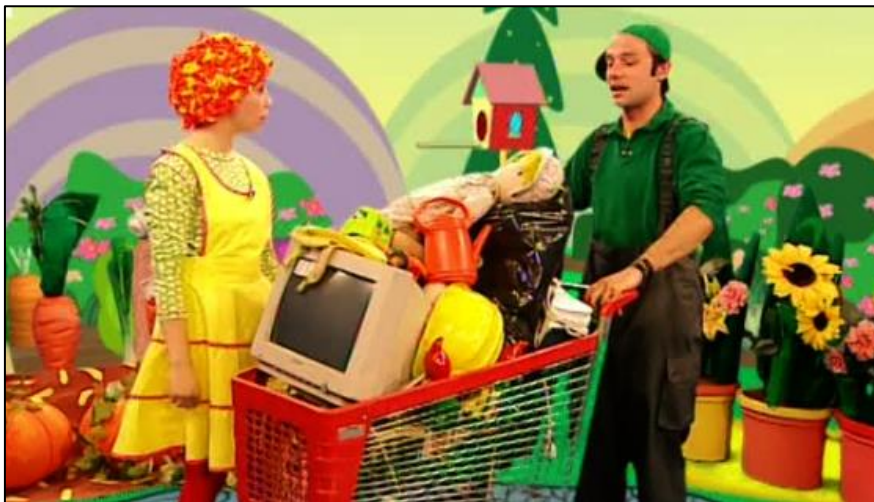
Slika 2: TV vrtić