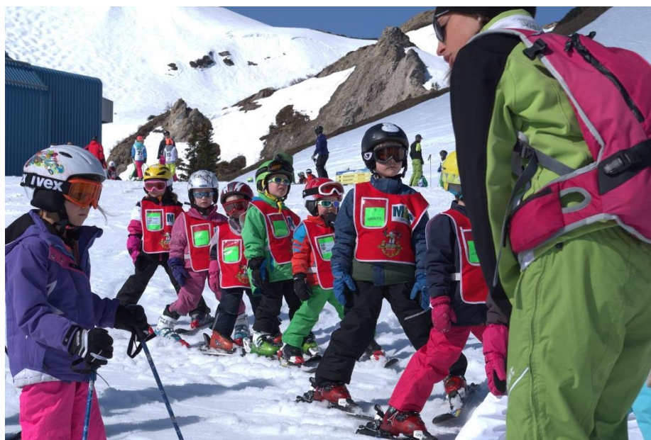
Slika 10. Zimovanje sa djecom predškolske dobi

Tjelesne aktivnosti mogu se provoditi na otvorenom (sanjkanje, igre na snijegu, skijanje, natjecanja, itd.) i zatvorenom prostoru (elementarne igre, dječji plesovi, maskenbal, itd.) (Findak, 1995).