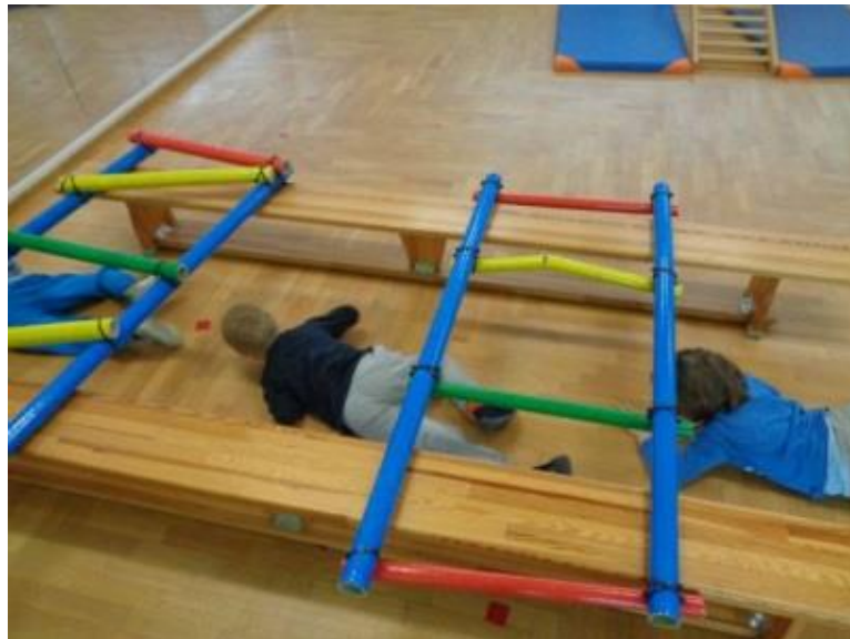
Slika 3. Puzanje djece predškolske dobi

Puzanje pripada djeci jasličke dobi, a utječe pozitivno na snagu i razvoj svih mišićnih skupina, na pokretljivost kralješnice, zglobova i razvoj koordinacije. Intenzivno se pojavljuje sa šest mjeseci te se usavršava tijekom prve godine djetetova života. Kao osnovno puzanje, pretvara se u izvedenice kao što su provlačenje, četveronožno hodanje, a omogućuje sjedanje i stajanje. Nakon što djeca usavrše puzanje, počinju savladavati te upoznavati prostor oko sebe, a samim time se krenu i provlačiti i zavlaciti (ispod kreveta i krevetića, u otvoreni ormar...). Za djecu zavlacanje i provlačenje su vrlo naporni, ali pozitivno utječu na razvoj mišića trupa, ramenog pojasa i ruku. Kao kineziološki sadržaj, puzanje se najčešće sa djecom provodi ležeći na truhu, boku ili leđima. Također, može se provoditi i u različitim smjerovima (naprijed, nazad, s promjenom smjera, itd.) (Neljak, 2009).