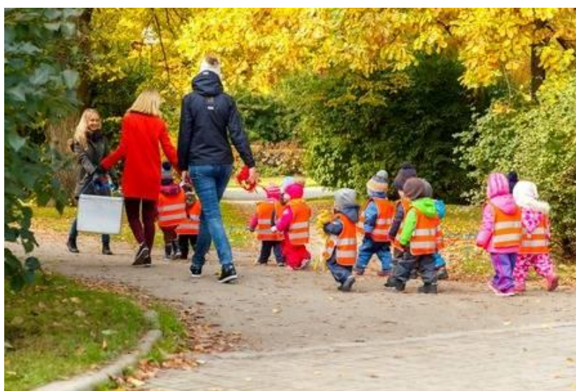
Slika 9. Šetnja prirodom