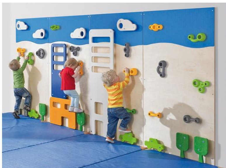
Slika 4. Penjanje djece predškolske dobi