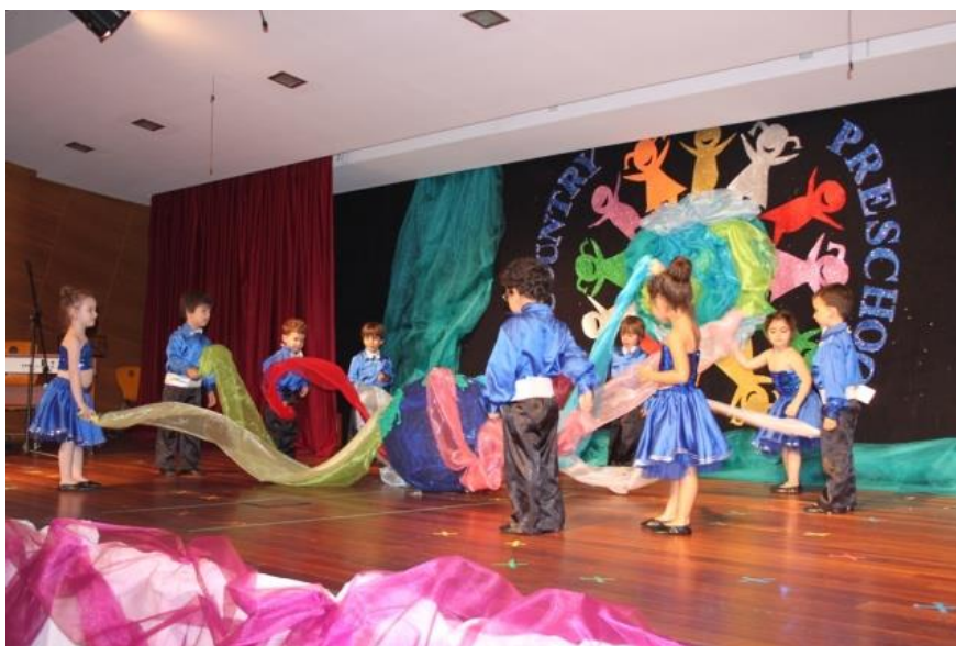
Slika 12. Priredba djece predškolske dobi

Priredbe se mogu održavati tijekom cijele godine, unutar svake dobne skupe, između skupina ili kod obilježavanja važnih događaja mogu se organizirati i priredbe za roditelje.