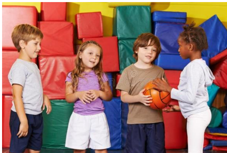
Slika 5. Hvatanje i bacanje lopte

Hvatanje zahtijeva izrazito skladan rad mišića ruku i ramenog pojasa te njihovu usklađenost s procjenom udaljenosti nadolazećeg predmeta i brzinom njegova leta (Neljak, 2009:52). Hvatanje je izrazito zahtjevna aktivnost za predškolsku djecu, a djeca u mlađoj dobnoj skupini ne mogu precizno bacati ili hvatati loptu uspješno. U srednjoj dobnoj skupini djeca mogu ubacivati predmete u košaru iz blizine, no tek se u starijoj dobnoj skupini kod određenog boja djeca savlada relativno precizno bacanje lopte, dok manji broj djece savlada „ispravno“ hvatanje lopte (Neljak, 2009).