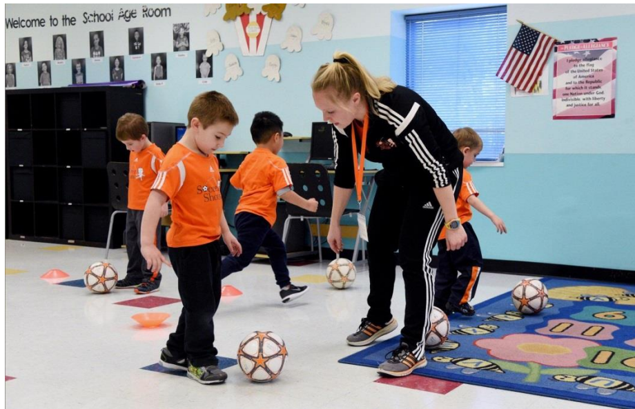
Slika 8. Sat sportskog/ tjelesnog vježbanja

usuglašeni s potrebama pojedinog programa (plivanje, skijanje, sportska gimnastika itd.) U pravilu se provodi samo s djecom starije vrtićke dobi, najčešće u sportskim igraonicama i sportskim klubovima traje 60 minuta (tenis, plivanje itd.), dok u pojedinim sportskim klubovima traje 45 minuta (sportska gimnastika).