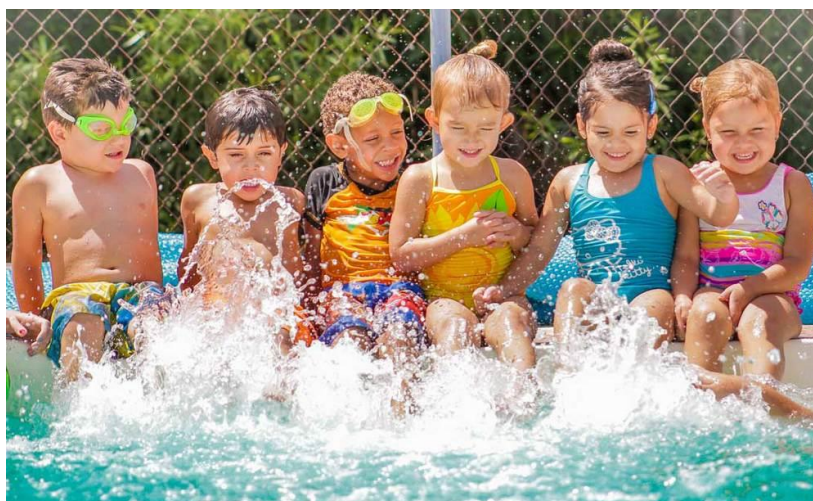
Slika 11. Ljetovanje djece predškolske dobi

Na ljetovanju razlikujemo sadržaje i aktivnosti na otvorenim športskim površinama, sadržaje i aktivnosti u prirodi te posljednje sadržaje i aktivnosti uz vodu i u vodi (Findak, 1995).