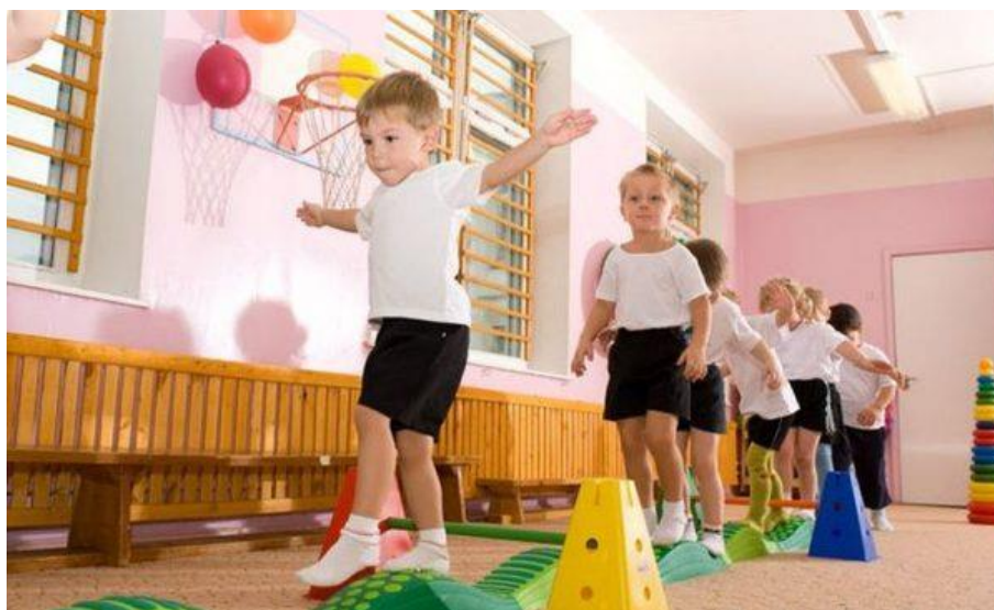
Slika 6. Kineziološke igre