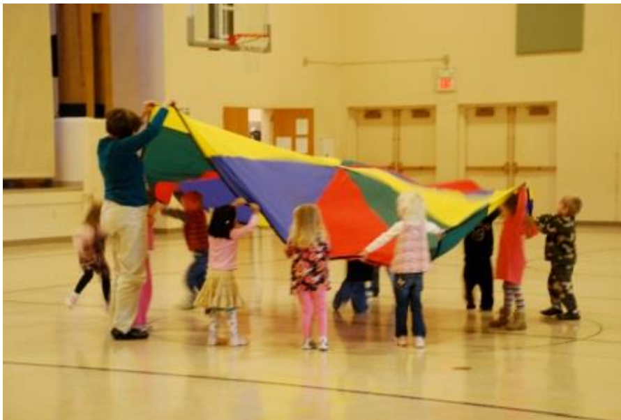
Slika 7. Sat tjelesne i zdravstvene kulture

Kod starije dobne skupine sat tjelesne i zdravstvene kulture traje 35 minuta, od toga uvodni dio traje 2-4 minute, pripremni dio sata traje 7-9 minuta, glavni dio sata traje 20-22 minuta, a završni dio sata traje 2-4 minute.