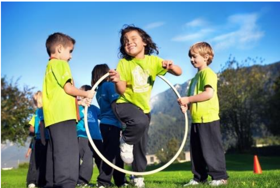
Slika 1. Tjelesna i zdravstvena kultura djece predškolske dobi

U posebnim ciljevima tjelesne zdravstvene kulture naglašava se kako je važno formirati tjelesno dobro i skladno te zdravo razvijeno dijete koje može slobodno vladati motorikom, razvijati osjetljivost djeteta te važnost poticanja razvoja zdravstvene kulture zbog očuvanja i unaprjeđivanja zdravlja (Findak,1995).