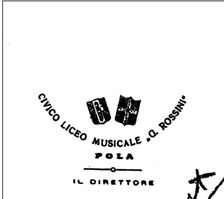
5. Fotografija pečata Glazbenog liceja Gioachino Rossini

Rad ustanove bio je međutim praćen mnogobrojnim problemima povezanim s formalno-pravnim statusom. Iako je škola radila prema nastavnom programu ministarstva školstva, nije bila izjednačena s državnim glazbenim institutima, pa joj je školski inspektorat osporavao pravo da izdaje diplome i svjedodžbe. Škola je rješavanje problema prepustila prefektu (gradonačelniku) a on je pak tražio mišljenje od nadležnog Ministarstva koje je dozvolilo da da privatna glazbena institucija izdaje diplome, koje međutim mogu vrijediti samo kao potvrda završenih glazbenih studija i nemaju značenje pravnoga akta, tj. nisu izjednačene s diplomama koje izdaju državni glazbeni instituti. Unatoč što škola nije imala službenu dozvolu za upotrebu imena "gradska", niti je bila financirana iz sredstava gradskog proračuna, općina se nije protivila uporabi imenu ni korištenju gradskog pečata. Nakon 1936. godine ni u dnevnome tisku ni u arhivskim vrelima nema podataka o njezinu djelovanju. 12