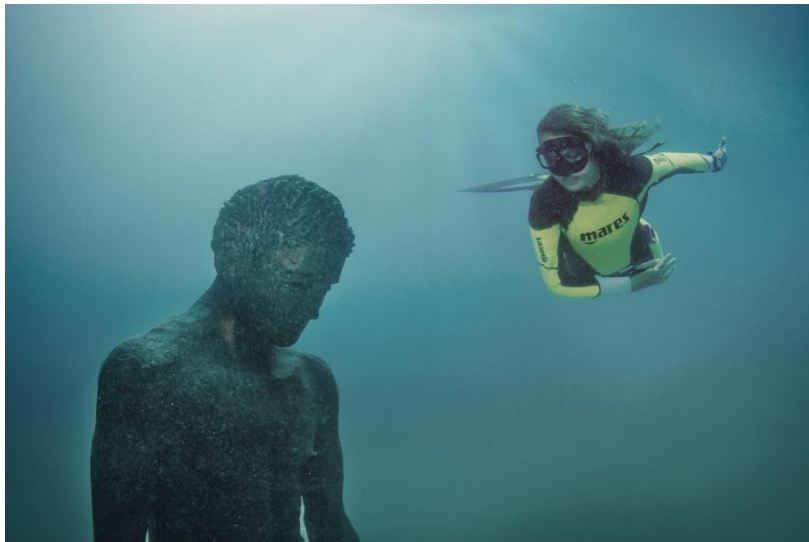
Slika 5. Skulptura Apoksiomena u Podvodnom arheološkom parku

Izvor: https://www.visitlosinj.hr/EasyEdit/UserFiles/Catalog/podvodni-arheoloski-park/podvodni-arheoloski-park-636706304073945724_1600_900.jpeg , 13.09.2018.