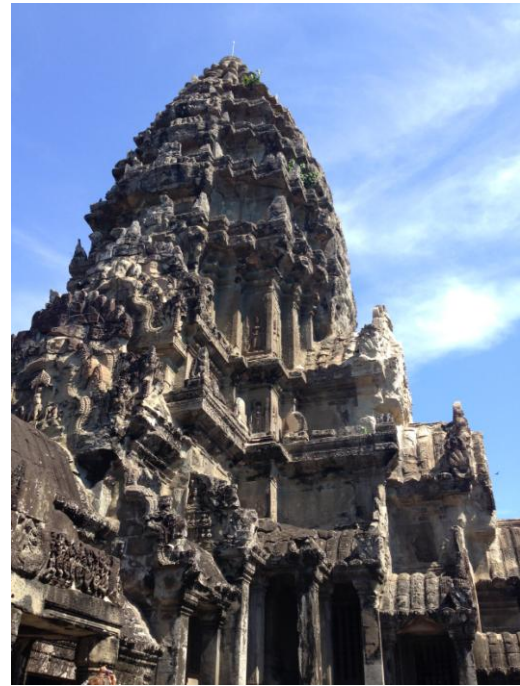
Slika 7. Angkor Tom