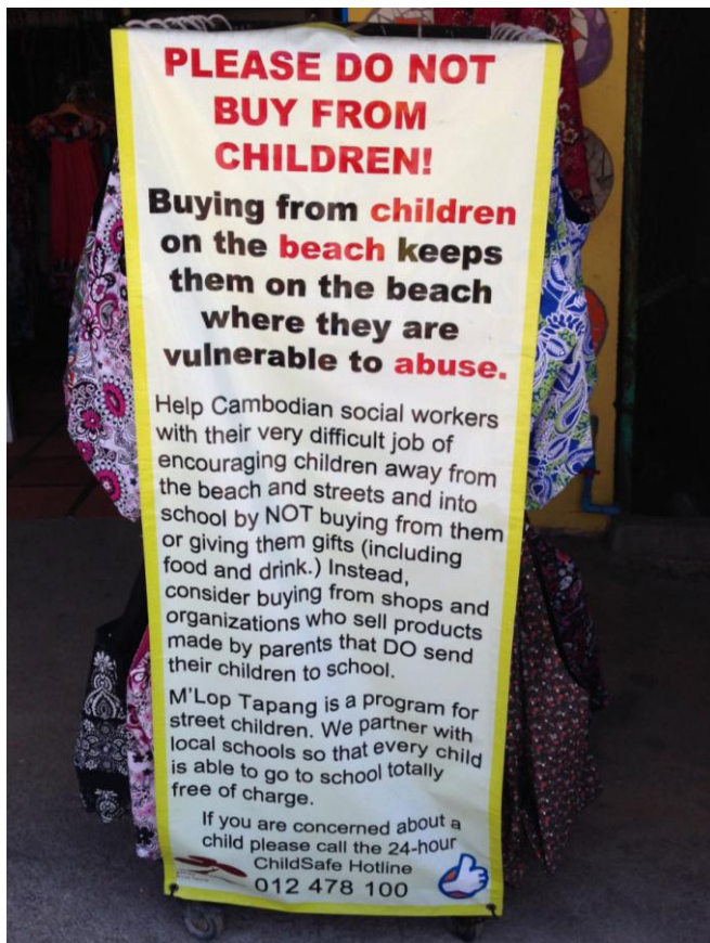
Slika 9. Obavijest o načinu zaštite djece na ulicama i plažama Kambodže