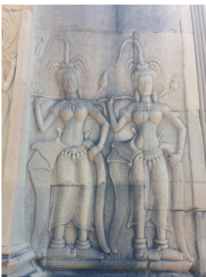
Slika 8. Prikaz Apsara plesačica na zidovima Angkor wata