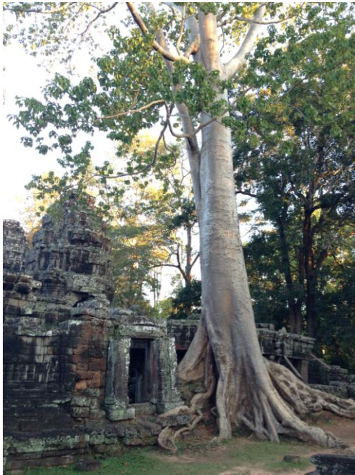
Slika 6. Ta Prohm hram