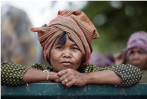
Slika 5. Krama – tradicionalan šal u Kambodži