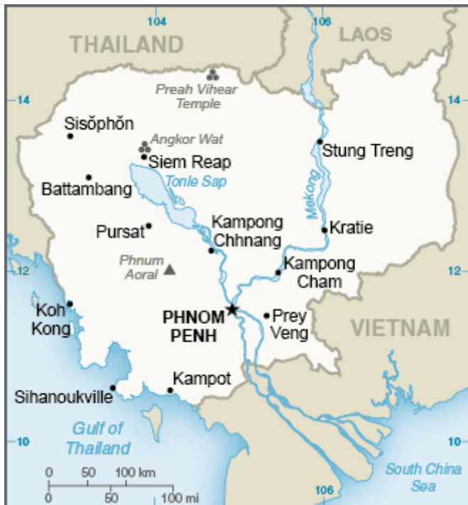
Slika 4. Zemljopisna karta Kambodže