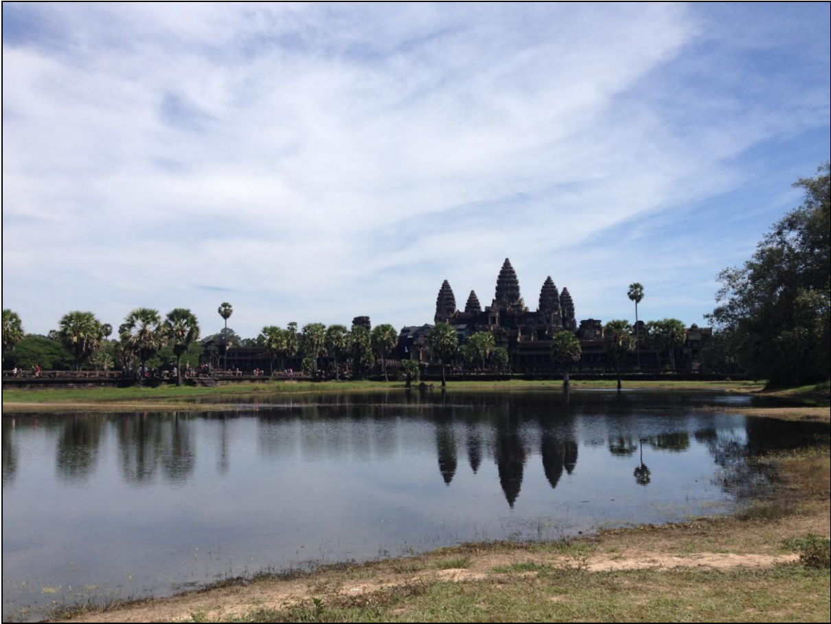
Slika 3. Angkor Wat