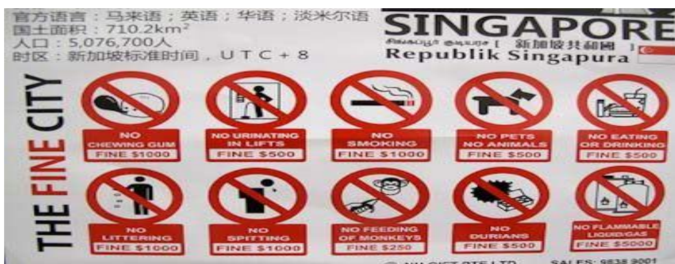
Slika 2. Kazne/globe u Singapuru