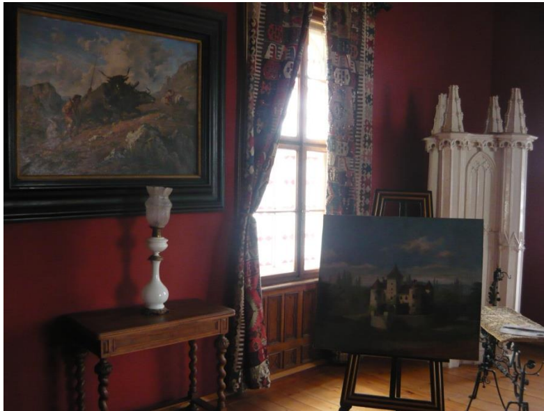
Slika 7. Julijanina soba

Julijanina soba je slikarski atelje grofice Julijane Erdödy Drašković, koja je označila početak akademskog realizma. Sve što ju je okruživalo i dalje se nalazi u ovoj prostoriji, uključujući i slikarski stalak, stolić za boje i palete, klavir i slike (slika 7.).