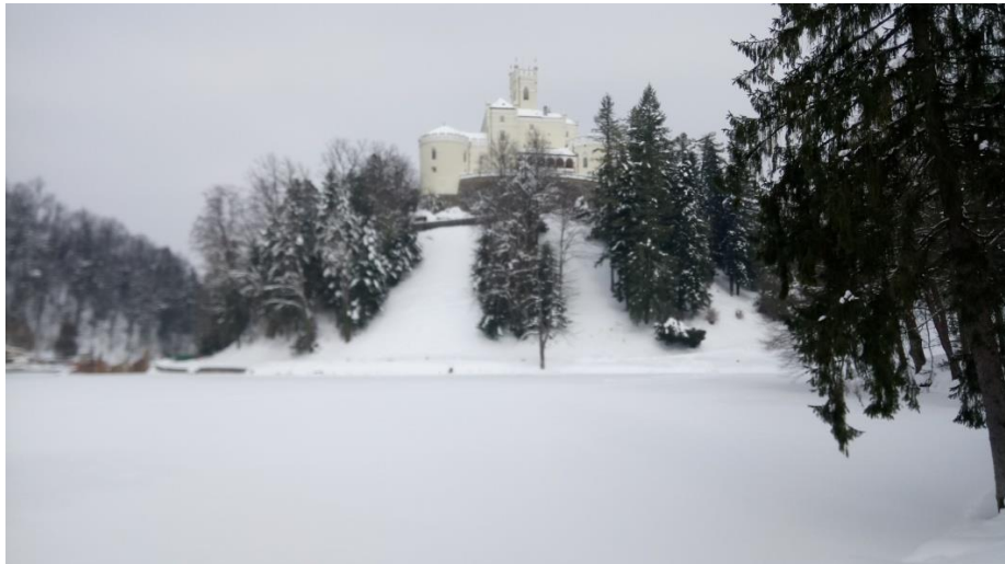
Slika 1. Trakošćansko jezero

čekaju u skoroj budućnosti. Vode koje se slijevaju u jezero donose i opasnost te se u kišnim razdobljima stvaraju naslage mulja, što dovodi do srašćivanja jezera. Potom, tu je i problem ispiranja organskih tvari s obližnjih obradivih poljoprivrednih površina koje se slivaju u jezero i u konačnici dolazi do sve većeg zarašćivanja jezera.