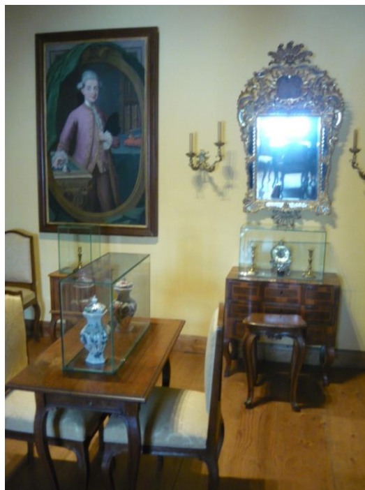
Slika 8. Klasicistička soba

ladicama i tajnim ladicama. Osim namještaja, unutar rokoko sobe nalaze se obiteljski portreti koji nastavljaju slijed portreta vladara i vojskovođa iz viteške dvorane. Soba oslikanih zidnih tapeta obložena je platnenim tapetama koje čine jednu sliku u kojoj se prikazuje sedmogodišnji rat Draškovićeve postrojbe (1756.-1763.). Sastoji se od osam tapeta koja prikazuje 821 osobu koje su slikane temperom. One su naslikane detaljno s odorama vojnika, opremom i zastavom. Važno je istaknuti mali orkestar koji je prvi likovni prikaz vojne glazbe u Hrvatskoj. U časničkoj sobi su portreti četrdeset časnika Josipa Kazimira Draškovića. Pretpostavlja se da su djelo Johanna Michaela Millitza. Časnici su slikani u pozama do pojasa, s realnim prikazom lica. Osim portreta tamo su smještene i dvije zastave koje su pripadale konjici te pješastvu. Klasicistička soba je namještena u duhu klasicizma (18. i 19. stoljeće). Tamo je i namještaj za dnevni odmor u kojemu su dva svijećnjaka iz doba Napoleona, pod utjecajem Egipta (slika 8.).