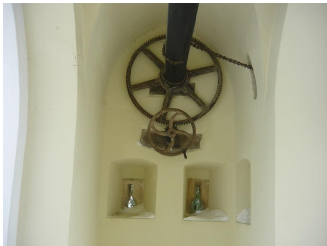
Slika 3. Puškarnice i mehanizam za otvaranje mosta

Druga dinastija Draškovića, Ivan II. i Petar, dograđuju trakošćanski dvorac izgrađujući zapadnu kulu, čiji nam je dokaz grb i natpis. Pretpostavlja se da su topovi, mužari i teške puške kukače ili puške fitiljače nabavljeni za naoružavanje upravo te kule, što nam dokazuju puškarnice (slika 3.) koje se nalaze duž cijele kule. Na ulazu u dvorac postavljen je mehanizam za otvaranje mosta na samome ulazu.