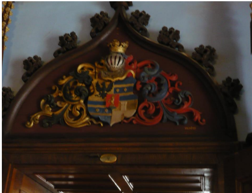
Slika 6. Grb obitelji Erdödy

obitelji Erdödy (slika 6.), koja je bila značajna za taj dio Hrvatske. Danas se taj grb nalazi na zastavi Varaždinske županije.