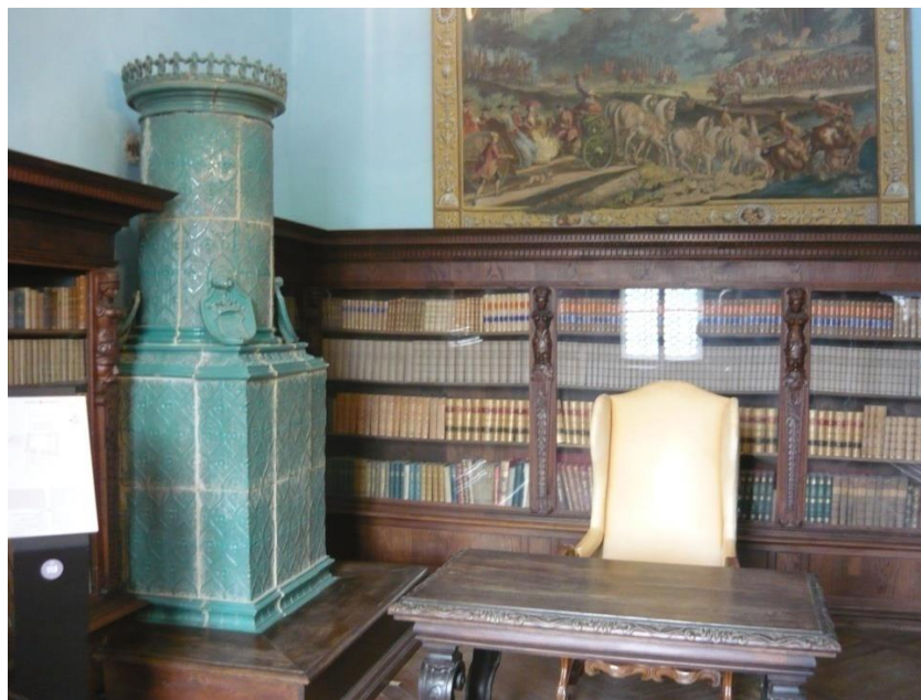
Slika 5. Velika knjižnica

U predvorju je izložena Velika genealogija na kojoj je prikazano razgranato stablo koje raste iz Ivana Draškovića koji je ujedno i predak te velike obitelji. „Ta impresivna slika velikih dimenzija nastala je 1668., na temelju podataka koje u svom djelu o povijesti obitelji Drašković donosi Franjo Ladanyi, upravitelj hrvatskih posjeda i dobara obitelji, od 1650. do 1680.“ 16 Pored stabla je prikazan pejzaž Trakošćana. Ta slika je najstariji prikaz grada koji prikazuje njegov stvaran izgled u prošlosti. „Na toj slici Trakošćan je dotada najkompletnije obrambeno izgrađen, okružen kulama, obrambenim zidovima i hodnicima, a u sredini se diže visoka zgrada s tornjem na kojem je sat i krovčić u obliku lanterne.“ 17 Knjižnica je prvotno osmišljena kao radna soba te je bila opremljena neorenesansnim namještajem. U knjižnici se nalazi oko 1700 knjiga, enciklopedija i beletristička izdanja iz 18. i 19. stoljeća (slika 5.).