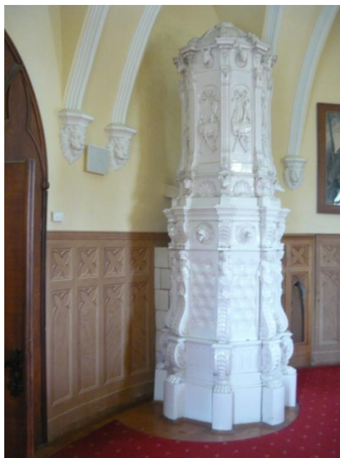
Slika 4. Kalijeva peć sa lovačkim motivima

U visokom prizemlju nalazi se lovačka dvorana, predvorje, knjižnica, viteška dvorana, obiteljska dvorana i malo dvorište. Lovačka dvorana smještena je u istočnoj kuli dvorca te predstavlja lovačku tradiciju Draškovića kojom se muški dio obitelji bavio u slobodno vrijeme, što ne čudi zbog bogatog životinjskog svijeta i divljači u okolici. To je također bila i blagovaonica. Interijer je bogato uređen lovačkim trofejima brojnih ulovljenih i prepariranih životinja. Namještaj je izrađen od orahovine, a tapeciran je tkaninom zelene boje. Jako je važno naglasiti bijelu peć ukrašenu reljefom lovačkih motiva (slika 4.) Peć je ukrašena motivima kao što su lovački pas, lav, medvjed, lisica, ovca na vrhu peći, torba, puška i truba.