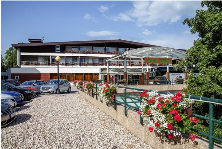
Slika 8. Hotel Jezero ( https://www.booking.com/ , 23.7.2018.)

najvećim kapacitetom, a uključuje i teretanu, kuglanu, frizerski salon, bazen, saunu i parnu kupelj. Također, ovo je jedan od vodećih kongresnih hotela u Lici s kongresnom dvoranom i dvoranama za sastanke Flora i Sedra, te još dvije manje dvorane.