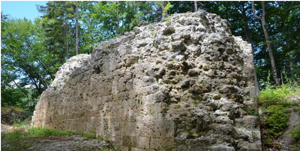
Slika 4. Gradina Krčingrad

Unatoč postojanju mnogih arheoloških lokaliteta, većina njih nije istražena i ne koriste se u turističke svrhe. Jedan od bolje istraženih objekata kulturno-povijesne baštine je gradina Krčingrad, poznata i kao gradina Kozjak. Smještena je na poluotoku između Kozjaka i Gradinskog jezera, a specifična je po svojoj trokutastoj kuli, kakva postoji na još samo tri lokacije u Europi, što ju čini rijetkim primjerom srednjovjekovne arhitekture. 29 Ova se gradina nalazi na Listi preventivno zaštićenih kulturnih dobara.