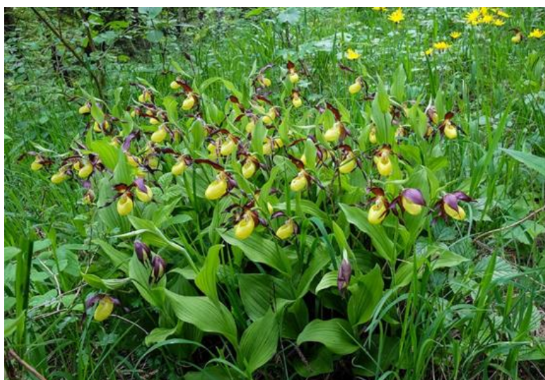
Slika 3. Gospina papučica

su ove vrste često istrebljivane, pa zbog toga i vrlo rijetke. Zastupljene su i neke endemične i ugrožene vrste flore. Iako endemi čine svega 1,7% vrsta na prostoru Parka, oni nisu nevažni i zanemarivi. Neke od endemičnih vrsta su livadni procjepak, krški kukurijek i hrvatski karanfil, te šupaljka. Za razliku od endemičnih, na ugrožene vrste otpada gotovo 5% sve flore Plitvičkih jezera. Neke od njih su zlatna jezičnica, koja je kritično ugrožena na globalnoj razini, te joj je Park jedino nalazište na prostoru jugoistočne Europe, ali i puzavi celer. Također, poznate su i tri biljke mesožderke, od kojih je kritično ugrožena vrsta pod nazivom obična tustica, dok su ostale dvije, okruglolisna rosika i mala mješinka. 24