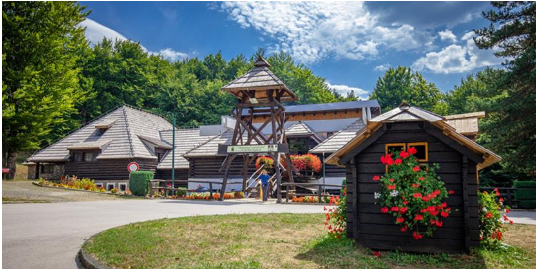
Slika 9. Lička kuća ( https://np-plitvicka-jezera.hr/ , 23.7.2018.)

Usluge hrane i pića, osim restorana, nude i tri bistroa, Vučnica, Hladovina i Kozjačka draga, te buffeti, Kupalište, Labudovac i Slap. Bistro Vučnica nalazi se u sklopu skijaškog centra u naselju Mukinje, a Kozjačka draga, na poljani uz obalu jezera Kozjak. Na obali Kozjaka smješten je i buffet Kupalište. Cafe-bar Rapajinka nalazi se na Stanici 1, a Flora na Stanici 2 panoramskog vlaka, u podnožju hotela Jezero. 36