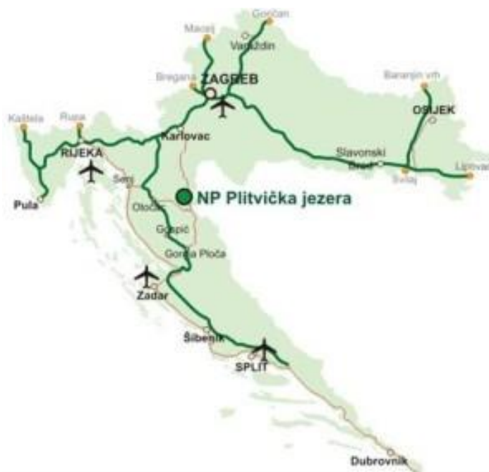
Slika 1. Položaj Nacionalnog parka Plitvička jezera na karti Republike Hrvatske ( https://hotel-mirni-kutak.hr/ , 5.8.2018.)

Plitvička jezera nalaze se u Gorskoj Hrvatskoj, između planinskog lanca Male Kapele, koja se prostire na zapadu i sjeverozapadu, te Ličke Plješevice, smještene jugoistočno od jezera. Prostiru se kroz dvije županije, Ličko-senjsku, kojoj pripada čak 90,7% površine, te Karlovačku, na koju otpada preostalih 9,3%. 2