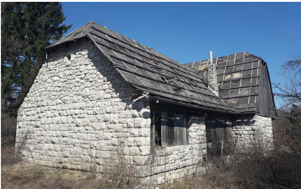
Slika 6. Lugarnica Prijeboj

Na prostoru Plitvičkih jezera, sredinom 20. stoljeća, izgrađene su i tri lugarnice, od planiranih deset. Od njih, najbolje je očuvana ona u Čorkovoj uvali, koja je zajedno s lugarnicom Prijeboj, zaštićeno kulturno dobro. Treća lugarnica, sagrađena je u naselju Poljanak, ali je uništena tijekom Domovinskog rata, dok je lugarnica Prijeboj u ruševnom stanju, a ona u Čorkovoj uvali predviđena za rekonstrukciju. Na granici Nacionalnog parka, u selu Korana, postoji i mlin, te pilana na vodeni pogon, koji su rijedak primjer sačuvanog narodnog graditeljstva, ali i primjer iskorištavanja vode kao izvora energije, zbog čega su i zaštićeni. Mlinski kamen koji melje žitarice djeluje uslijed okretanja osovine, do kojeg dolazi radi pad vode na mlinsko kolo. Mlin, koji je stanovništvo nekoć koristilo za meljenje žitarica, i u kojem se nalaze tri mlinska kamena, kao i mlinareva soba, danas se koristi u turističke svrhe, nakon što je obnovljen 2002. godine radi oštećenja nastalih tijekom Domovinskog rata. Pilana se nalazi svega 50 metara od mlina, te funkcionira na principu vode koja pokreće kotač, što uzrokuje pokretanje pile. Ovaj je objekt izgrađen u prvoj polovici 20. stoljeća, a obnovljen na samom početku 21., baš kao i mlin.