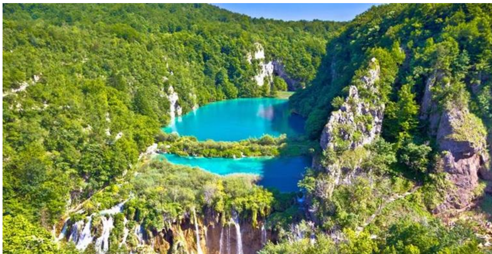
Slika 2. Jezero Novakovića Brod

novi slapovi i kaskade. 16 Uz pomoć algi i mikroorganizama, taloženjem kristala kalcijevog karbonata iz vode, nastaju sedrene barijere. 17 Neki od brojnih slapova nastalih tim procesom su i Veliki slap, te slapovi Milke Trnine, imenovani po hrvatskoj opernoj pjevačici koja je, krajem 19. stoljeća, donirala novac tadašnjem Društvu za uređivanje i poljepšanje Plitvičkih jezera. 18