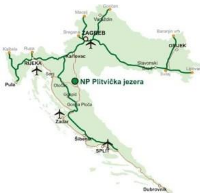
Slika 1. Položaj Nacionalnog parka Plitvička jezera na karti Republike Hrvatske ( https://hotel-mirni-kutak.hr/ , 5.8.2018.)

Plitvička jezera nalaze se u Gorskoj Hrvatskoj, između planinskog lanca Male Kapele, koja se prostire na zapadu i sjeverozapadu, te Ličke Plješevice, smještene jugoistočno od jezera. Prostiru se kroz dvije županije, Ličko-senjsku, kojoj pripada čak 90,7% površine, te Karlovačku, na koju otpada preostalih 9,3%. 2