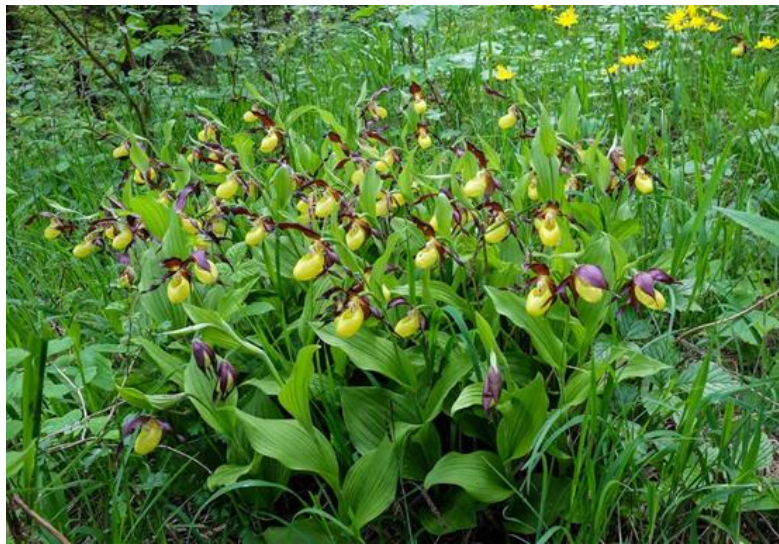
Slika 3. Gospina papučica

su ove vrste često istrebljivane, pa zbog toga i vrlo rijetke. Zastupljene su i neke endemične i ugrožene vrste flore. Iako endemi čine svega 1,7% vrsta na prostoru Parka, oni nisu nevažni i zanemarivi. Neke od endemičnih vrsta su livadni procjepak, krški kukurijek i hrvatski karanfil, te šupaljka. Za razliku od endemičnih, na ugrožene vrste otpada gotovo 5% sve flore Plitvičkih jezera. Neke od njih su zlatna jezičnica, koja je kritično ugrožena na globalnoj razini, te joj je Park jedino nalazište na prostoru jugoistočne Europe, ali i puzavi celer. Također, poznate su i tri biljke mesožderke, od kojih je kritično ugrožena vrsta pod nazivom obična tustica, dok su ostale dvije, okruglolisna rosika i mala mješinka. 24