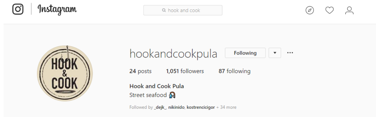
Slika 3. Prikaz Hook & Cook Pula Instagram profila