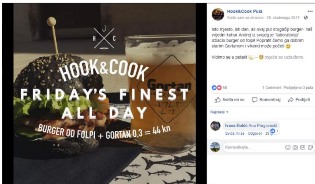
Slika 2. Prikaz jedne od fotografija sa Facebook profila Hook & Cook Pula