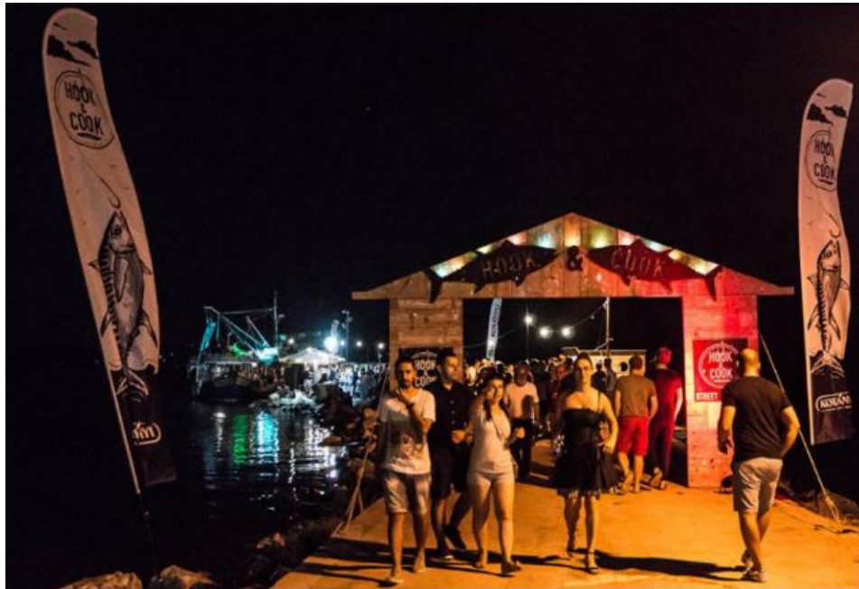
Slika 8. Prikaz ulaza na Hook & Cook festival

poslužuje hrana. Na samome početku ribarskog mula nalazi se kreativno smišljen ulaz sa logom Hook & Cook-a i menijem koji se nudi taj dan.