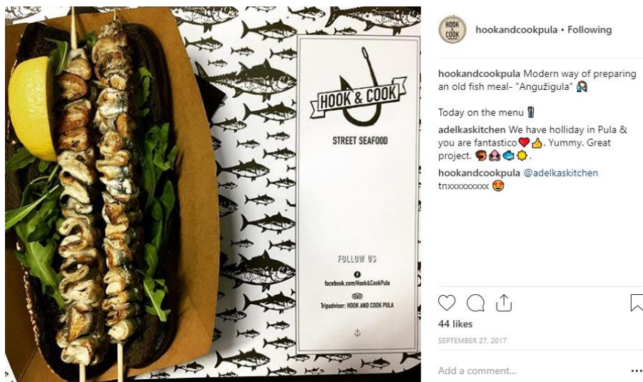
Slika 4. Prikaz jedne od fotografija sa Instagram profila Hook & Cook Pula