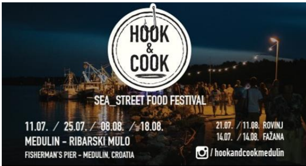
Slika 7. Prikaz letka za Hook & Cook festivale

Letak Hook & Cook festivala sličan je kao i plakat. U pozadini se nalazi slika ribarskog mula na kojemu se održava festival, a preko slike je tekst sa objašnjenjem.