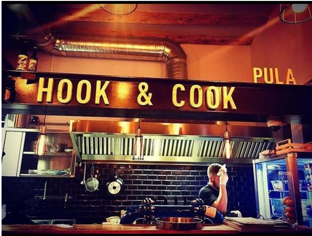
Slika 10. Prikaz unutrašnjosti Hook & Cook lokala