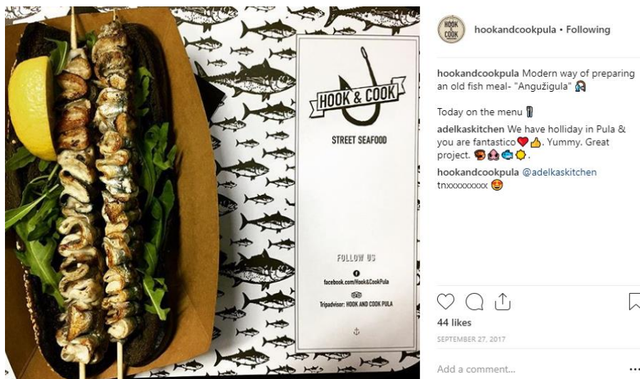
Slika 4. Prikaz jedne od fotografija sa Instagram profila Hook & Cook Pula