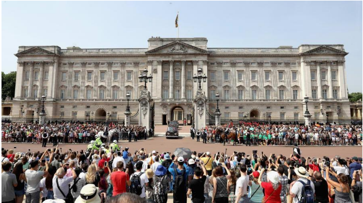
Slika 5. Turisti ispred Buckinhamске palače

Može se reći da kako se mijenja svijet (globalizacija i masovni mediji), tako se mijenjaju i turisti kao putnici (Burns, 1999.).