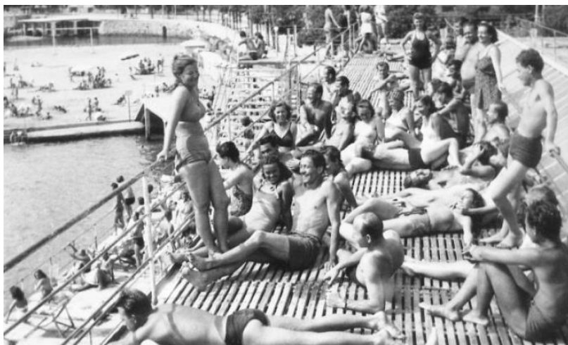
Slika 2 – Radničko odmaralište u Opatiji 1948. godine

Građani su putovali i neovisno o tome je li njihovo putovanje bilo subvencionirano od strane sindikata, no šezdesetih su sindikati znali davati financijsku potporu za komercijalni smještaj. Kako su se smanjivale olakšice za godišnji odmor tako je rastao značaj odmarališta koja su bila u vlasništvu sindikata, tvornica, poduzeća, raznih društava i udruga, republičkih i općinskih vlasti te još uvijek ostajala zaštićena unutar koncepta socijalnog turizma. Kada pogledamo strukturu smještaja, tijekom šezdesetih se u radničkim i omladinskim odmaralištima ostvarivala polovica noćenja od strane domaćih jugoslavenskih gostiju što ih je onda činilo vodećim oblikom smještaja. Poslije njega su se našle sobe u privatnom smještaju, a tek onda hoteli, dok se vikendice u statistici pojavljuju tek kasnije oko 1965. godine. Broj ležaja počeo je naglo rasti, tako je u Hrvatskoj za vrijeme 1951. bilo tek 6.122 ležaja dok je desetak godina kasnije bilo 41.144 u radničkim i još 23.852 u omladinskim i dječjim odmaralištima, a još 1971. broj ležaja u odmaralištima došao je čak do 78.832. 47 Šezdesetih se u Hrvatskoj moglo vidjeti 500-700 radničkih i oko 100 omladinskih i dječjih odmarališta.