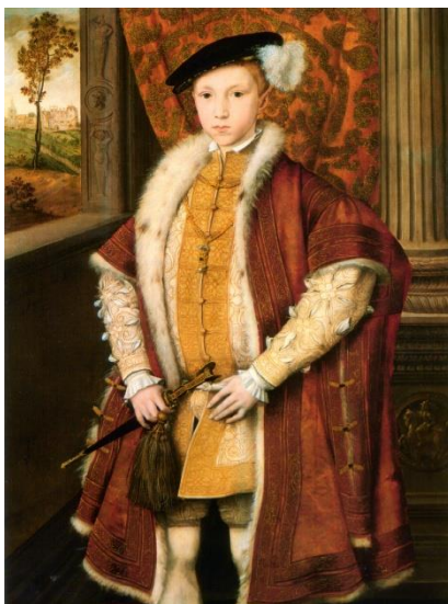
Slika 4. Eduard VI. Tudor (1537.-1553.) kralj Engleske i drugi kralj Irske

Eduard VI. Tudor (1537.-1553.) bio je kralj Engleske i drugi kralj Irske ( slika 4. ) naslijedivši svojeg oca Henrika VIII. Tudora. Eduard je rođen kao dugo očekivani sin kralja Henrika VIII. i treće kraljice, Jane Seymour, koja je umrla dvanaest dana po njegovu rođenju. Nekoliko dana nakon rođenja dobio je titulu princa od Walesa, koja ga je automatski označila kao Henrikovog nasljednika. Bio je prvi protestant na engleskom tronu te je tek za vrijeme njegove vladavine protestantizam postao službena i glavna religija svih Engleza, iako je već njegov otac razdvojio englesko katoličanstvo od rimokatoličanstva.