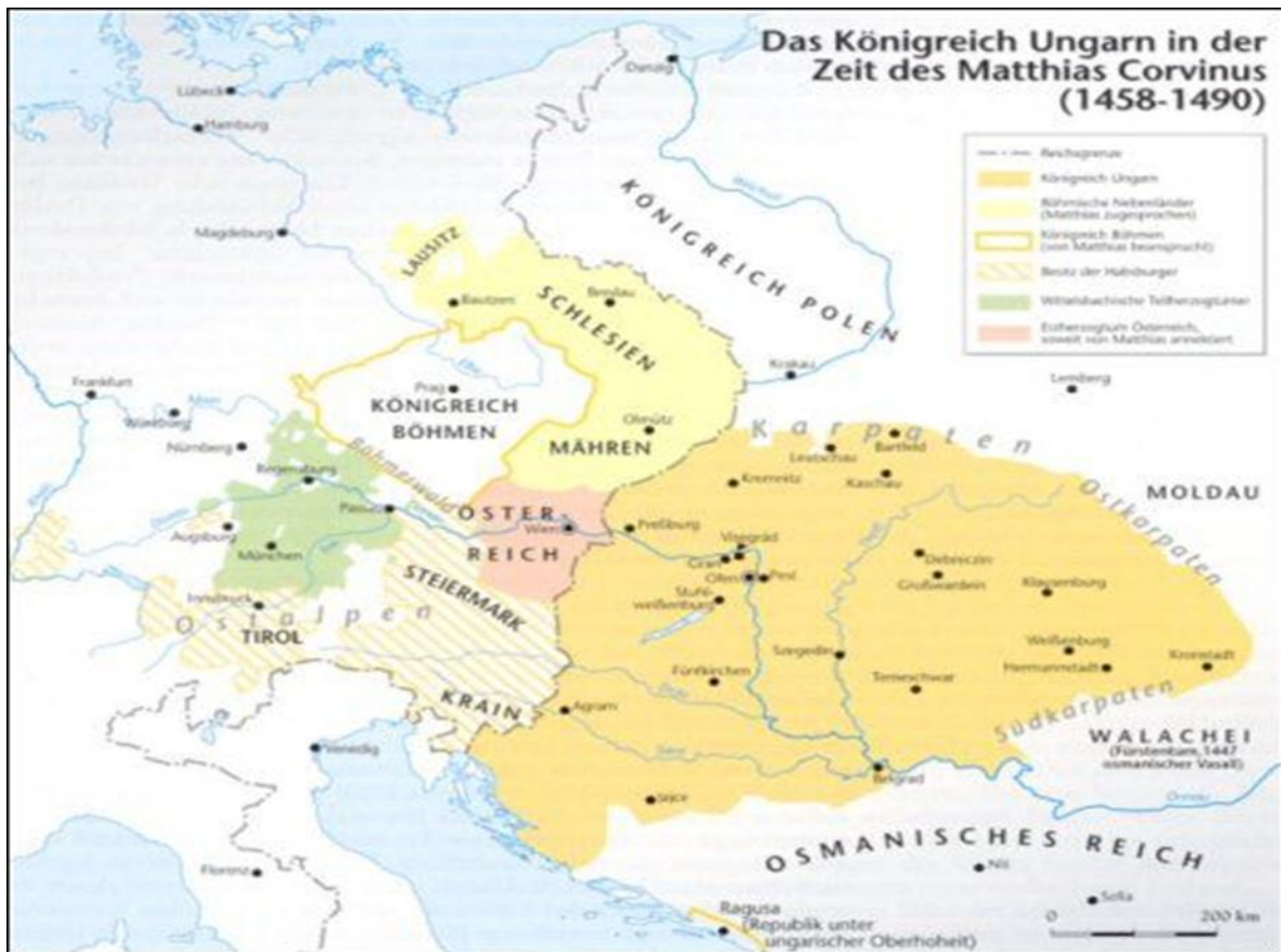
Slika 1. Ugarsko Kraljevstvo u vrijeme Matijaša Korvina (1458. – 1490.)

prihodi krune u prvim godinama vladavine udvostručili, a na kraju vladavine prihodi su iznosili od oko 800 do 900.000 zlatnih florina 62 .