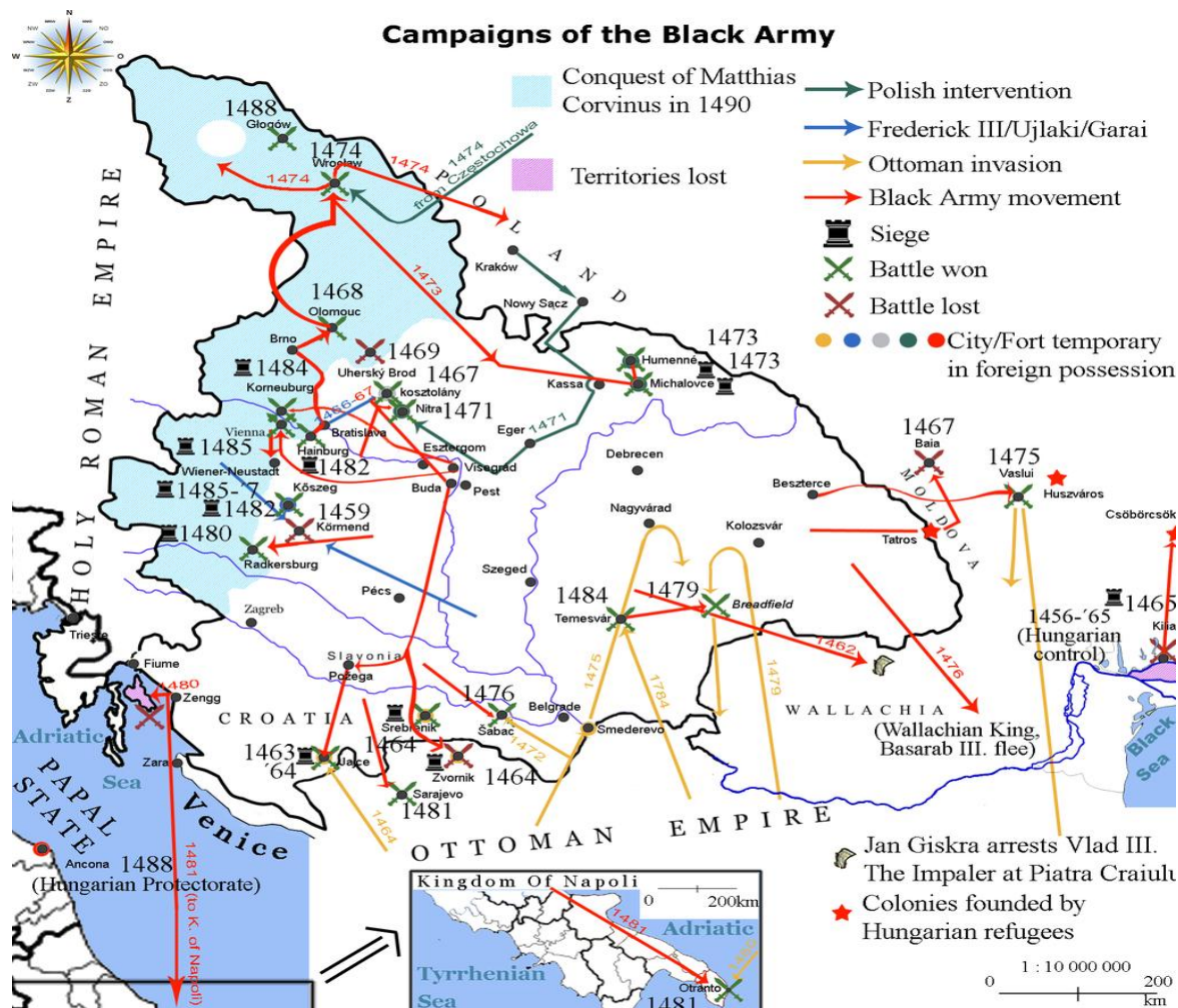
Slika 3. Ratovi Matijaša Korvina (1458. – 1490.) s prikazom pohoda protiv Austrije

Kralj Matijaš Korvin, kao što je u prijašnjem poglavlju opisano odmah nakon izbora za kralja došao je u sukob sa sveterimskim njemačkim carem Fridikom III. Nakon pomirbe, sklapanja ugovora i vraćanja krune, Matijaš i Fridrik III. često su se otvoreno ili prikriveno sukobljavali. Njihovi međusobni odnosi dodatno se pogoršavaju 1477., kada ponovno kreću u međusobni rat koji traje sve do 1485. godine. Nakon osvajanja Beča, Matijaš svojom vojskom osvaja Štajersku i Donju Austriju, a svoje sjedište seli u Beč. 79