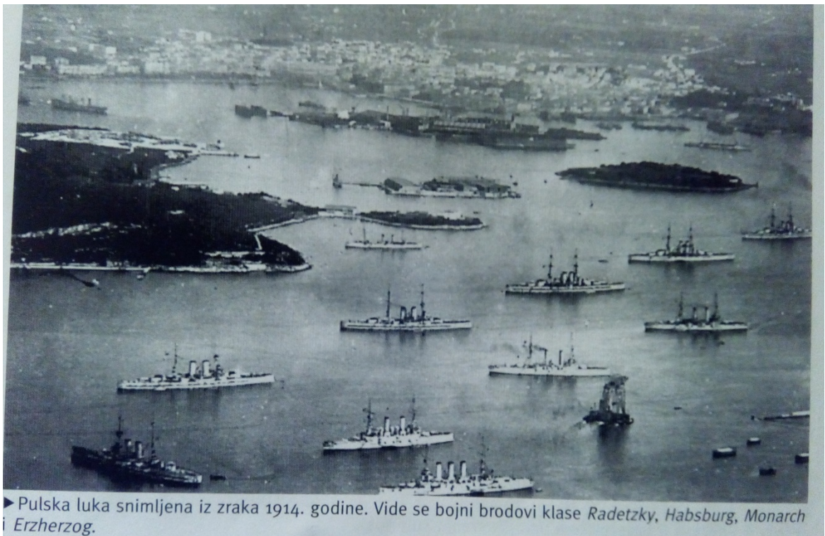
► Pulska luka snimljena iz zraka 1914. godine. Vide se bojni brodovi klase Radetzky , Habsburg , Monarch i Erzherzog .

Austrougarska mornarica bila je jedna od novijih na svjetskoj pozornici. Ozbiljnije se počela razvijati tek početkom 20. stoljeća. U takvoj mornarici vjerojatno su Brsečani bili jedni od iskusnijih ljudi u pogledu poznavanja mora. Najvažnije položaje držali su Austrijanci i Mađari tako da iskustvo Brsečana iz suživota s morem nije moglo doći do izražaja ili iskoristiti sve potencijale što možda pruža takav suživot.