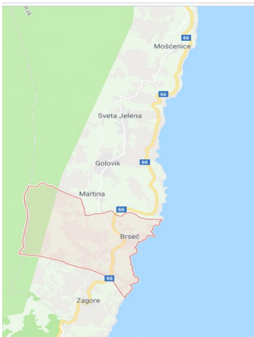
Prilog 1. Brseč i okolna sela, najdeblja bijela krivudava crta koja se nastavlja na žutu liniju označava glavnu cestu za vrijeme austrijske vlasti 18