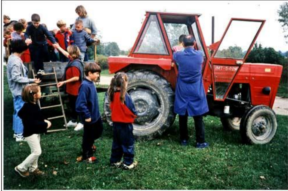
Slika 7. Izlet