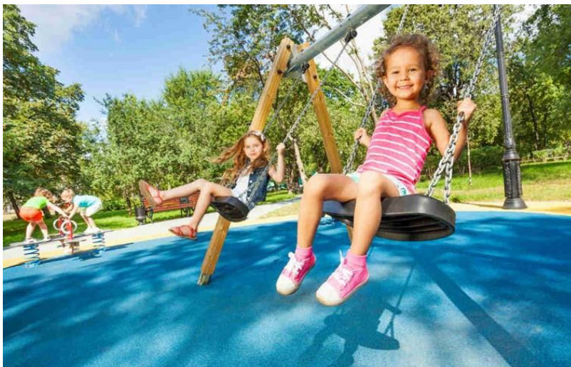
Slika 3. Tematsko vježbanje djece predškolske dobi

( https://www.index.hr/mame/clanak/strucnjaci-zakljucili-ljuljacke-su-savrsono-sredstvo-koje-ce-vase-dijete-nauciti-svasta/970088.aspx )