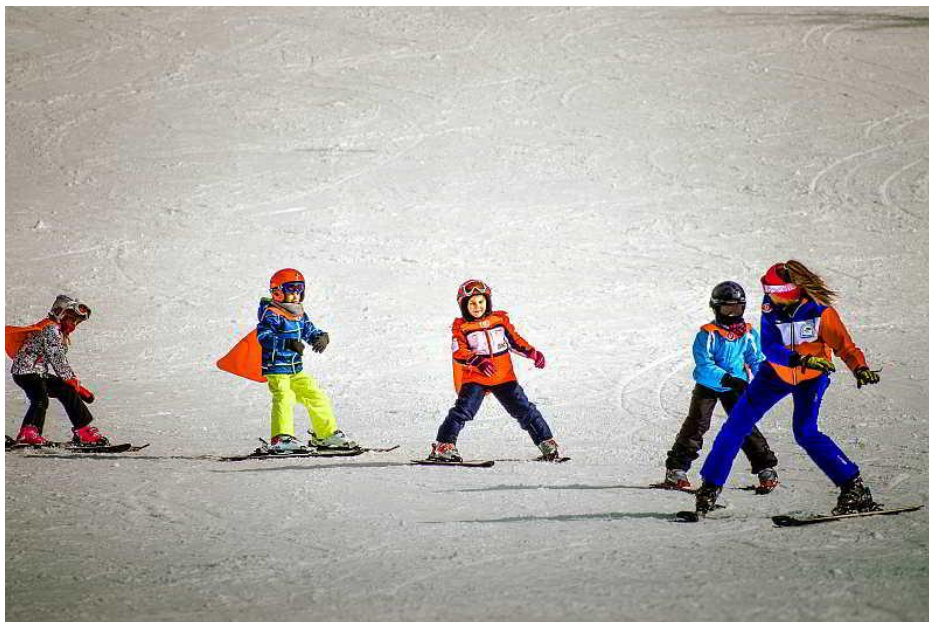
Slika 5. Sat sportskog tjelesnog vježbanja