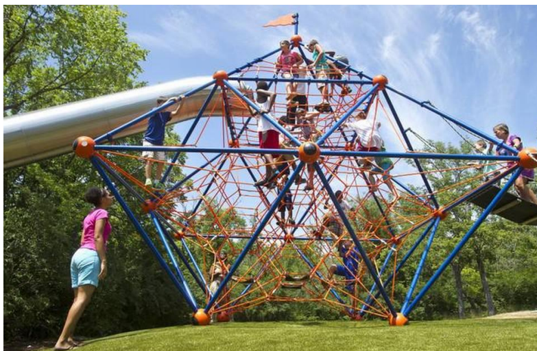
Slika 2. Spontano vježbanje djece predškolske dobi

Spontano bi se vježbanje trebalo provoditi svakodnevno, ali to nije zamjena za sat tjelesne i zdravstvene kulture. Uloga voditelja je da prati tijek aktivnosti s ciljem čuvanja. U aktivnost se ne uključuje i ne usmjerava ju, no ako neko dijete počinje izvoditi zadatak koji je motorički prezahtjevan tada će voditelj prekinuti vježbanje i dijete usmjeriti na neku drugu primjereniju tjelovježbenu aktivnost.