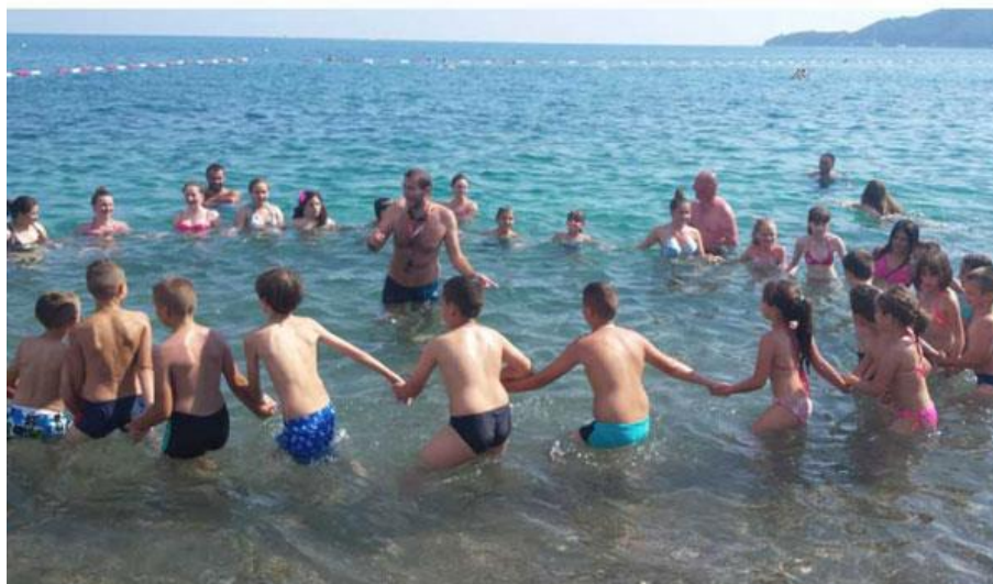
Slika 9. Ljetovanje