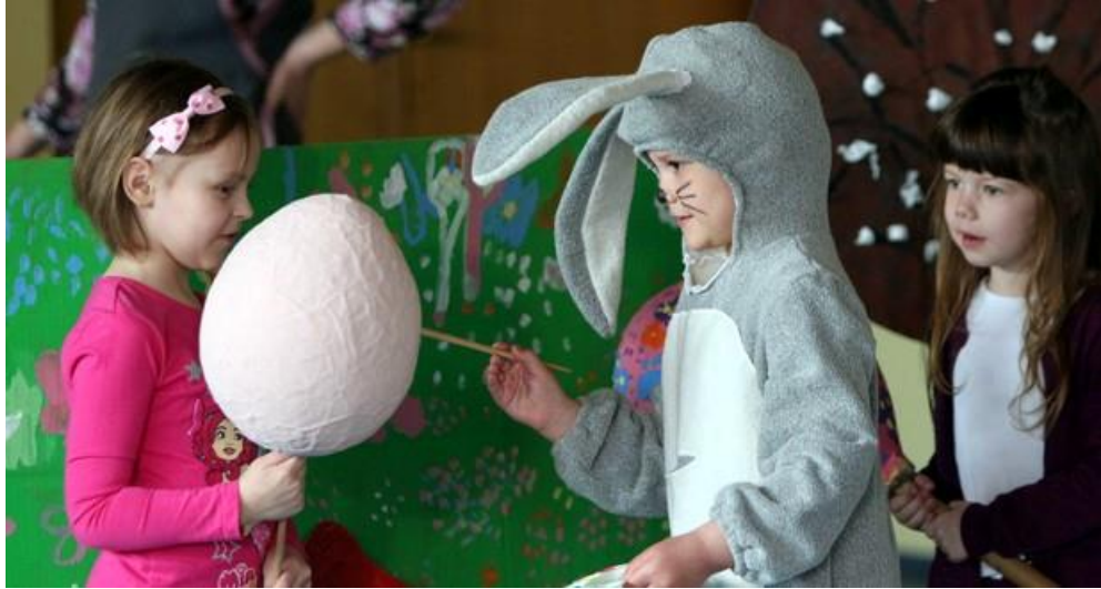
Slika 6. Priredba