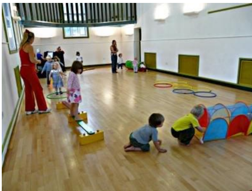
Slika 4. Glavni dio sata ( http://www.kidzfun.biz/ )

Prije nego što se počne s realizacijom zadatka, djecu se može uključiti u pripremu prostora za vježbanje, a zatim se djeca postavljaju u formacije. Slijedi objašnjenje i demonstracija zadatka od strane odgojitelja i na kraju djeca kreću u izvođenje sadržaja. Sadržaj je već unaprijed isplaniran godišnjim operativnim planom. Bez obzira koji oblik rada odgojitelj koristi, mora imati pregled nad svom djecom kako bi ih mogao kontrolirati i ispravljati pogreške. Prijelaz s jednog zadatka na drugi treba biti brz, nabolje je da to bude u smjeru kazaljke na satu. Na kraju glavnog „A“ dijela sata potrebno je pospremiti sprave i rekvizite, zatim slijedi najava glavnog „B“ dijela sata, objašnjenje i demonstracija. Ako se u „B“ dijelu sata koriste štafetne igre, potrebno je biti oprezan. Elementi štafetne igre moraju biti savladani jer je kod štafetne igre bitna brzina izvedbe zadataka.