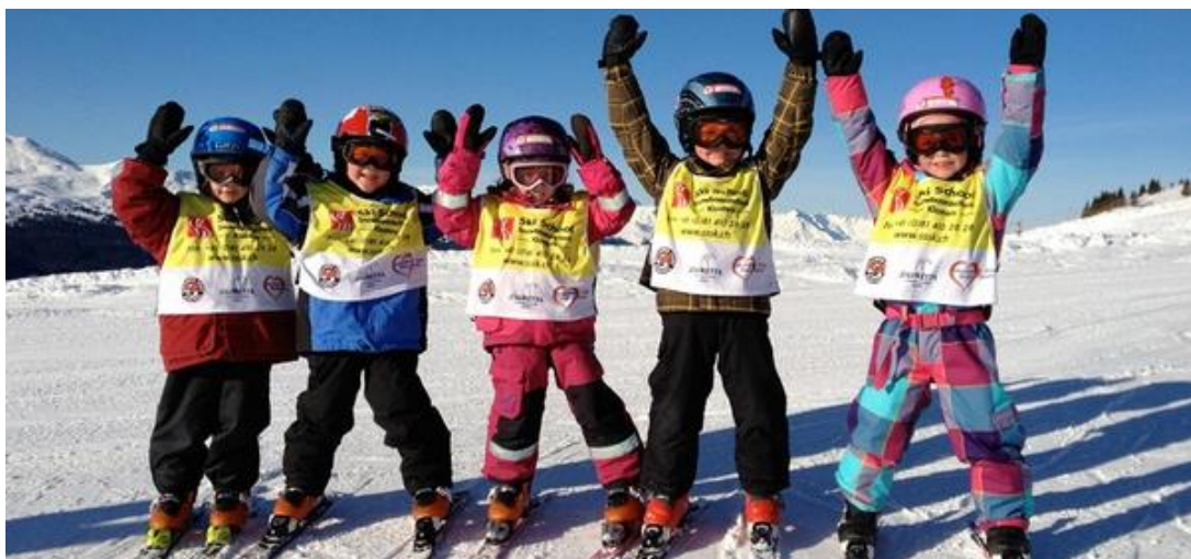
Slika 8. Zimovanje

uz glazbu, dječji plesovi, različite igre i zadaci, kvizovi znanja, likovno izražavanje, maskenbal, prikazivanje prigodnih dvd-a.