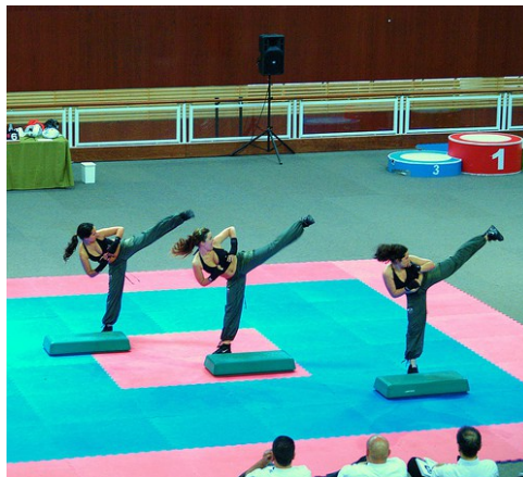
Slika : Aero kickboxing

ispred sudaca u početni položaj, a voditelj ekipe ili sam natjecatelj rukom daje znak da se uključi glazba. Izvođenje vježbe počinje na prvom udarcu periode poznat kao „maesterbeat“ (prvi udarac u fazi u periodu od 32 udaraca) i ne prekida se do kraja vježbe, odnosno do kraja glazbe. U slučaju greške, dozvoljeno je jednom ponoviti izvedbu od početka, ali se zbog toga umanjuje ocjena. Ručne i nožne tehnike tijekom vježbe moraju biti izvedena na točan, dinamičan i eksplozivan način, kao da se natjecatelj suprotstavlja pravom protivniku, svaki udarac mora biti izveden s intenzitetom, pravilno ciljan i fokusiran, s pravilnim položajem ruku i nogu. Mora biti napravljeno najmanje šest kickboxing tehnika tj. udaraca nogom ili rukom tijekom perioda (32 uglazbljena udaraca), a najmanje šest udaraca nogom ukupno tijekom cijelog prikaza. Akrobatski elementi nisu dozvoljeni. Svaki natjecatelj mora dobro poznavati sinkronizaciju pokreta s ritmom glazbe jer svaki pokret bez ritma smatra se pogreškom.