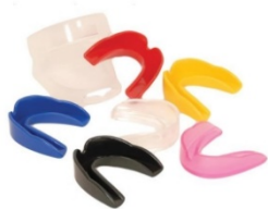
Slika : Štitnik za zube

Mora biti izrađen od prilagodljivog mekog plastičnog materijala. Štitnik mora omogućiti natjecatelju pravilno disanje i mora biti prilagođen konfiguraciji zubi natjecatelja. Dijele se na jednostruke (zaštita samo gornjih zuba) i dvostruke (zaštita gornjih i donjih zuba). Mora biti anatomski oblikovan kako bi se najbolje prilagodio zubalu.