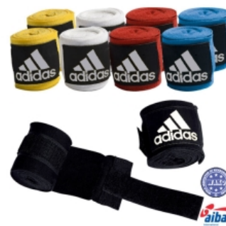
Slika : Bandaže

Korištenje bandaža moguće je u disciplini point fight , a moraju se koristiti prilikom korištenja zatvorenih rukavica. Izrađene su od gusto tkanog pamuka, najveće dužine 250 cm i najveće širine 5 cm. Kod nekih bandaža tkanina se ne rasteže dok se kod drugih može rastegnuti. Dolaze u raznim bojama. Ne smiju imati oštar rub. Učvršćuju se pomoću čička na zglobu, te im je osnovna funkcija učvršćivanje šake i zgloba.