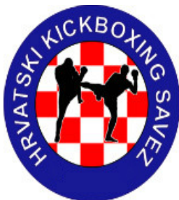
Slika : Logo HKBS

Natjecanja u kickboxingu sadržavaju udaračke i obrambene tehnike te zahtijevaju određenu opremu i odjeću koja je odobrena od strane WAKO-a tj. svjetske kickboxing organizacije i HKBS-a tj. Hrvatskog kickboxing saveza. Službeni dobavljači WAKO-a su Adidas i Top Ten , dok je službeni dobavljač HKBS-a PRIDE . Sva tri brenda preporučena su i dozvoljena od strane HKBS-a, i za treninge i za natjecanja.