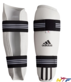
Slika : Štitnik za potkoljenice

Izrađeni su od tvrde plastike presvučene spužvom ili mekim plastičnim materijalom, a mogu biti izrađeni od tkanine s tvrdim umetkom. Ne smiju u sebi sadržavati metalne niti drvene dijelove. Za nogu se učvršćuju s najmanje dvije elastične čičak-trake. Neki štitnici imaju čak tri zaštitne trake.