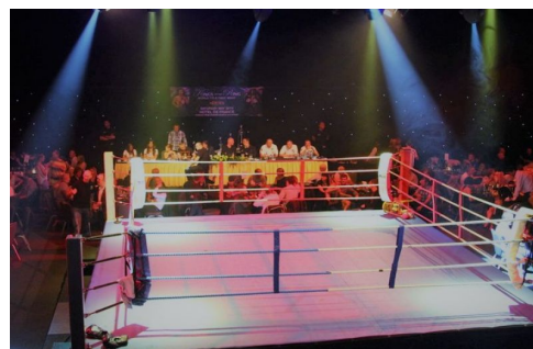
Slika : Ring