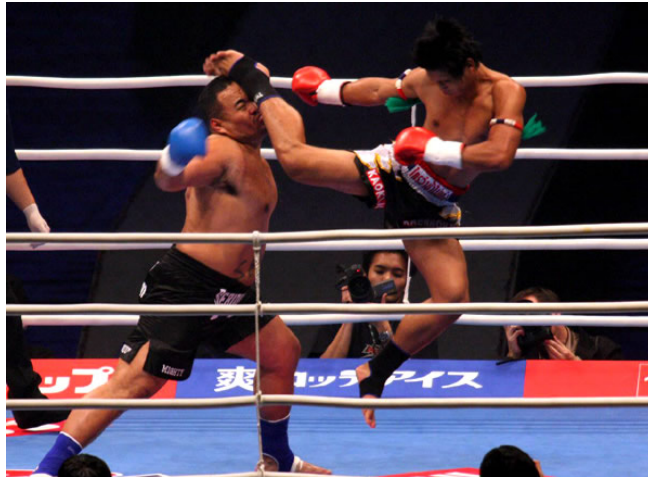
Slika : K-1

Nakon knockdowna , glavni sudac u ringu broji do 10. Ukoliko borac nije spreman nastaviti, glavni sudac prekida borbu.