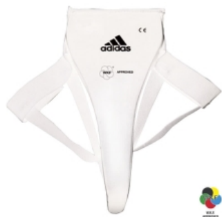
Slika : Suspenzor za žene

Obavezan je za korištenje svim natjecateljima i natjecateljicama. Muški suspenzor izrađen je od tvrdog plastičnog materijala i sprečava udarce u genitalije. Može biti izveden kao kapica s posebnim trakama za učvršćivanje ili kao cijela zaštita donjeg dijela abdomena. Ženski suspenzor izrađen je od meke spužve koja štiti od udaraca donji dio abdomena. Oba suspenzora moraju se nositi ispod hlača.