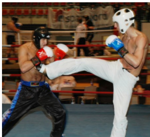
Slika : Full contact

Natjecatelji u full contactu nose zaštitnu kacigu, štitnik za zube, zatvorene boksačke rukavice, bandaže, štitnike za grudi (za natjecateljice), štitnike za genitalije. Štitnici za potkoljenice, štitnici za stopala. Žene nose duge hlače i topove, dok muškarci nose duge hlače i imaju goli gornji dio tijela.