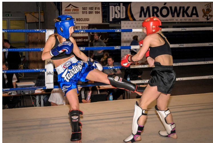
Slika : Low kick

Natjecateljice na sebi imaju kratke hlačice i topove, a natjecatelji se natječu u kratkim hlačicama torzo im je bez majice kao i kod full contacta .