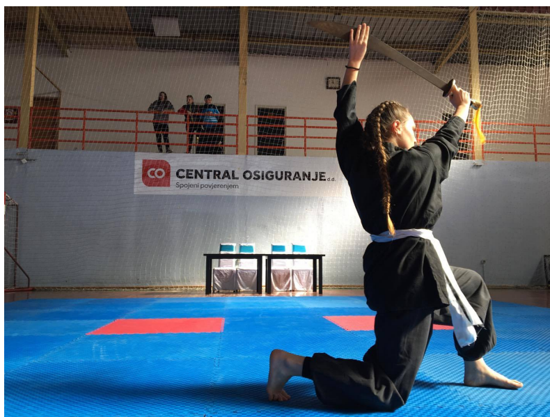
Slika : Glazbene forme