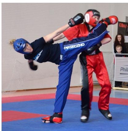
Slika : Light contact