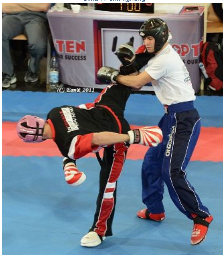
Slika : Point fighting

Natjecatelji su obavezni nositi svu opremu koja je propisana – inače im sudac ne dozvoljava da nastupe. Svi su obavezani nositi zaštitnu kacigu, a kod mlađih skupina na kacigu se postavlja plastični vizir koji štiti lice, gumicu za zube, rukavice s otvorenim dlanom, štitnik za prsa (za natjecateljice), štitnik za genitalije, štitnik za potkoljenice i papuče bez đona. Natjecatelji nose kratke majice s V-izrezom i duge široke hlače. Na većim natjecanjima obavezno je nošenje pojasa.