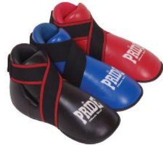
Slika : Zaštitne papuče

Izrađene su od spužve presvučene skajem ili kožom. Pokrivaju gornji dio, bočnu unutaranju i vanjsku stranu stopala do visine iznad zgloba s obavezno zatvorenim petom. Moraju biti dužine, odnosno veličine da u potpunosti pokrivaju nožne prste natjecatelja. Učvršćuju se za stopalo elastičnom trakom na čičak, a prednji kraj učvršćuje se za nožni palac i prste odvojeno malim elastičnim trakama.