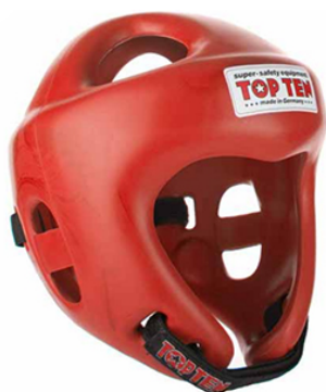
Slika : Zaštitna kaciga

Za kadete se na nacionalnim natjecanjima može, a na međunarodnim natjecanjima