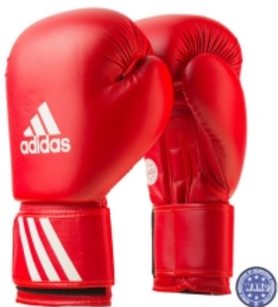
Slika : Rukavice za kontaktne discipline

Rukavice ukupne težine 10 Oz na kojima je jasno vidljiva oznaka težine, izrađene su od spužvastog mekanog materijala, presvučene kožom ili skajem. Moraju omogućiti natjecatelju potpuno stiskanje šake i držanje palca uz šaku. Rukavice u potpunosti zatvaraju šaku natjecatelja s odvojenim dijelovima za prste i palac koji su povezani trakom kako se ne bi tijekom udaranja mogao palac odvojiti. S umetnutim zaštitnim