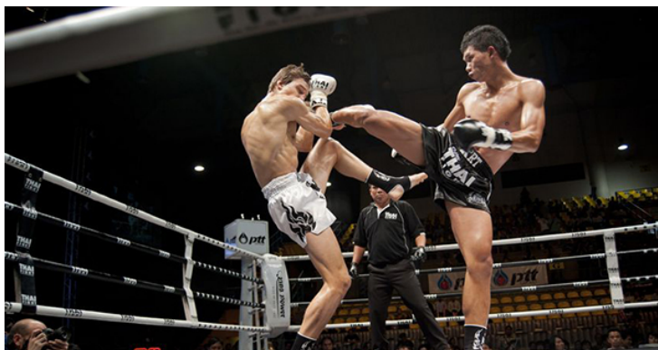
Slika : Thai kickboxing