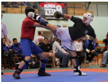
Slika : Kick light