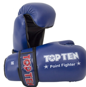
Slika : Rukavice za point fighting

Rukavice koje imaju otvorene dlanove i obavezno zatvoreni dio koji prekriva vrhove prstiju. Napravljene su tako da je moguće otvaranje i zatvaranje šake. Moraju pokrivati cijelu udarnu površinu. Izrađene su od posebno mekanog i kompaktnog sintetičkog materijala koji je presvučen kožom ili skajem. Učvršćuju se čvrstim trakama za zapešće.