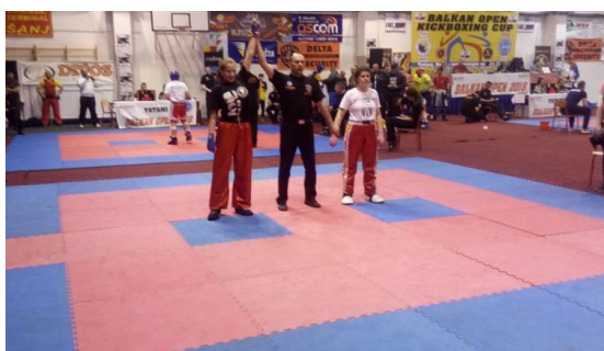
Slika : Tatami

Ring se uglavnom postavlja u središte dvorane između tatamija. Ring je dimenzija od 4,9m x 4,9m do 6,1m x 6,1m. Oko ringa mora najmanje biti 2 m prostora.