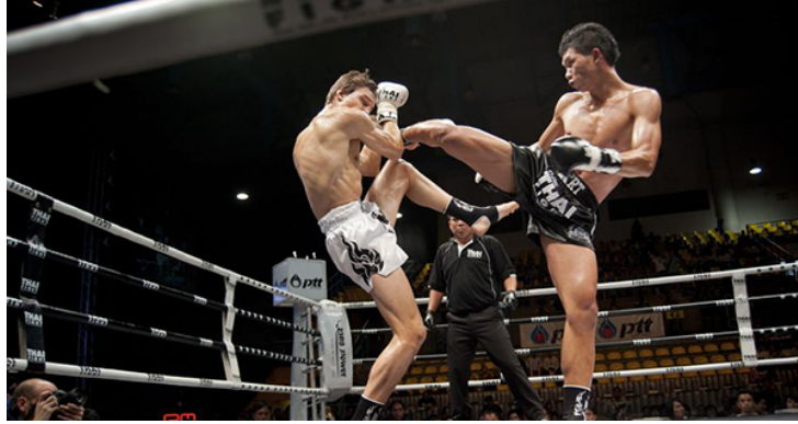
Slika : Thai kickboxing