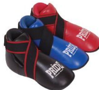
Slika : Zaštitne papuče

Izrađene su od spužve presvučene skajem ili kožom. Pokrivaju gornji dio, bočnu unutaraju i vanjsku stranu stopala do visine iznad zgloba s obavezno zatvorenom petom. Moraju biti dužine, odnosno veličine da u potpunosti pokrivaju nožne prste natjecatelja. Učvršćuju se za stopalo elastičnom trakom na čičak, a prednji kraj učvršćuje se za nožni palac i prste odvojeno malim elastičnim trakama.