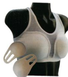
Slika : Štitnik za prsa

Obavezan je za korištenje natjecateljicama u juniorskoj i seniorskoj konkurenciji. Štitnik je izgrađen od tvrdog plastičnog materijala. Stavlja se ispod topa koji je namijenjen za nošenje štitnika.