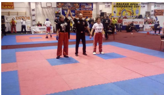
Slika : Tatami

Ring se uglavnom postavlja u središte dvorane između tatamija. Ring je dimenzija od 4,9m x 4,9m do 6,1m x 6,1m. Oko ringa mora najmanje biti 2 m prostora.