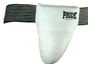
Slika : Suspenzor za muškarce