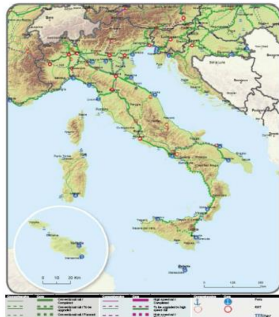
Slika 4. Osnovna i sveobuhvatna: željeznice (teret)

Kartografski prikazi u Strategiji informativne su prirode i služe isključivo za potrebe ovog dokumenta.