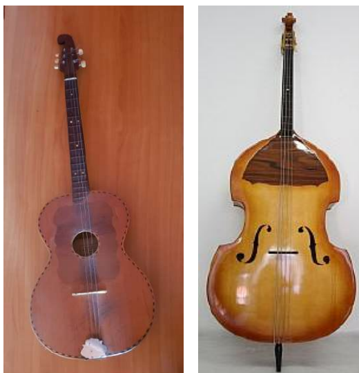
Fotografija 10 i 11: Bugarija i berda