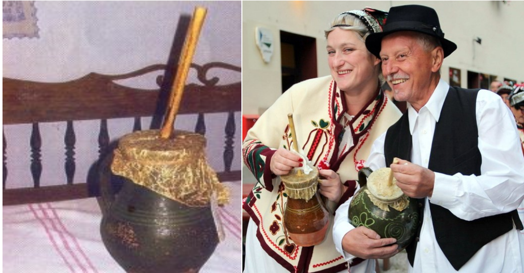
Fotografija 2 i 3: Improvizirano primitivno glazbalo mrgudalj i način sviranja