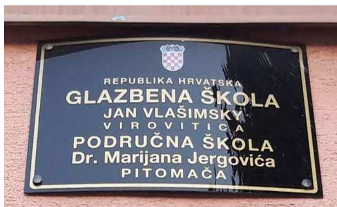
Fotografija 27: Natpisna ploča na Glazbenoj školi dr. Marijana Jergovića u Pitomači