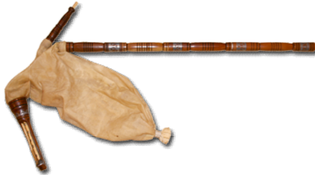
Fotografija 5: Dude