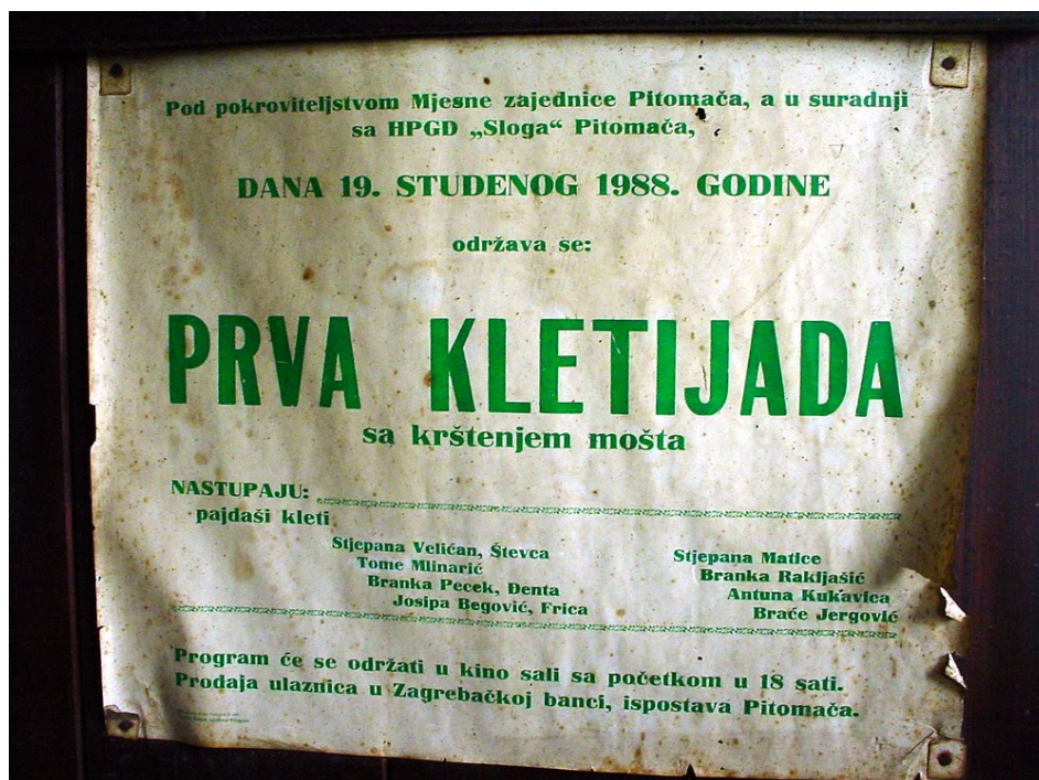
Fotografija 23: Plakat prve Kletijade održane 1988. godine u kino sali društvenoga doma u Pitomači

pučka priredba temeljena na običaju martinjskoga krštenja mošta koje su stari vinogradari od davnina obnašali na dan Svetoga Martina. 49