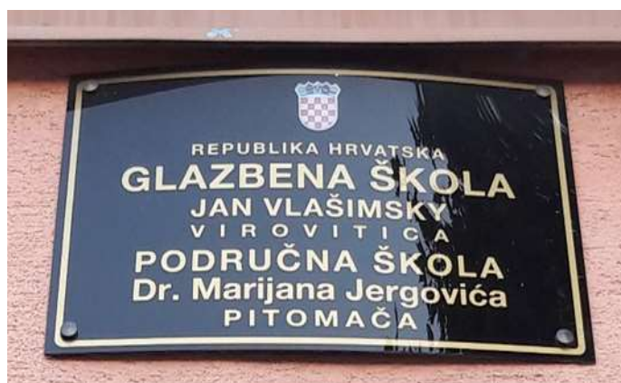
Fotografija 27: Natpisna ploča na Glazbenoj školi dr. Marijana Jergovića u Pitomači