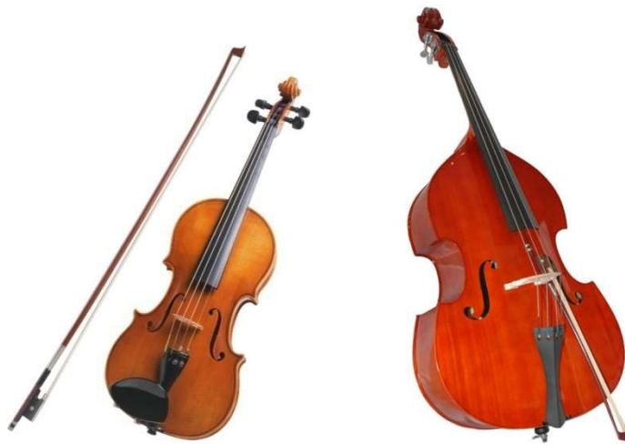
Fotografija 6 i 7: Jegeda (violina) i bajs (bas)