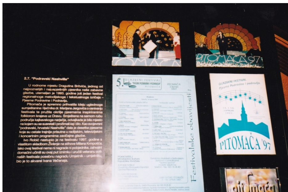
Fotografija 39: Odjeljak izložbe Mister Morgen - Ivo Robić pod nazivom Podravski Nashville