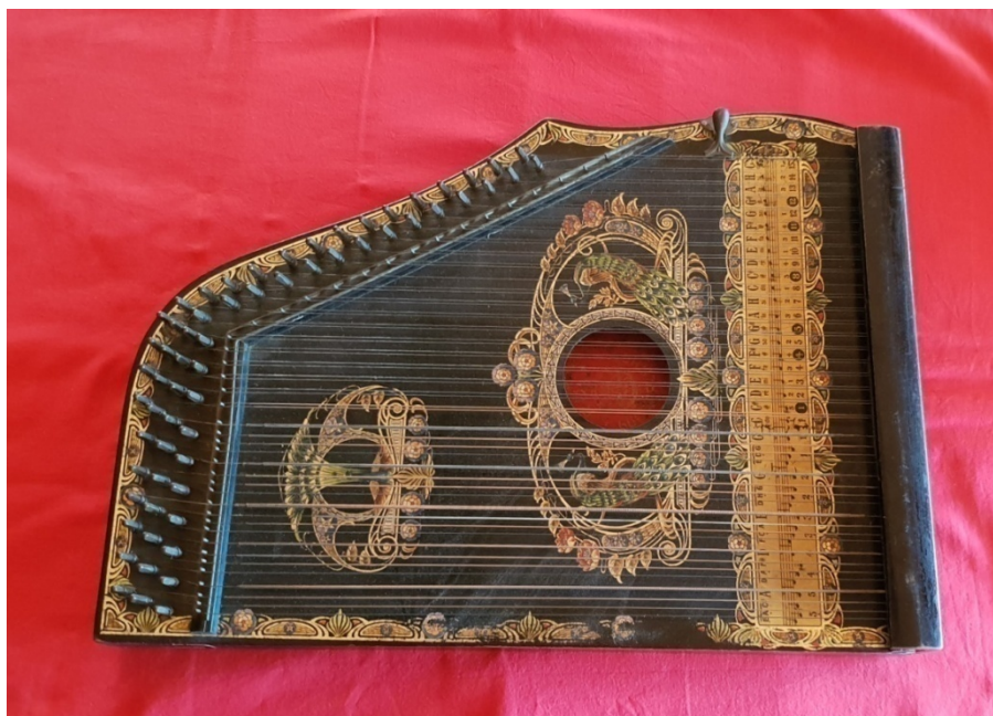
Fotografija 12: Citra