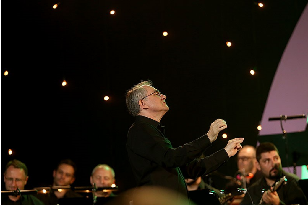
Fotografija 43: Maestro Siniša Leopold s Tamburaškim orkestrom HRT-a na festivalskoj pozornici

jednog od tih razgovora, na prijedlog Drage Britvića nastalo je i ime pitomačkoga glazbenog festivala Pjesme Podravine i podravlja.