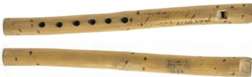
Fotografija 4: Šaltve

Na području Podravine svirale su se šaltve , frulice izrađene od mekoga drveta i dude , puhačkoga instrumentakoji nalikuje gajdama. 34 Početkom 20. stoljeća javljaju se gudački sastavi ( mužikaši ) čiji su sastav činili: jedna do tri jegede (violine) i trostruni bajs ( bas ).