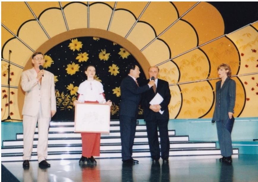
Fotografija 37: Ivo Robić na pozornici pitomačkoga festivala Pjesme Podravine i podravlja 1997. godine (izveo je Jergovićevu skladbu Življenje)

U Festival sam bio uključen od prvog dana. Tijekom njegovih početaka imao sam jednu od najodgovornijih dužnosti, a s obzirom da sam po struci ekonomista bio sam tajnik Festivala. Naime, u to je vrijeme trebalo stvarati sve iz početka. Tada su uvjeti za plaćanje izvođača, pjevača, skladatelja i aranžera bili puno drugačiji nego danas što je između ostaloga zahtijevalo i određena znanja u području financija. Nakon nekog vremena taj posao je aktivno preuzela gđa. Zlata Kovačević, a ja sam preuzeo posao glasnogovornika Festivala i osnovao press službu. Dugi niz godina taj posao obavljao sam komunicirajući s čitavim nizom novinara i medijskih kuća. Također, brinuo sam o izvođačima i ispunjavanju svih njihovih zahtjeva, što uvijek nije bilo jednostavno jer bilo ih je zaista svakakvih. Kao vrhunac svog festivalskog djelovanja istaknuo bih jednog od meni najdražih i najzahvalnijih gostiju Festivala, Ivu Robića. On je veliki džentelmen. Po odlasku s Festivala je rekao: „Tak me nisu dočekali nigdje, tak me nigdje nisu tretirali kak me vi tretirate. Zato vam velika hvala.