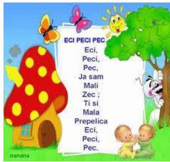
Slika 4. Brojalica