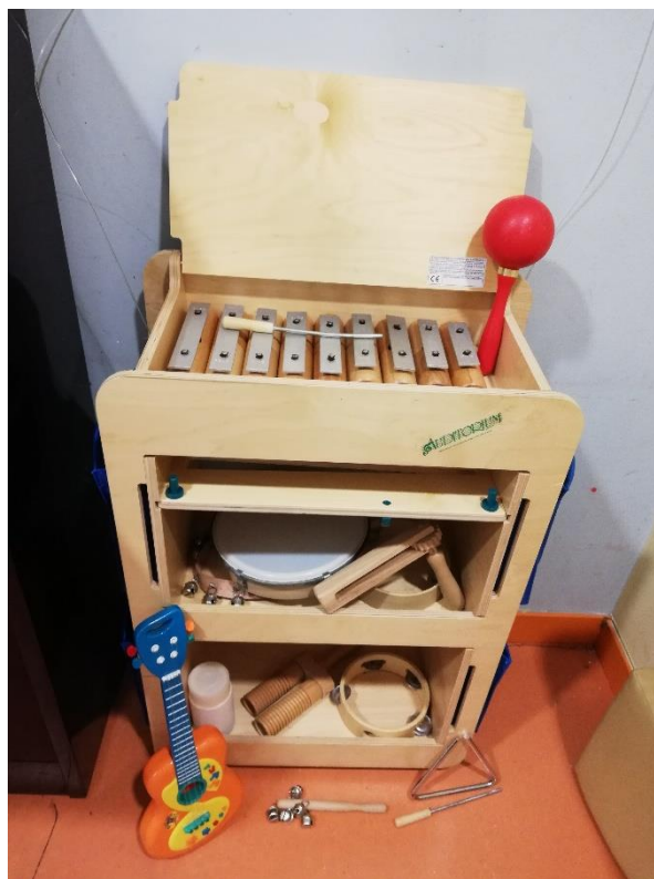
Slika 8. Glazbeni instrumenti (tamburin, triangel, gitara, šuškalice, ksilofon)

Iako je sviranje na udaraljka jednostavno i pripada osnovnoj vrsti glazbenih aktivnosti, važno je da se u igri djeci ne dodijeli jednaka vrsta udaraljki po uzoru na raznovrsnost instrumenata u orkestru. Na taj će se način djeci kroz igru i aktivnosti sviranja na udaraljka potaknuti razvoj glazbenih sposobnosti, ali i shvaćanje glazbene kulture.