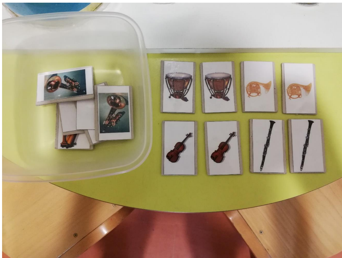
Slika 3. Kartice s instrumentima (igra memory)