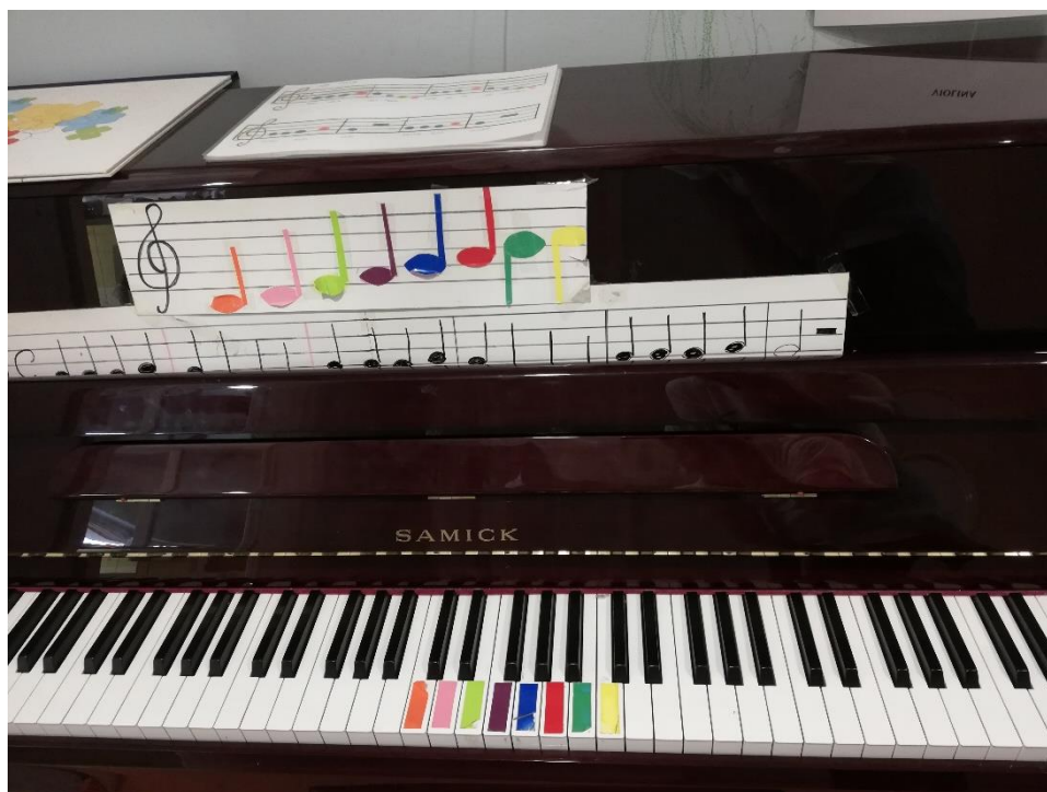
Slika 2. Piano u DV Viškovo