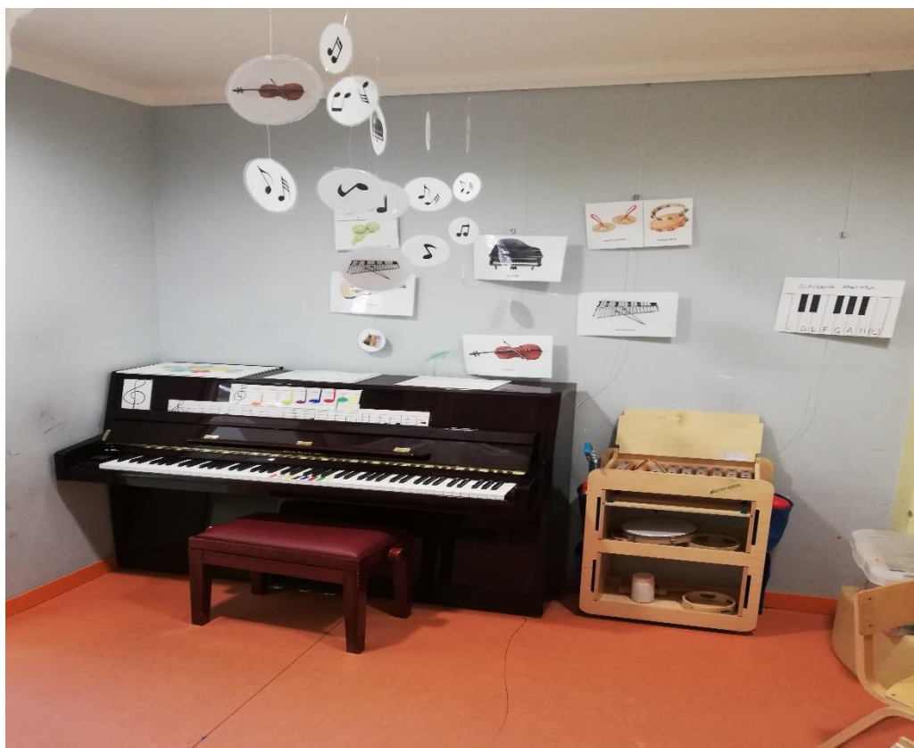
Slika 9. Glazbeni kutak DV Viškovo