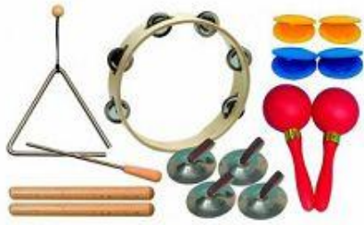
Slika 7. Orffov instrumentarij