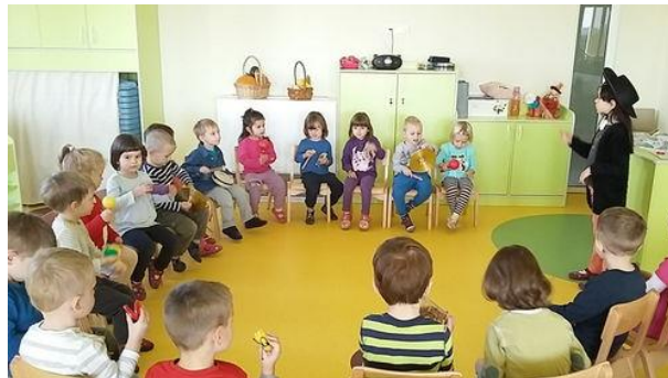
Slika 1. Glazbena igra „Mali orkestar“