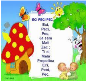
Slika 4. Brojalica