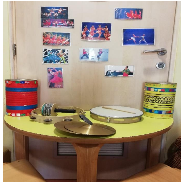
Slika 6. Glazbeni instrumenti (činele, strugalica, bubnjevi, tamburin...)

glazbi. Tek povremeno odgojitelj spominje da što brže odmaknu štapić od štapića ili palicu od pločice ksilofona i slično.