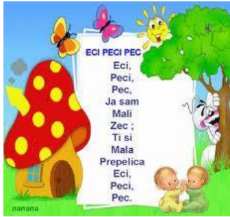
Slika 4. Brojalica