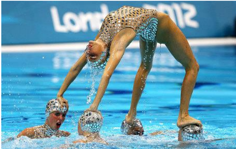
Slika 7. Izvedba u slobodnom stilu – tim Španjolske tijekom Olimpijskih igara 2012. godine

Na prikazu šest olimpijskih figura možemo vidjeti jedan od primjera kako je FINA 2017. godine standardizirala sport (preimenovavši ga u „umjetničko plivanje“) kako bi široj publici olakšala razumijevanje valorizacijskog (sudskog) procesa.