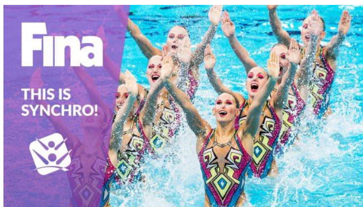
Slika 1. Logo Međunarodne federacije za plivanje FINA-e (franc. „Fédération Internationale de Natation“)

Jedna od povijesnih zanimljivosti u razvoju umjetničkog plivanja je izražen feministički element jer umjetničko plivanje primarno jest „ženski sport“, odnosno njime se od samih njegovih početaka najviše bave žene. Ovakav dojam umjetničko plivanje kao sport prati i danas, o čemu svjedoče masovni mediji.