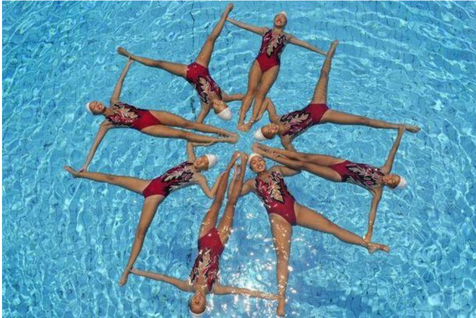
Slika 5. Jedna od figura pri sinkroniziranom plivanju u timu (na Olimpijskim igrama 2012. godine u Londonu)

Tehnike i njihovi elementi pri umjetničkom plivanju su također sastavljeni od figura, odnosno njihovog pravilnog izvođenja. Postoje brojne plivačke tehnike i sve se mogu koristiti i koriste se pri konstrukciji koreografija za sinkronizirano, odnosno umjetničko plivanje.