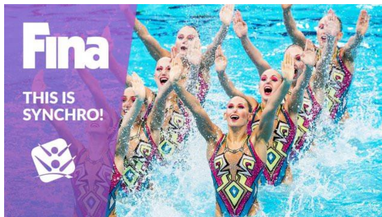
Slika 1. Logo Međunarodne federacije za plivanje FINA-e (franc. „Fédération Internationale de Natation“)

Jedna od povijesnih zanimljivosti u razvoju umjetničkog plivanja je izražen feministički element jer umjetničko plivanje primarno jest „ženski sport“, odnosno njime se od samih njegovih početaka najviše bave žene. Ovakav dojam umjetničko plivanje kao sport prati i danas, o čemu svjedoče masovni mediji.