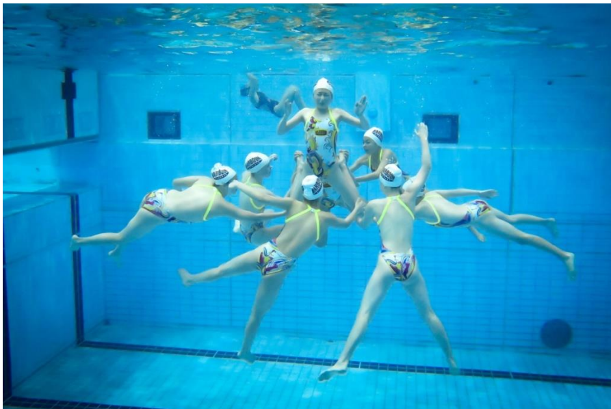
Slika 8. Pogled ispod površine vode