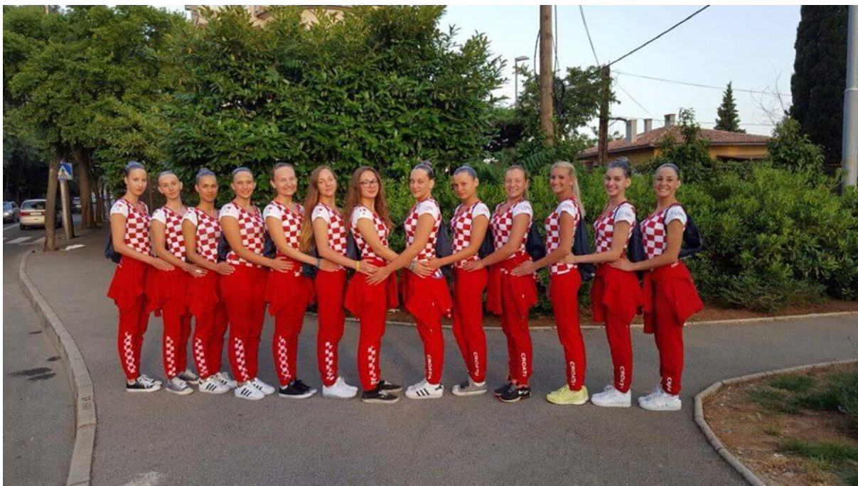
Slika 9. Reprezentacija umjetničkog plivanja u Hrvatskoj

Autorica ovog rada vjeruje kako će uz veće marketinške napore ovaj sport biti popularniji. Trud i rad sadašnjih članica Hrvatskog saveza za sinkronizirano plivanje neosporan je, međutim uvijek ima prostora za rast i napredak.