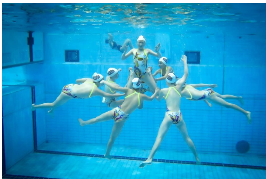
Slika 8. Pogled ispod površine vode