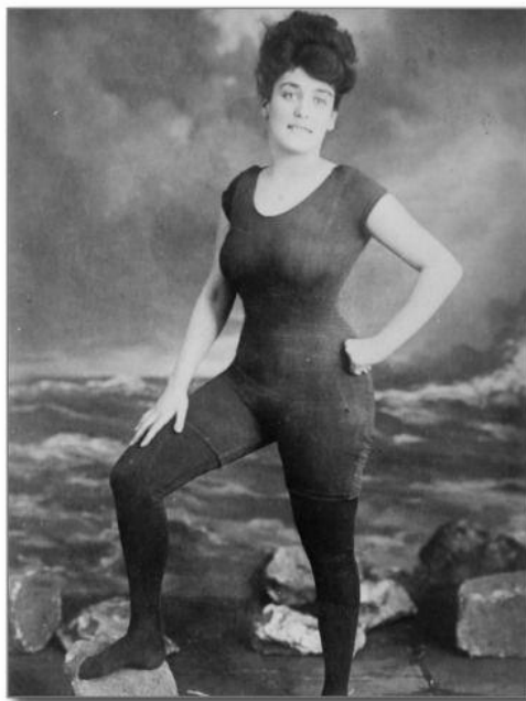
Slika 2. Fotografija Annette Kellerman u jednodijelnom kupaćem kostimu 1905. godine

Istina je da je za popularizaciju umjetničkog plivanja kao međunarodnog sporta, ali prije svega kao atraktivnog sporta i jednog od najpopularnijih, zapravo odgovorna žena. Australaska plivačica Annette Kellerman bila je poznata po svojem plivačkom umijeću, ali i po činjenici da je plivanje propagirala kao prije svega zdravstvenu metodu za održanje snage, mladosti i ljepote. Kellerman je također i prva žena koja se 1905. godine pojavila u javnosti u jednodijelnom kupaćem kostimu. Isti je odjevni predmet zbog Kellerman kasnije doživio velik uspjeh i, također na eminentno kapitalistički način, sudjelovao u pokretu emancipacije „slabijega spola“.