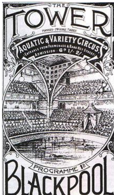
Slika 3. „Vodeni cirkus“ Blackwool Tower – oglasni poster iz 1894. godine (Izvor: https://www.smithsonianmag.com/history/synchronized-swimming-has-history-dates-back-ancient-rome-180960108/?no-ist (21.06.2018.))