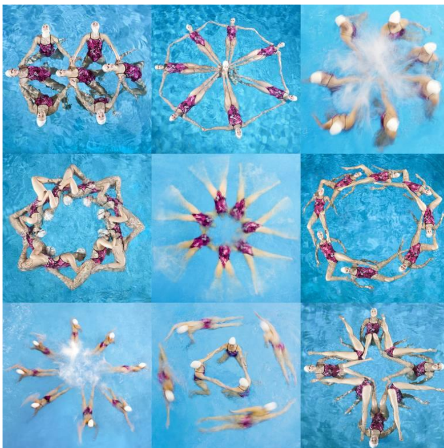
Slika 4. Kaleidoskopski efekt kod sinkroniziranog plivanja

Zbog velike popularnosti sporta 2017. godine uvedene su strukturne promjene u umjetničkog plivanja. „Uvođenje novog događaja u programu FINA-inih svjetskih natjecanja jest „istaknuta“ (eng. „highlight“) rutina (s 10 plivača). Elementi potrebni za izvedbu ove rutine od strane svih plivača uključuju minimalno četiri akrobatska pokreta (skokovi, bacanja, podizanja i slaganja, tj. platforme), povezanu ili interferencijsku aktivnost i jednu lebdeću figuru za kaleidoskopski efekt“ (Anderson, 2017: 72).