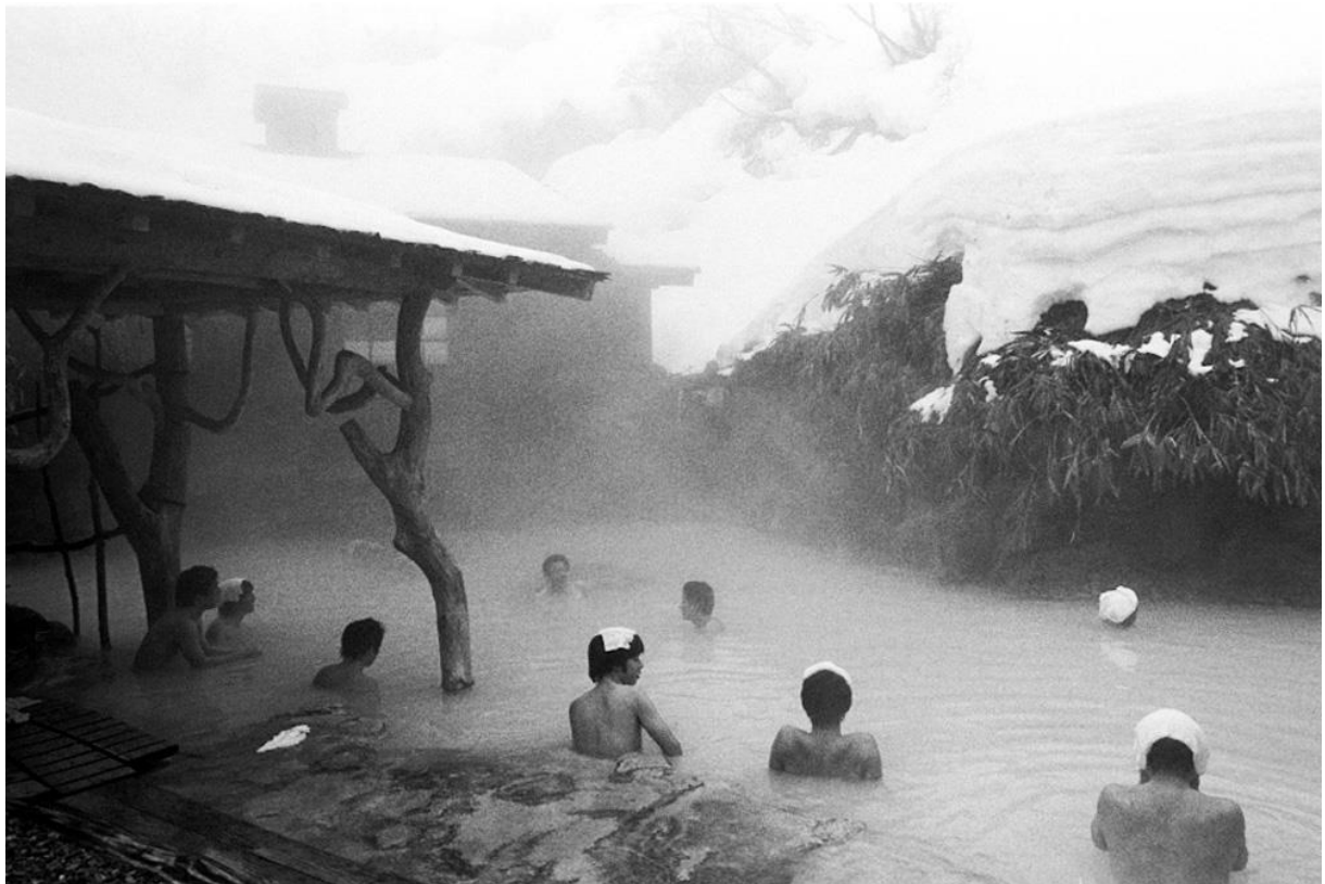
Slika 1. Onsen – izvori termalne vode u Japanu