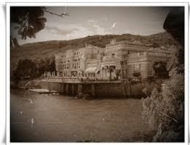
Slika 2. Hotel Kvarner - Opatija