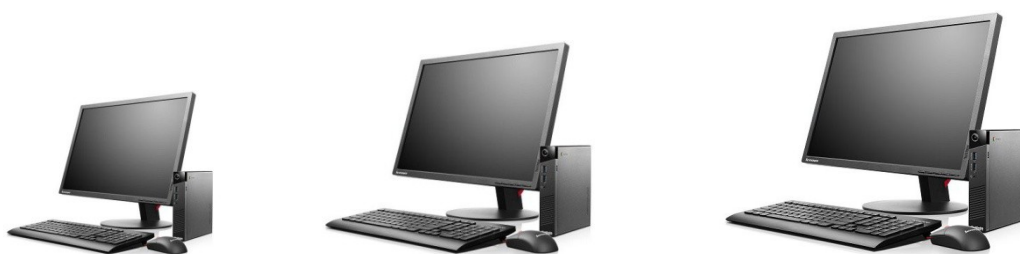
Slika 5: Predložak za provjeru stupnja korištenja medija – računalo

URL: https://www.racunalo.com/lenovo-thinkcentre-chromebox-tiny-mini-stolno-racunalo-cijena-vec-od-200/