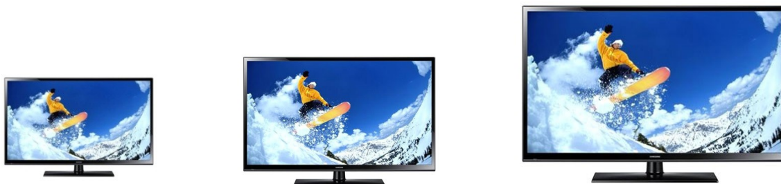
Slika 6: Predložak za provjeru stupnja korištenja medija – televizija

URL: http://www.skynetmreza.net/10000-news/latest-news