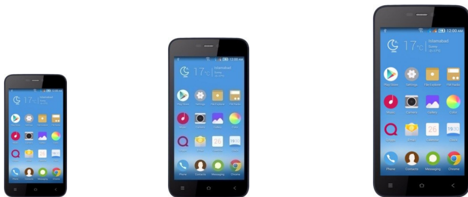
Slika 3: Predložak za provjeru stupnja korištenja medija – mobitel

URL: https://apn-srilanka.gishan.net/en/apn/mobitel/qmobile-noir-x350