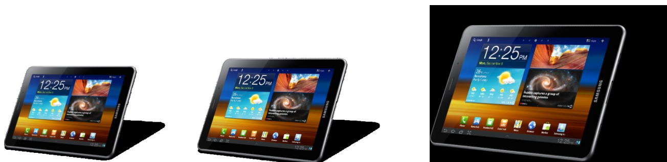
Slika 4: Predložak za provjeru stupnja korištenja medija – tablet

URL: https://hanslodge.com/clip-art/tablet-png-15.htm