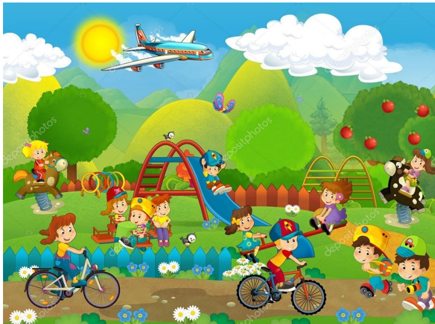
Slika 2: Predložak za provjeru razvoja jezika i govora

Prilikom istraživanja koristile su se fotografije mobitela, tableta, računala, televizije i slika dječjeg parka pomoću koje se određivao stupanj razvoja dječjeg govora. Prilikom opisa djece što vide na slici dječjeg parka korišten je diktafon. Za procjenu razvoja dječjeg jezika i govora u skladu s njihovim godinama koristila se tablica iz poglavlja 9.1. „Kalendar jezično-govornog razvoja prema Andrešić, Benc Štuka, Gugo Crevar, Ivanković, Mance, Mesec, Tambić (2010:11.)“.