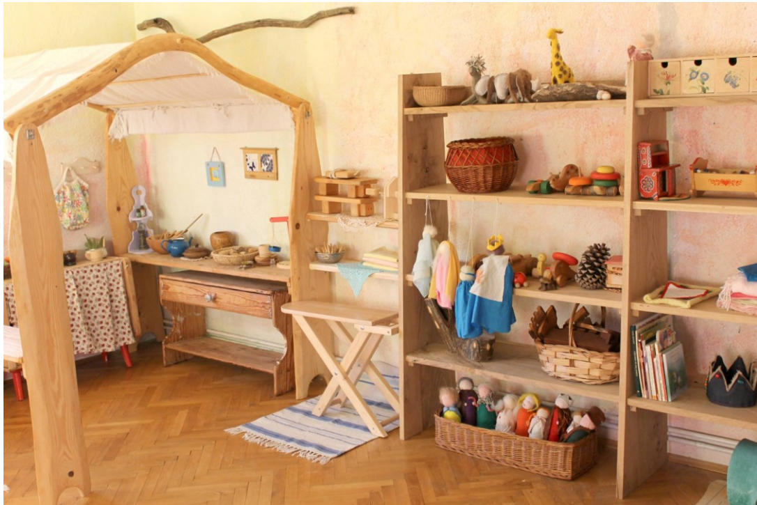
Slika 1: vrtić „Šumska vila „ u Zagrebu

URL: http://www.sumskavila.com/?page_id=479