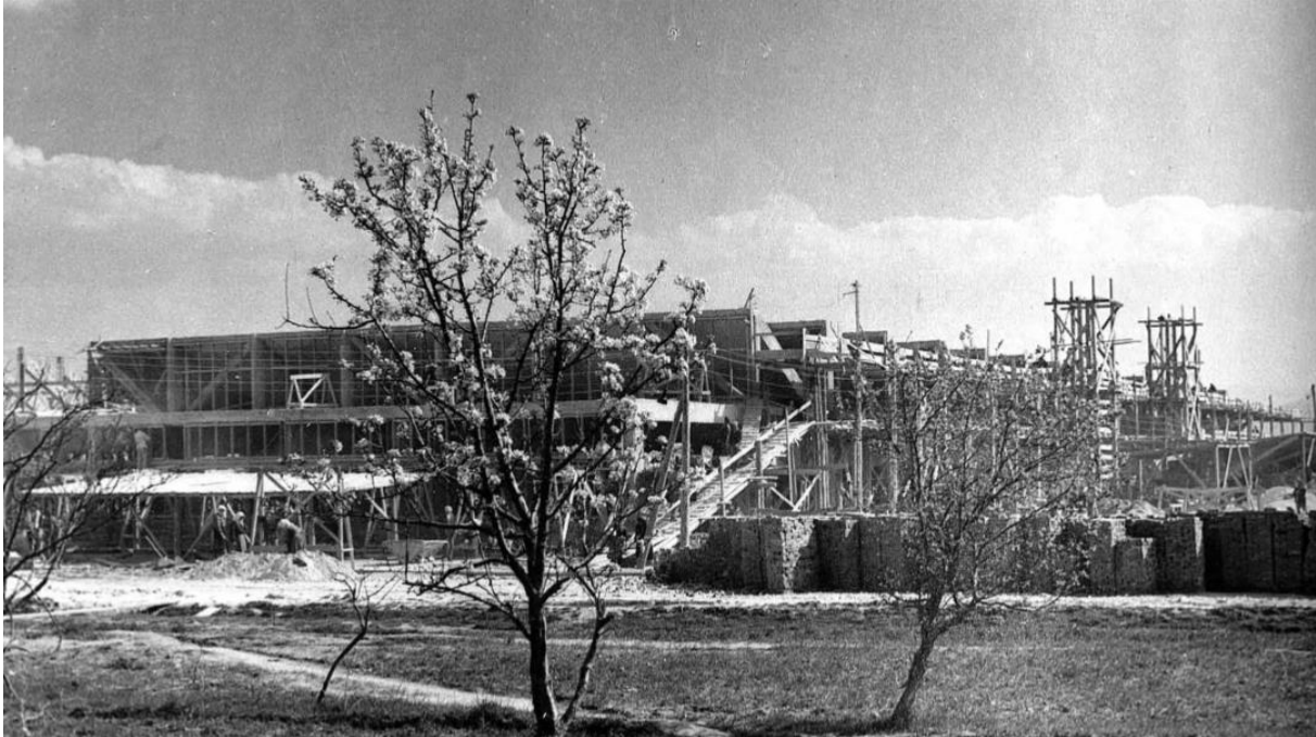
Slika 1. Izgradnja tvornice „Dalmatinka“ 11

plaća, davane mjesečne naknade te bonusi kao nagrade za uspješne radnike svakoga mjeseca. 10