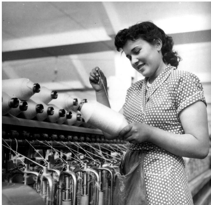
Slika 2. Nasmiješena radnica sa češljanim predivom. 21

No, prvobitni problemi u životu radnica te sama odbojnost prema ideji ženskog tvorničkog kadra brzo je nestala. Do pomaka u ženskom tvorničkom radu dolazi u kratkom roku jer su osigurane financijske potpore radnicama te im je omogućen znatniji napredak u obrazovanju. Tako se na radnice počinje gledati s više blagonaklonosti i poštovanja. U trenu kada više nije bilo sramotno zarađivati novac te kada je došlo do ostvarivanja potpore od strane cjelokupnog društva sa ženaradnica „skinula“ se stigma nemoralna i uloge domaćica. Moguće je zaključiti da rad u tvornici postaje prestiž i način napredovanja u blagodati socijalističkog društva. 20