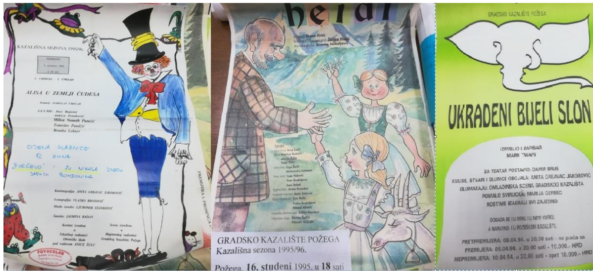
Slika 13. Plakati kazališnih predstava tijekom 1994. i 1995.