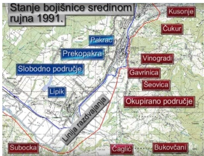
Slika 8. Prikaz bojišta u općini Pakrac u rujnu 1991.godine

Tijekom 16. i 17. kolovoza veliki broj srpskih obitelji odlazi iz grada. Nakon njihova odlaska u kuće ulaze naoružani pobunjeni Srbi koji su imali izrađenu taktiku za napad na grad. Uvečer 18. kolovoza srpske snage počinju s opsadom grada tražeći predaju policijske postaje. Budući da policija odbija predati postaju, pobunjenici 19. kolovoza ujutro u 5 sati počinju s minobacačkim i puščanim napadom na Postaju i ostale važnije zgrade u gradu. Policiji se u obrani Postaje i grada priključuju naoružani građani i zajedno odbijaju napad pobunjenika koji se povlače na istočni dio grada – Kalvariju, Vinograde i Gavrinicu – odakle su imali savršeni položaj za svakovrsne oružane napade raznim naoružanjem, od minobacača, snajpera do strojica. Uvečer u pomoć policiji dolaze specijalci iz Bjelovara i Zagreba. Vidjevši dolazak specijalaca, pobunjenici se povlače u okolna srpska sela odakle nastavljaju s minobacačkim napadima na Pakrac i Prekopakru. Tijekom 21. kolovoza intenzivne borbe lagano prestaju i specijalci odlaze iz grada na druga ratom zahvaćena područja. 54