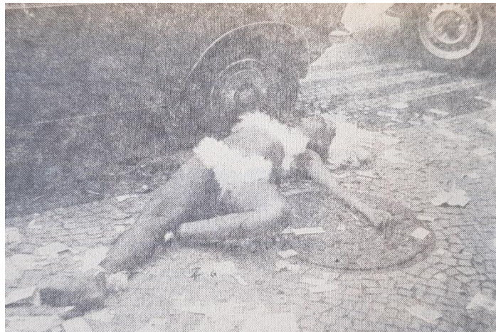
Slika 4. Karnevalska plesačica usnula na golom asfaltu

U časopisu „Vikend“ često se mogla pronaći reportaža ili interesantan članak o ljudima, prostorima i običajima dalekim Jugoslaviji, no nisu svi pisali o tim krajevima kao bajkovitim, prekrasnim mjestima bez mana. Tako se 1977., primjerice, govori o karnevalu u Rio de Janeiru. Naslov članka koji prekriva čitavu stranicu glasi „Tamna strana Rio-karnevala“, a u tekstu se detaljno govori o problemima koji prate karneval, o onome što se događa iza kulisa inače zabavne priredbe. Konkretnije, članak navodi kako je 1977. godine na karnevalu u Rio de Janeiru poginulo 245 osoba, dok je hospitalizirano njih čak 28.000. Usto, reporter javlja o neopisivom smradu i prljavštini iz sporednih ulica, nedostatku javnih zahoda, ljudima koji spavaju po pločnicima te sirotinji koja se iz favela spušta na karneval kako bi na barem tih nekoliko dana zaboravila na jad života. Međutim, čim se karneval privede kraju, svi se oni vraćaju u svoja sirotinjska naselja, jednako jadni i siromašni kao i ranije. Jedini koji su se među njima makar privremeno usrećili su oni koji su džepove napunili tuđim nakitom, novcem i ostalim ukradenim ili pronađenim predmetima. 50 Na slici 4 je prikazana karnevalska plesačica kako spava ili leži u nesvijesti na karnevalu u Rio de Janeiru.