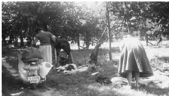
Slika 6. Kupci pakiraju krijumčarenu robu prije prelaska granice prema Jugoslaviji

povratku je drugačiju vrstu solidarnosti predstavljalo krijumčarenje robe. Uglavnom je svatko krijumčario ono što je sam kupio na način da je staru odjeću i obuću ostavljao u Trstu, a novu oblačio na sebe, dok su se manji predmeti skrivali u sva dostupna skrovišta, od duplih dna u torbama, sendviča, donjeg rublja i potplata cipela, pa sve do skrivenih prostora između sjedala, u vratima ili prtljažnicima vozila. No postojale su i zajedničke taktike krijumčarenja, od kojih je jedna bila ostavljanje stvari u jednoj torbi koja bi se sakrila negdje u vlaku ili autobusu. Ako bi carinici pronašli tu torbu, putnici bi rekli kako ne pripada nikome i jednostavno bi ju oduzeli bez pitanja. Druga je taktika uključivala prebacivanje torbi sa neprijavljenom robom iz vagona u vagon na način da se roba mimoilazi sa carinskim službenicima. Osim toga, roba se znala i distribuirati između putnika na način da putnici koji nose manje od službeno dopuštene razine neprijavljene robe preuzmu na sebe dio robe onih putnika koji tu razinu prelaze. 72 Na slici 6. prikazano je pakiranje krijumčarene robe prije prilaza granice prema Jugoslaviji.