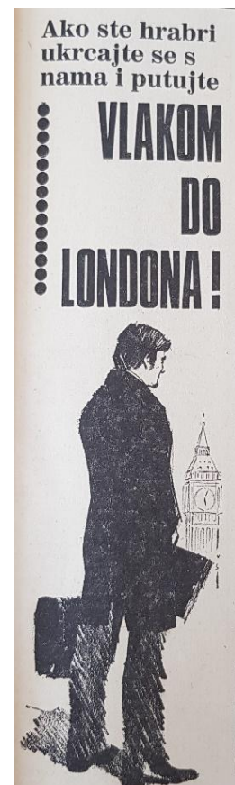
Slika 5. Vlakom do Londona Izvor: „Vlakom do Londona!“, Vikend , 25.3.1977., 23.

Ono što je posebno jedinstveno u slučaju jugoslavenskih putovanja u Italiju je činjenica kako se to odvijalo u vrijeme intenzivne i jasne podjele europskog kontinenta, podjele u kojoj Jugoslavija u vrijeme prekograničnih putovanja tehnički