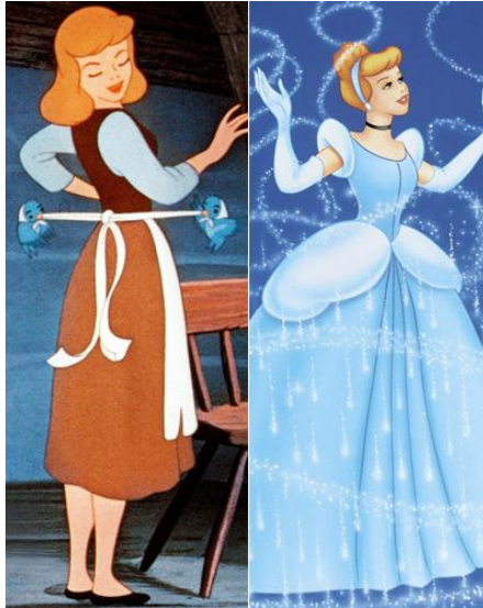
Slika 2. Pepeljuga