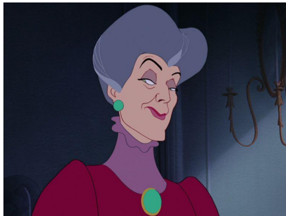
Slika 3. Maćeha

Disney pak u uvodnom djelu crtanog filma pomoću pripovjedača govori o maćehi te prigodnim bojama i prizorima dočarava njezinu zlobu: „Međutim, nakon prerane smrti ovog dobrog čovjeka, pokazala se maćehina prava narav. Hladna, okrutna i ljubomorna na Pepeljugin šarm i ljepotu, podlo je odlučila tjerati interese svoje dvije neugledne kćeri“ (Disney 1950.).