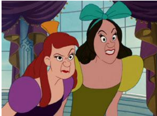
Slika 4. Polusestre Anastasia i Drizela

Disney je i u ovom slučaju polusestre prikazivao prizorima i njihovim djelima, a na početku ih je ukratko predstavio: „Njegova druga žena bila je iz dobre obitelji i imala je dvije kćeri Pepeljuginih godina. Zvale su se Anastazija i Drizela. (...) Obiteljsko bogatstvo su potrošile tašte i sebične polusestre“ (Disney 1950).