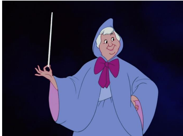
Slika 7. Kuma vila

Vila dolazi u trenutku Pepeljugin najdubljeg očaja: „Plakala je tako jako da nije mogla doreći što je započela. Kuma, koja inače bijaše vila, kaza: - Da bar možeš poći na ples, je li tako?“ (Perrault 2006:65). Ne daje svoju čaroliju bezuvjetno, već govori pravila kojih se Pepeljuga mora pridržavati da bi čarolija uspjela: „Pa dobro – reče Kuma – budeš li me u svemu slušala, ići ćeš na ples“ (Perrault 2006:66).