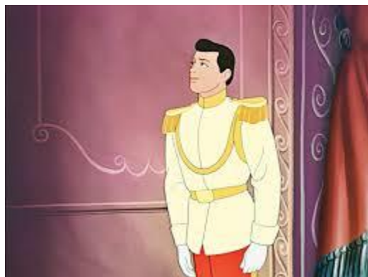
Slika 6. Kraljević

U Disneyevoj se inačici o kraljeviću doznaje u razgovoru njegova oca-kralja i vojvode: „Nema ali! Moj sin već dugo izbjegava svoje obaveze! Krajnje je vrijeme da se oženi i već jednom skrasi! (...) Taj dečko uopće ne surađuje! Bar jedna od njih bi bila dobra majka!“ (Disney 1950).