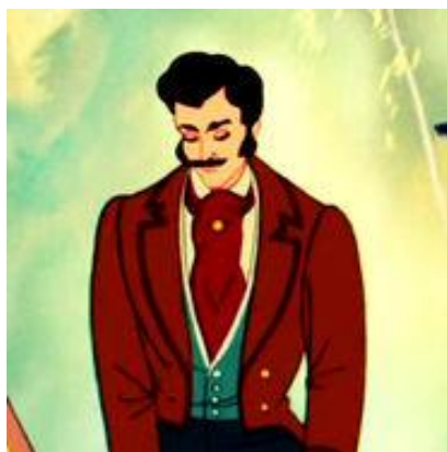
Slika 5. Otac