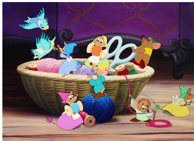
Slika 8. Pepeljugini pomagači