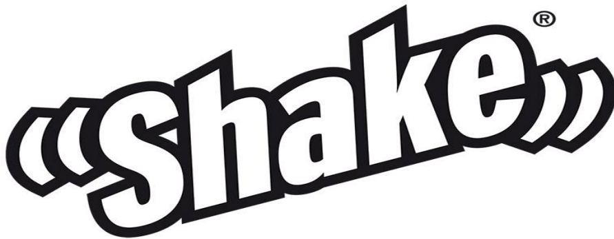
Slika 4. Logo proizvoda