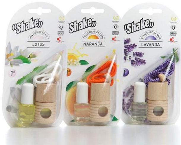
Slika 1. Proizvod „Shake“