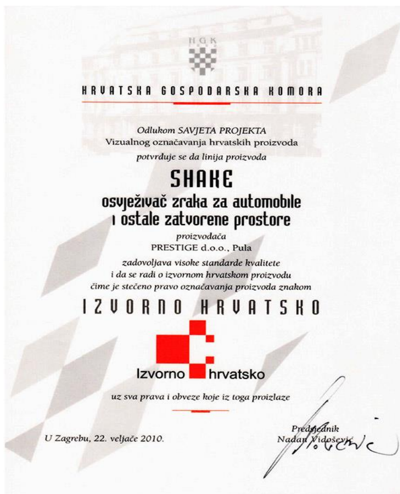
Slika 5. Izvorni hrvatski proizvod