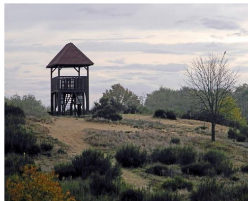
Slika 4: Đurđevački pijesci