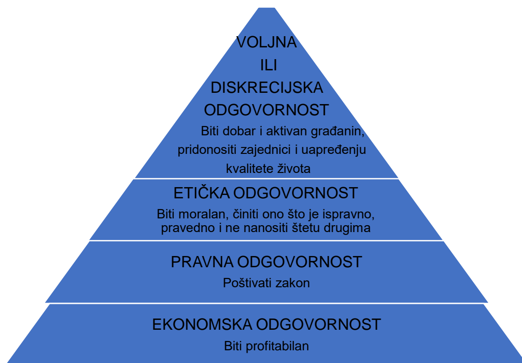
Slika 2. Carrolov prikaz razina odgovornosti poslovne organizacije