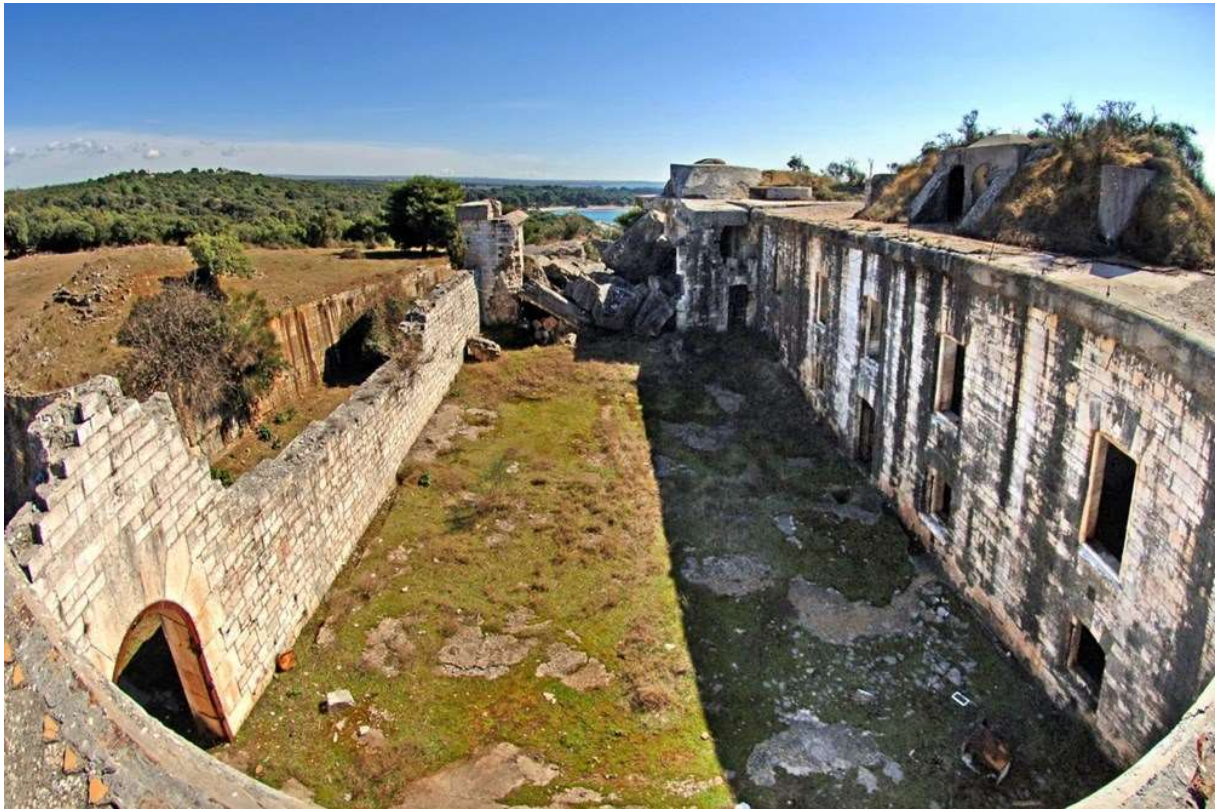
Slike 5.1. i 5.2. Tvrđava San Benedetto, Bale