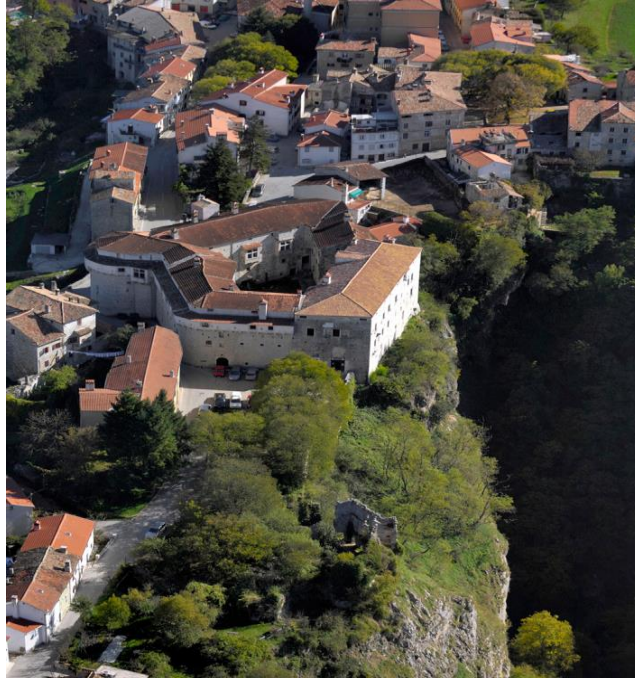
Slika 2: Pazinski kaštel