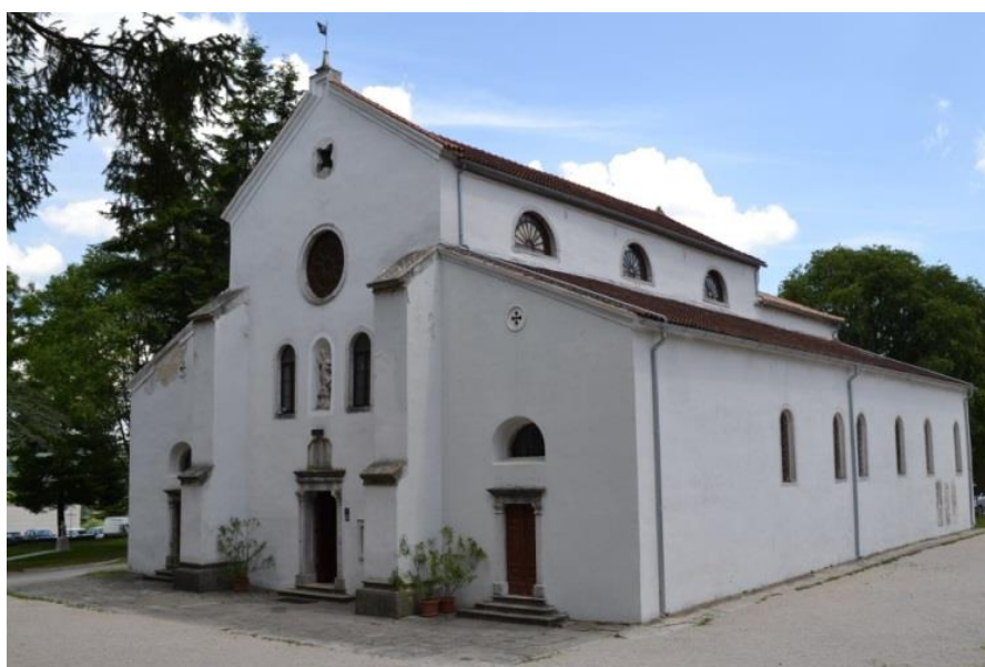
Slika 3: crkva sv. Nikole u Pazinu

riba te naposljetku stvaranjem Adama i Eve. Posljednja je scena ciklusa prikaz Adama i Eve s Bogom Ocem pred stablom spoznaje dobra i zla. Na bočnim su zidovima naslikani likovi proroka i prizori iz Starog i Novog zavjeta. Velika kompozicija Kristova raspeća nalazi se na istočnome zidu, a koja se danas, nažalost, ne vidi jer je ispred nje u doba barokne rekonstrukcije crkve postavljen glavni oltar. 9