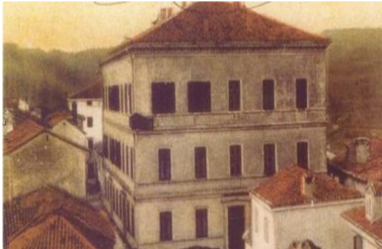
Slika 7: Najstarija hrvatska gimnazija u Istri

Najstarija hrvatska gimnazija u Istri, prikazana na slici 7, osnovana je u Pazinu 1899., na zahtjev Istrana koji su htjeli dobiti prvu hrvatsku srednju školu. Pazinska hrvatska gimnazija djelovala je 19 godina pod Austrijom, sve do jeseni 1918., kad je došla talijanska okupacijska vlast koja je zatvorila školu i rastjerala sve učenike i profesore. Ova je škola postala prvo rasadište hrvatskih, manjim dijelom i slovenskih intelektualaca s područja Istre i Slovenskog primorja od 1907., kada su iz nje izašli prvi maturanti. U toj gimnaziji je, uz ostale, bio nastavnik i Vladimir Nazor, poznati hrvatski književnik. 16