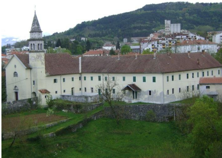
Slika 5: Kompleks franjevačkog samostana s crkvom Pohodađa Blažene Djevice Marije