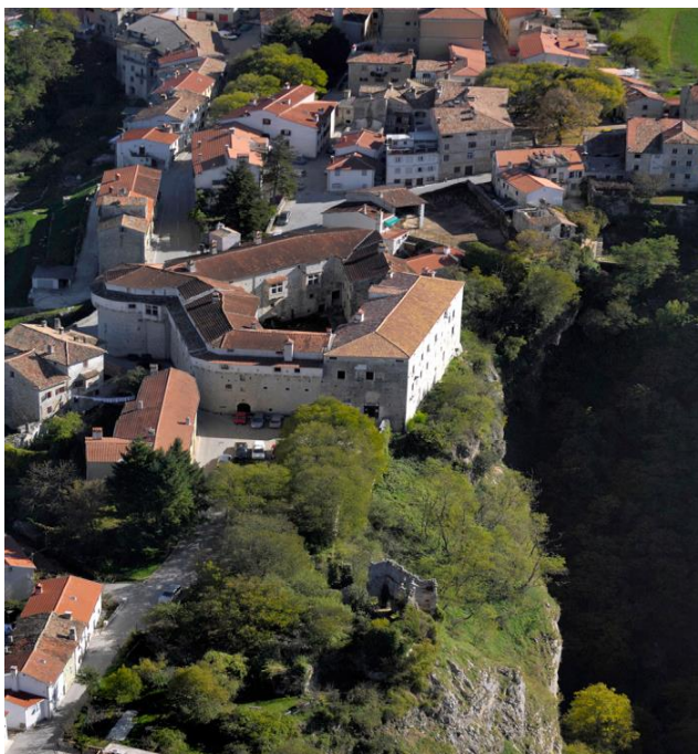
Slika 2: Pazinski kaštel