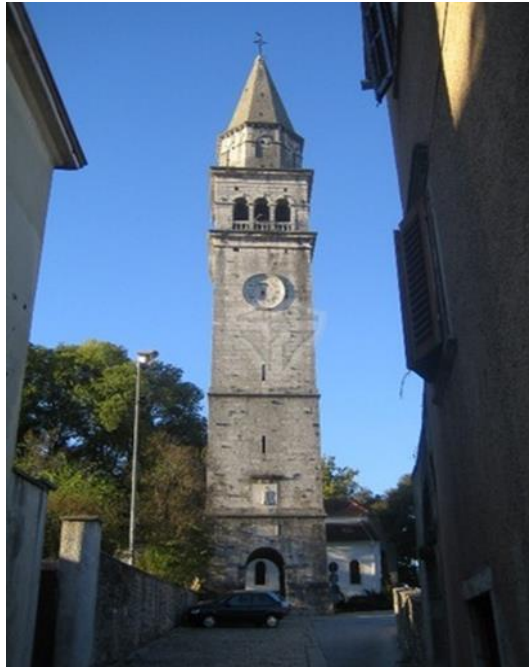
Slika 4: Zvonik crkve sv. Nikole u Pazinu

župna crkva, poput mnogih u Istri, imala zvonik ugrađen u zapadno pročelje. 10 Novi zvonik sad je odmaknut od crkve. Groblje se prostiralo oko crkve okruženo zidovima čije ostatke i danas nalazimo. Zvonik visok 45 metara izgrađen je od ravnomjerno oblikovanih kamenih blokova, a etažu na kojoj se nalaze krase po tri arkade. U početku je imao četiri zvona ukupno teška 2.850 kilograma, od kojih su tri 1916. skinuta za potreba austrijske vojske. Na njihovo su mjesto 1928. postavljena tri nova zvona, zajedno teška 3.200 kilograma, ali je 1942. za potrebe sad talijanske vojske skinuto najveće, ono od 1.480 kilograma, a njegovo je mjesto do danas ostalo prazno. 11