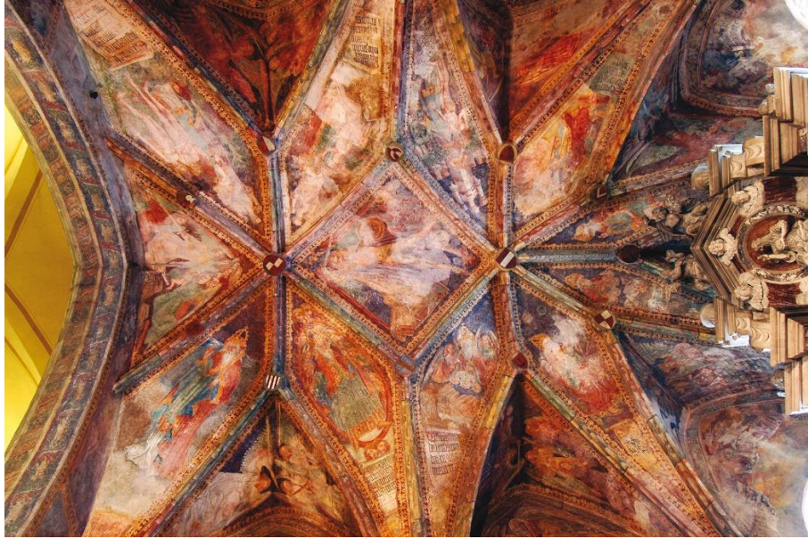
Slika 6: Pazinske freske