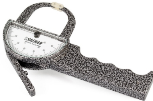
Slika 8. Langov kaliper