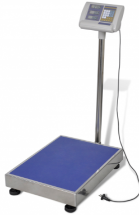
Slika 2. Digitalna vaga