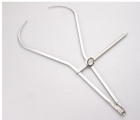
Slika 4. Pelvimetar

Pelvimetar je instrument za mjerenje nekih transverzalnih mjera, primjerice biakromijalni raspon, bikristalni raspon, širina prsnog koša, i sl. ( Slika 4. ). Pelvimetar se sastoji od dva zaobljena kraka, spojena vodoravnom prečkom, na kojoj se nalazi mjerna skala raspona 60 cm. Pelvimetar je kalibriran na 0,1 cm.