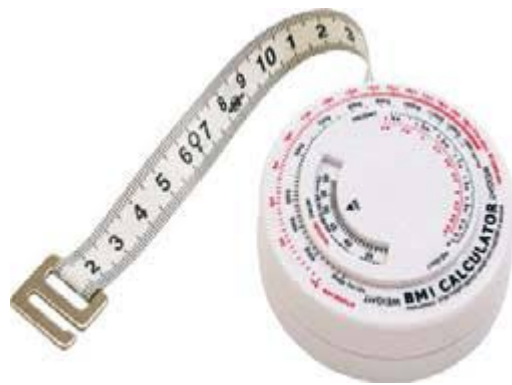
Slika 9. Centimetarska vrpca

Centimetarska vrpca služi samo za mjerenje opsega (opseg glave, opseg prsnog koša, i dr.). Preporuča se upotreba metalne centimetarske vrpce, no može se upotrijebiti i plastificirana vrpca. Duga je 150 ili 200 cm. Baždarena na 0,1 cm. Vrijednosti mjerenja zaokružuju se na 0,5 cm ( Slika 9. ).