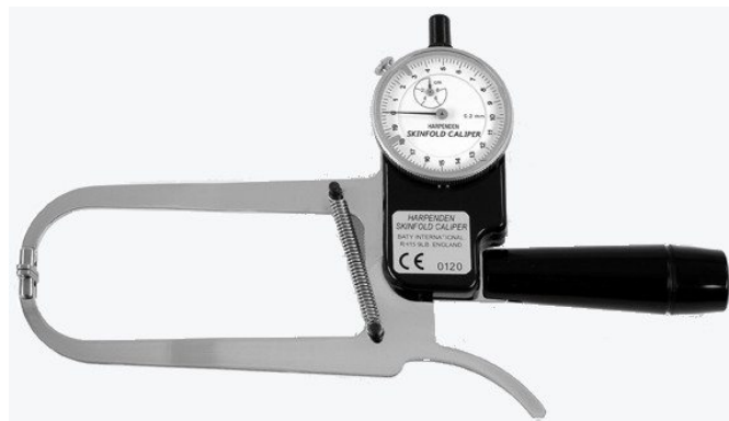
Slika 7. Harpendenov kaliper

Langov kaliper konstruiran je tako da tlak na duplikatori kože iznosi 10 \text{ g/mm}^2 . Mjerna skala raspona je od 60 mm. Baždaren na 1 mm, no interpolacijom omogućuje očitavanje na 0,5 mm (Slika 8.) (Mišigoj-Duraković, 2008).