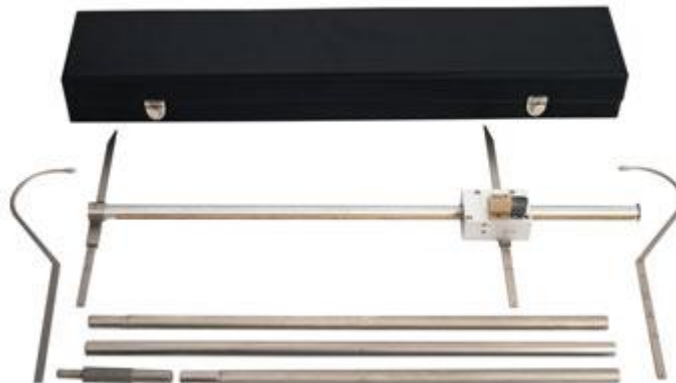
Slika 3. Antropometar

Antropometar je mjerni instrument u obliku metalnog štapa četverokutnog profila, koji na sebi ima nepomični i pomični krak (Slika 3.). Može se rastaviti na četiri jednaka dijela. Gornji, kraći ili duži dio upotrebljava se kao „skraćeni antropometar“. Ako se koristi u cjelosti, služi za mjerenje visine tijela, raspona ruku, sjedeće visine tijela ili dužine noge. U svom tzv. skraćenom obliku koristi se za mjerenje manjih dužinskih, longitudinalnih dimenzija i raspona, primjerice, dužine potkoljenice, dužine ruke, dužine stopala i dr. Skraćeni antropometar može se koristiti i umjesto pelvimetra (Mišigoj-Duraković, 2008).