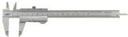
Slika 6. Klizni šestar

Klizni šestar je instrument kojim se mjere manje dužine, primjerice dijametar lakta, širina ručnog zgloba i sl. Završeci njegovih krakova nešto su oštrij, stoga odgovarajuće antropometrijske točke, pri mjerenju kliznim šestarom prethodno treba označiti. Očitava se na liniji koja se poklapa s unutarnjim rubom kraka šestara (Slika 6.).