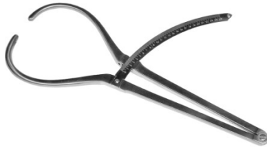
Slika 5. Kefalometar