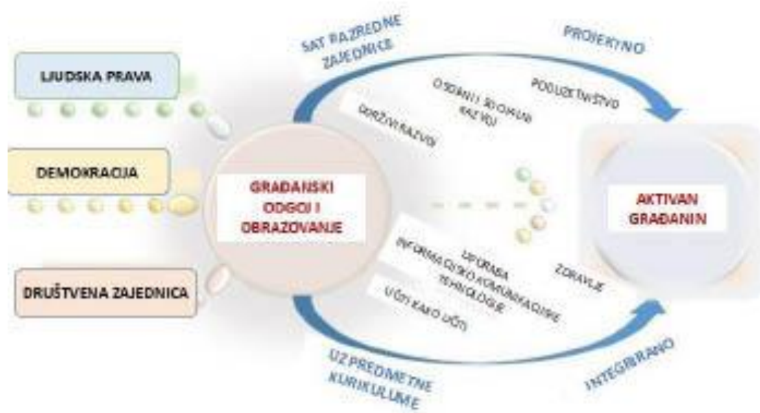
Slika 1. Shematski prikaz međupredmetne teme Građanski odgoj i obrazovanje 9

svoje konceptualno i teorijsko utemeljenje u sustavu odgoja i obrazovanja. Zbog velikih promjena koje se događaju u području odgojno-obrazovne politike Republike Hrvatske gotovo je nemoguće predvidjeti ishod ovog dugogodišnjeg procesa (Pažur, 2017). Na temelju članka 27. stavka 9. Zakona o odgoju i obrazovanju u osnovnoj i srednjoj školi (NN, 87/08, 86/09, 92/10, 105/10 – ispravak, 90/11, 16/12, 86/12, 94/13, 152/14, 7/17 i 68/18) ministrica znanosti i obrazovanja Blaženka Divjak donosi odluku o donošenju kurikuluma za međupredmetnu temu Građanski odgoj i obrazovanje za osnovne i srednje škole u Republici Hrvatskoj koja je na snagu stupila 25. siječnja 2019. godine.