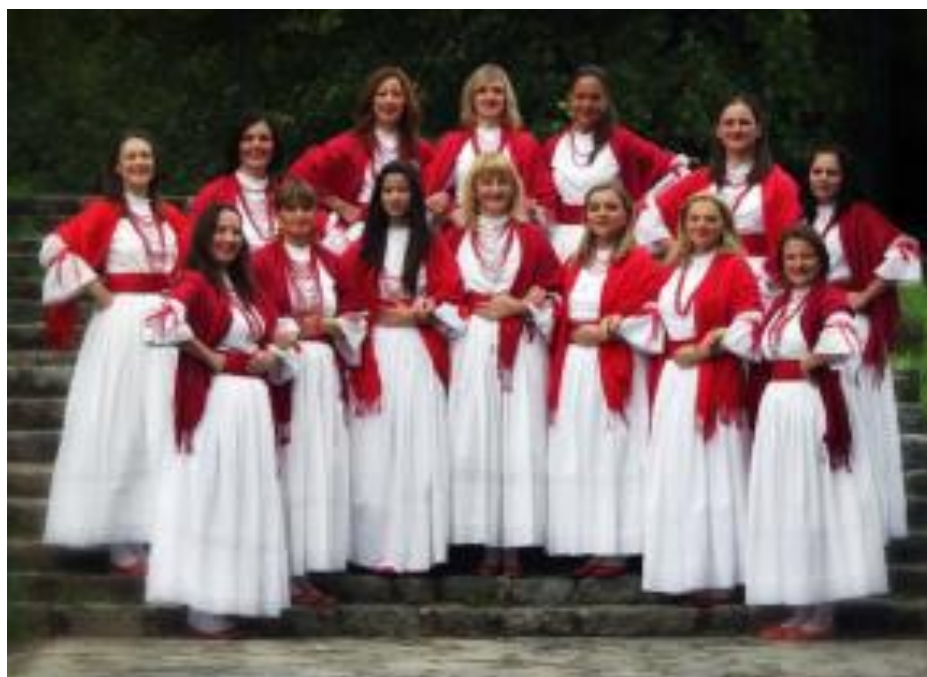
Fotografija 3. Članovi FD Vuga