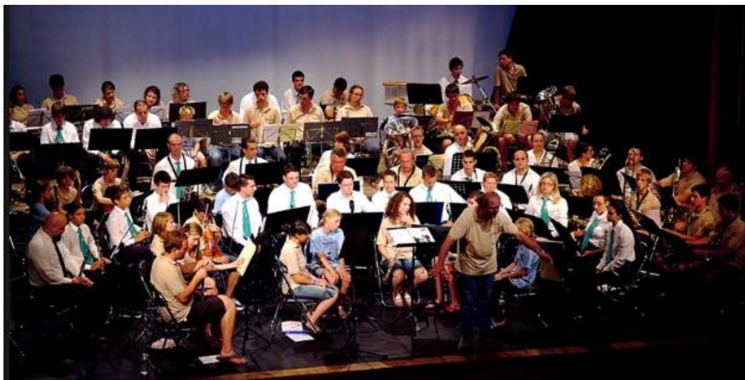
Fotografija 5. članovi Puhačkog orkestra grada Karlovca

1994. godine na sjednici je donijelo odluku o osnivanju Puhačkog orkestra grada Karlovca te je orkestar tada nastavio djelovanje pod novim imenom. Orkestar se odvaja od Glazbene škole Karlovac 26. travnja 1997. godine i osniva se udruga Puhačkog orkestra grada Karlovca. Unatoč tome članovi orkestra se i dalje okupljaju i imaju probe u zgradi Glazbene škole Karlovac. Od 1993. godine orkestar svake godine održava Novogodišnji koncert u Domu HV Zrinski ili Zorin domu, a on 1995. godine održavaju i Proljetni koncert u travnju ili svibnju u istim dvoranama. Od 1998. godine orkestar sudjeluje na regionalnoj smotri puhačkih orkestara u organizaciji ZOAKD-a Karlovac. Od iste godine sudjeluju i na državnim smotrama puhačkih orkestara u A kategoriji. Na 13. susretu hrvatskih puhačkih orkestara 1998. godine osvojili su zlatnu plaketu Hrvatskog sabora kulture. Zbog toga su odabrani za hrvatskog predstavnika 1999. godine u Egeru u Mađarskoj na neslužbenom europskom prvenstvu gdje je orkestar osvojio srebrnu plaketu. U travnju 2000. godine zbog nedobivanja novčane potpore grada Karlovca orkestar je prestao nastupati. U svibnju dolazi do smjene na mjestu voditelja orkestra te orkestar počinje opet nastupati uz neredovite probe. Puhači orkestar grada Karlovca objavio je 2001. godine fotomonografiju pod nazivom Puhački orkestar grada Karlovca. U povodu 20. godišnjice osnutka održan je koncert 2006. godine u Zorin domu.