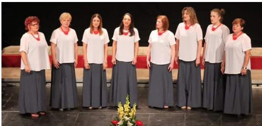
Fotografija 4. članice VG Karlovčanke