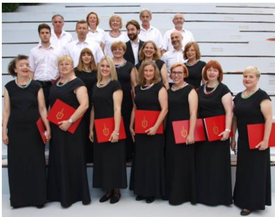
Fotografija 2. Članovi Chorusa Carolostadiena

na području grada Karlovca, Republike Hrvatske i u inozemstvu, zbor je dobio najveće priznanje povodom Dana grada Karlovca – plaketu i novčanu nagradu. Zbor je na međunarodnom natjecanju u Italiji 2002. godine osvojio zlatnu medalju i Grand prix natjecanja. U Češkoj su 2003. godine osvojili srebrnu medalju, a zlatnu 2004. godine na internacionalnom natjecanju pjevačkih zborova u Veroni. Srebrne medalje na međunarodnim natjecanjima pjevačkih zborova osvojili su 2005. godine u Češkoj, te 2007. godine u Slovačkoj. Prilikom sudjelovanja na Svjetskim zborskim igrama u Grazu (Olimpijada zborova) 2008. osvojio je zlatnu medalju u konkurenciji folklorne glazbe 18 , te srebrnu plaketu u kategoriji komornih zborova. Na svjetskom natjecanju zborova u Španjolskoj 2012. godine Carolostadien osvaja dvije srebrne medalje u dvije različite kategorije. U 2011., 2012. i 2013. godini zbor se može pohvaliti srebrnim plaketama na festivalima pjevačkih zborova u Zagrebu. Uz brojna gostovanja u Hrvatskoj te na međunarodnim natjecanjima širom Europe osvojio je ukupno tri zlatna, tri srebrna i jedno brončano odličje te jedan Grand Prix natjecanja.