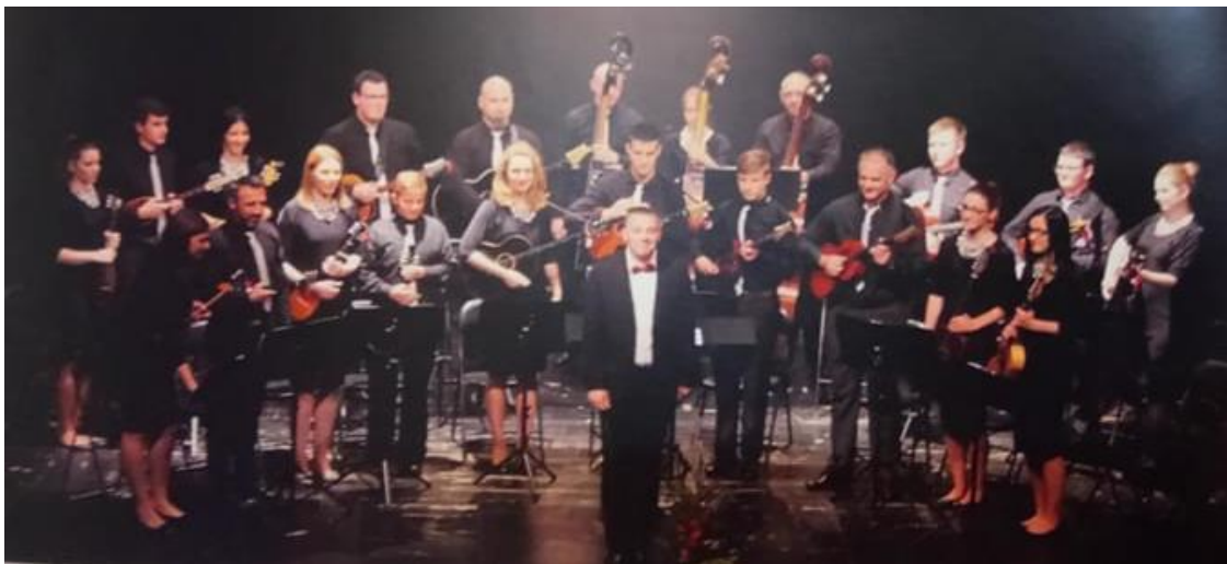
Fotografija 6. članovi Karlovačkog tamburaškog orkestra

Karlovac je pružao najveću novčanu potporu orkestru. Od 2009. godine Karlovački tamburaški orkestar osmislio je i pokrenuo niz koncerata pod nazivom Karlovčanima s ljubavlju. Od 2013. do 2016. godine održali su šest koncerata u Zorin domu. Gotovo svake godine orkestar je sudjelovao na Županijskoj smotri tamburaških orkestara i malih sastava te su na osnovu svoje izvedbe upućivani na državnu smotru, Susret hrvatskih tamburaških orkestara i malih sastava. U Dugom Selu je 4. i 5. listopada 2014. godine održan 21. Susret gdje je sastav Karlovački tamburaški orkestar dobio 3. nagradu ocjenjivačkog suda Hrvatskog sabora kulture za izvedbu u kategoriji koncertnih sastava.