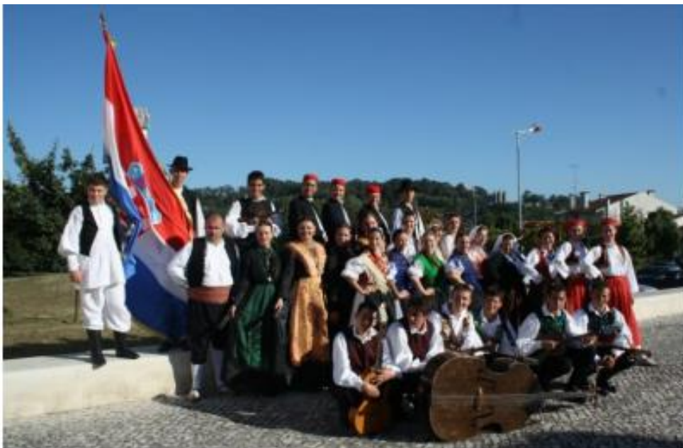
Fotografija 8. članovi FA Matija Gubec