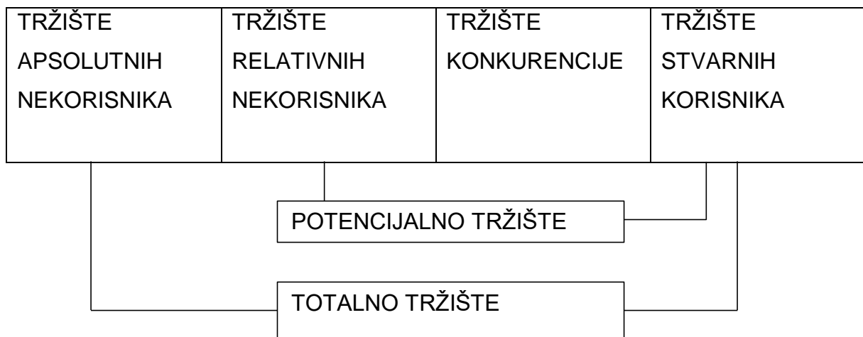
SLIKA 1: SEGMENTACIJA TRŽIŠTA

Kod istraživanja tržišta može se uspješno koristiti postupak segmentacije tržišta.