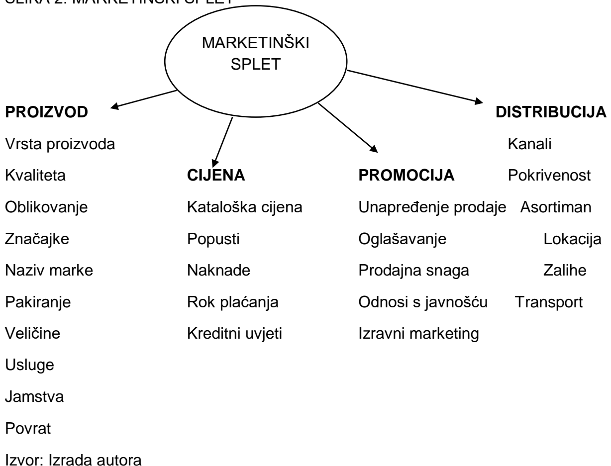
SLIKA 2: MARKETINŠKI SPLET

Marketinški miks je način kako ostvariti planirane ciljeve. Marketinški miks predstavlja specifičnu kombinaciju elemenata koje se koriste za istovremeno postizanje ciljeva poduzeća i zadovoljenje potreba i želja ciljnih tržišta. Marketinške aktivnosti su podijeljene u instrumente marketinškog spleta točnije u četiri kategorije koje se nazivaju 4P, a to su product (proizvod), price (cijena), place (distribucija), promotion (promocija).