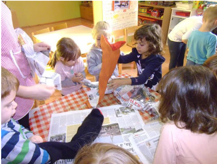
Slika 18. Gužvanje novina i punjenje štapnih lutaka i lutka zijevalica