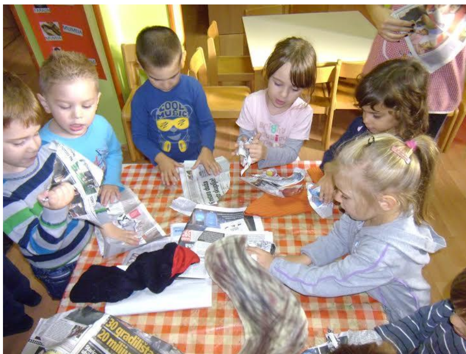
Slika 16. Gužvanje novina i punjenje štapnih lutka i lutka zijevalica