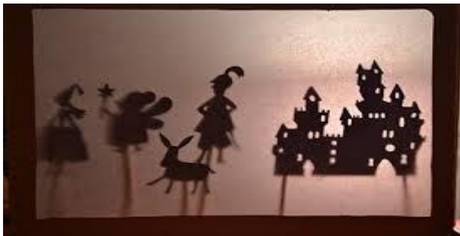
Slika 7. „Lutke sjena“