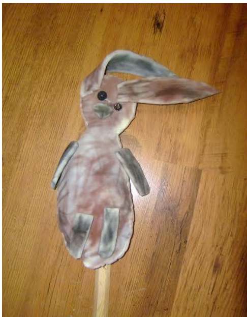
Slika 23. „Zec“ - štapna lutka, izrađena je od spužve, korištena je tehnika bojanja kredama u boji. Najprije su djeca bojala manje dijelove spužve koje smo im prethodno izrezali, u međuvremenu je jedna skupina bojala veće dijelove spužve. Nakon toga spajali su manje i veće dijelove spužve, odnosno aplicirali su oči, nos, usta, šape kako bi lutka dobila svoj oblik i potom su lutke punjene novinskim papirom. Vidimo da je obojana cijela površina spužve, koristili su smeđu, sivu i crnu boju.