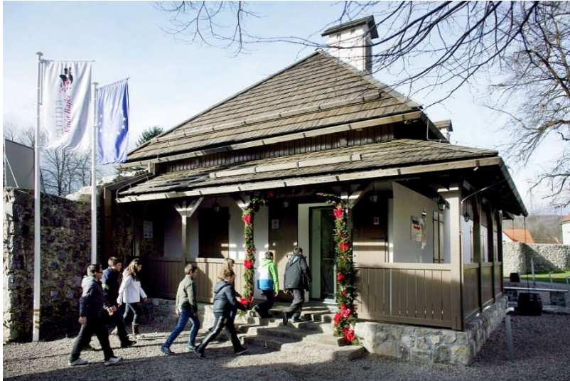
Slika 15. Ivanina kuća bajke

Ogulina. Odlazi se u posjet spomen sobe Ivane Brlić – Mažuranić u čiju je čast uređena u muzeju. Nakon toga u hotelu Frankopan bila bi organizirana tradicionalna ogulinska večera s Ivanom Brlić-Mažuranić i njezinim likovima, a gosti bi prespavali u sobama koje nose imena likova iz bajki npr. Regoč, Kosjenka, Hlapić, Stribor itd. Nakon doručka slijedi putovanje autobusom za Slavonski Brod gdje se održava manifestacija „U svijetu bajki Ivane Brlić-Mažuranić“, a posjetitelji mogu uživati u raznim predstavama i izložbama posvećenim velikoj hrvatskoj spisateljici.