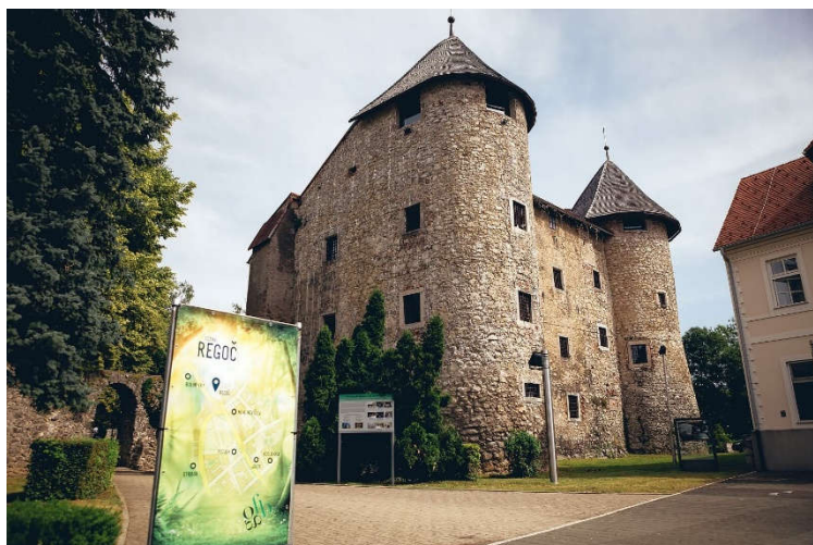
Slika 11. Frankopanski kaštel