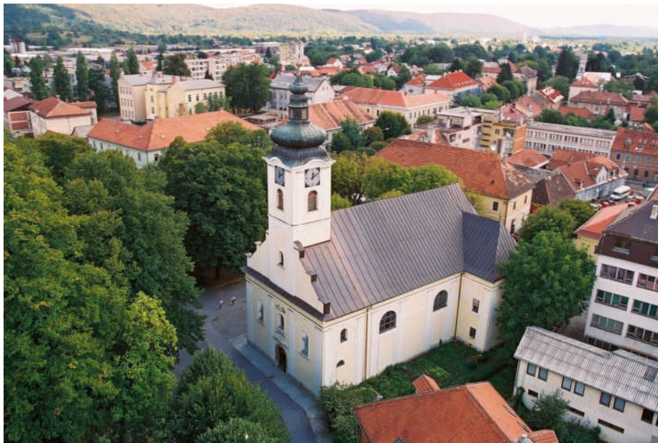
Slika 10. Župna crkva Uzvišenja sv. Križa

Župna crkva Uzvišenja sv. Križa (Slika 10.) je sagrađena 1781. godine i nalazi se u samom središtu grada, točnije u Parku kralja Tomislava. Crkva pripada jednobrodnim građevinama dvoranskog tipa sa segmentnim završetkom svetišta. Inventar crkve oblikovan je u oblicima kasnobarokno-klasicističkog stila.