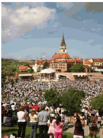
Slika 5. Hodočašće Mariji Bistrici