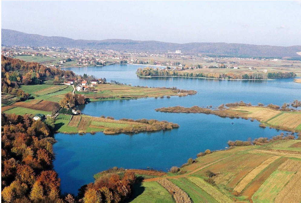
Slika 9. Jezero Sabljaci