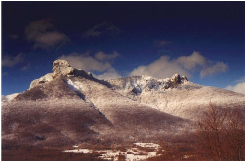
Slika 7. Planina Klek

Ogulin se je smjestio u samom središtu Hrvatske, točnije u Karlovačkoj županiji. Ogulin omeđuje Lika, Gorski Kotar i Kordun, pa kao takav zapravo se ne može smjestiti u niti jednu od ovih geografskih područja, već se nalazi u Ogulinsko-plašćanskoj udolini. Njega okružuju planina Klek (Slika 7.) i rijeka Dobra koja ponire u samom centru grada u Đulinom ponoru.