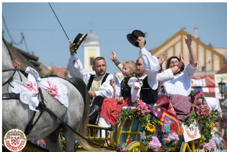
Slika 6. Đakovački vezovi