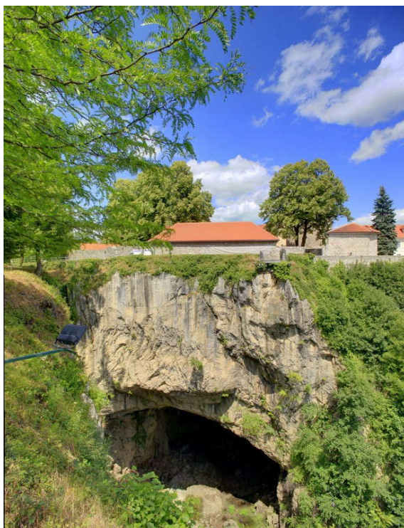
Slika 13. Đulin ponor