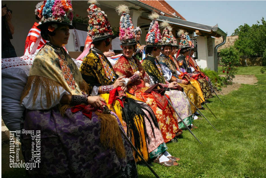
Slika 4. Ljelje iz Gorjana