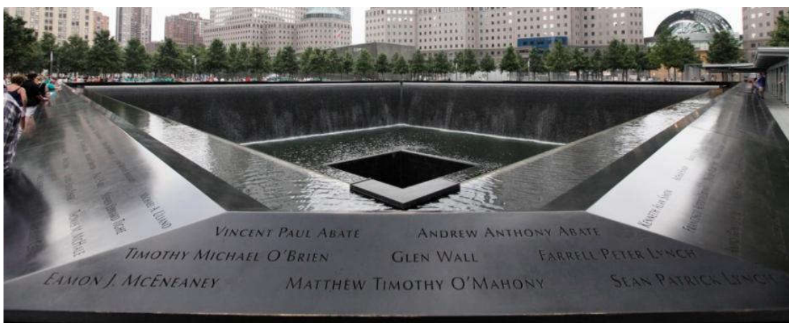
Slika 2. Spomenik u čast poginulima u padu Blizanaca (WTC)