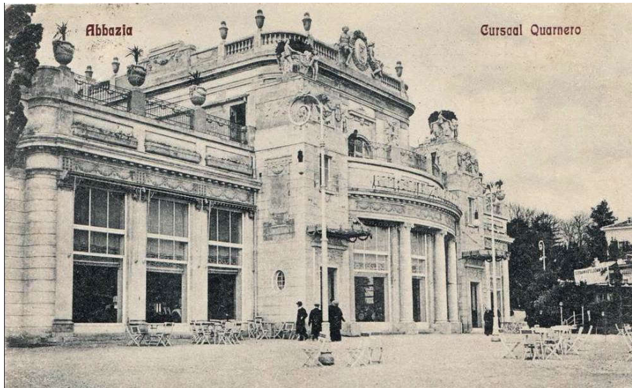
Slika 1. Hotel Kvarner u Opatiji iz 1910. godine