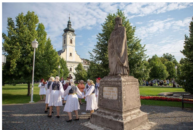
Slika 14. Županijska smotra izvornog folklora – Igra kolo