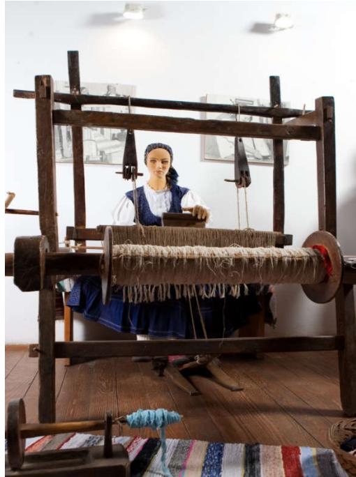
Slika 12. Etnografska zbirka

braniteljima je najnoviji muzejski postav, a prikazuje Domovinski rat u ogulinskom kraju. Posljednja zbirka je Zbirka kamenih spomenika koja sadrži zaglavni kamen s frankopanskim grbom iz zavjetne crkve Blažene Djevice Marije od Čudesa u Oštarijama, kameni ulomci, natpis s rimskoga žrtvenika i miljokazi. Posebno vrijedni su nadgrobna ploča Stjepana Frankopana iz Modruša te kip rimskog vojnika.