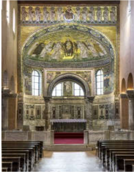
Slika 3. Unutrašnjost Eufrazijeve bazilike u Poreču