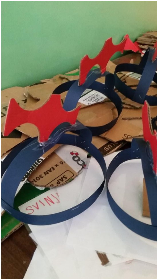
Slika 23. Prikaz izrađenih kapica s krijestom koja je dio rekvizita u igrokazu.