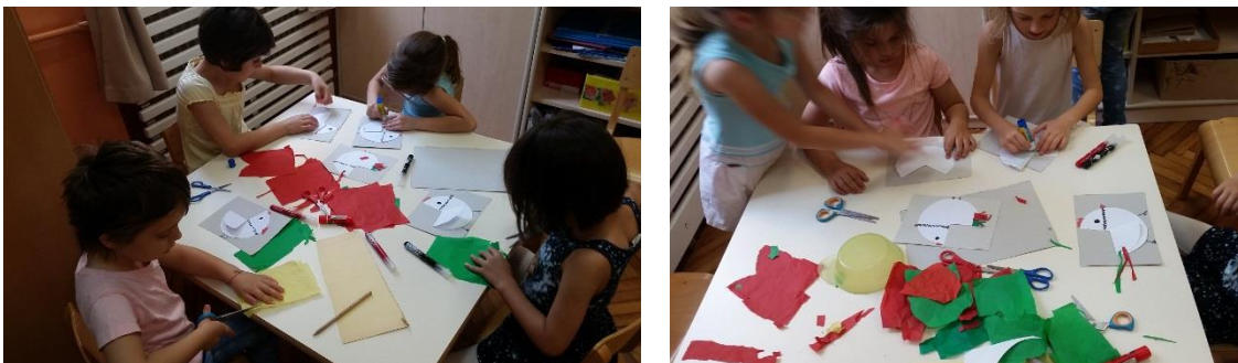
Slika 9. Ukrašavanje koka i pijetlova s perjem od trakica krep papira.

Djeci sam na stolu pripremila koke i piliće koje su izrađivali u prethodnoj likovnoj aktivnosti te su tu likovnu aktivnost povezali sa ovom u kojoj su djeca izrađivala lutke. Koke i pilići su izrađeni od papira. Djeca su im crtala dijelove tijela i samostalno radila sa škarama i ljepilom, što je jako važno za razvoj motorike šake i ruku. Djeca su imala zadatak da već izrađene koke i piliće ukrase perjem, te da obrate pažnju kako će se perje od pijetla razlikovati od perja ostalih koka. Na stolu im je bio ponuđen krep papir kojeg su trebali izrezati na trakice, te od trakica izraditi perje. Kada su djeca završila s ukrašavanjem koka, pilića i pijetlova, radove su plastificirali i od njih napravili lutke na štapu.