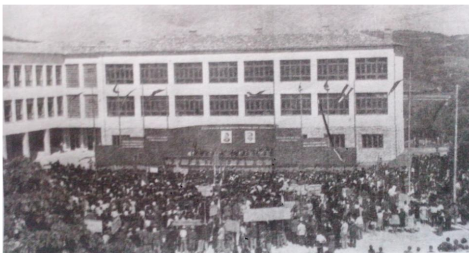
Slika 2. Svečano otvaranje zgrade nove gimnazije u Pazinu

Nova zgrada osnovne škole i gimnazije u Pazinu počela se graditi u prosincu 1947. godine. Njezino svečano otvaranje održano je povodom rujanskih svečanosti, 10. i 11. rujna 1949. godine. 94 Bio je ovo zasigurno jedan od najznačajnijih i definitivno u tisku najviše najavljavani događaj u prvih deset godina poratnog Pazina. Velika proslava obuhvaćala je, osim otvaranja škole, i obilježavanje šeste godišnjice općeg narodnog ustanka protiv fašizma u Istri, potom pedesetu godišnjicu osnivanja Prve hrvatske gimnazije u Pazinu, a ovom prigodom otkrivena je brončana bista tada nedavno preminulog Vladimira Nazora, koji je također vezan za Pazin, te je otkrivena i spomen-ploča Otokaru Keršovaniju, po kojem je ova škola i dobila ime. Pred oko 30 tisuća okupljenih, kako prenosi Glas Istre , govore su održali visoki uzvanici: dr. Vladimir Bakarić, predsjednik vlade NR Hrvatske, ministar prosvjete dr.