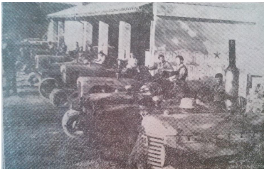
Slika 5. Traktorska brigada SPOM-a u Pazinu spremna za polazak na oranje

knjigovodstvene poslove unutar zadruga. Po zanimanju zadrugari kotara Pazin su radnici, prodavači, trgovci, domaćice, i naravno poljoprivrednici. Unutar zadruga obnašaju pak sljedeće dužnosti: predsjednik zadruga, knjigovođa, pomoćni knjigovođa, prodavač, nabavljač, evidentičar, gostioničar (ukoliko zadruga posjeduje gostionicu). Predsjednik zadruga često nije najškolovaniji među zadrugarima, ali ni najbolje plaćen, već je to najčešće knjigovođa. Primjećujemo i imena koje nose zadruga, ne samo na Pazinštini, već i diljem Jugoslavije. Ona su redom vezana uz NOB, narodne heroje i istaknute političare. Zanimljivo