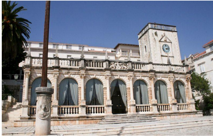
Slika 2.: Loggia u gradu Hvaru

Nedavno su završeni radovi kojima je vanjski kamen potpuno očišćen i zaštićen za neko vrijeme, a trenutno je u tijeku i obnavljanje prednjih lukova, odnosno prozora.