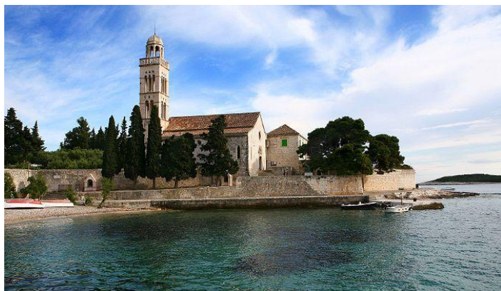
Slika 3.: Franjevački samostan u gradu Hvaru

cijeli zapadni zid pokriva monumentalna slika Posljednja večera . Uz to platno, u franjevačkom samostanu nalazi se još mnogo slika, stare čipke, zbirka novca koji se koristio u Hvaru, crkveno ruho iz 14. stoljeća i slično. U kući se nalazi biblioteka, a u vrtu za odmor još uvijek živi čuveni čempres rašljasta oblika koji je star preko 500 godina. 19