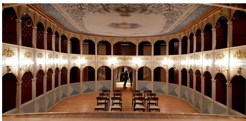
Slika 5.: Obnovljeno hvarsko kazalište