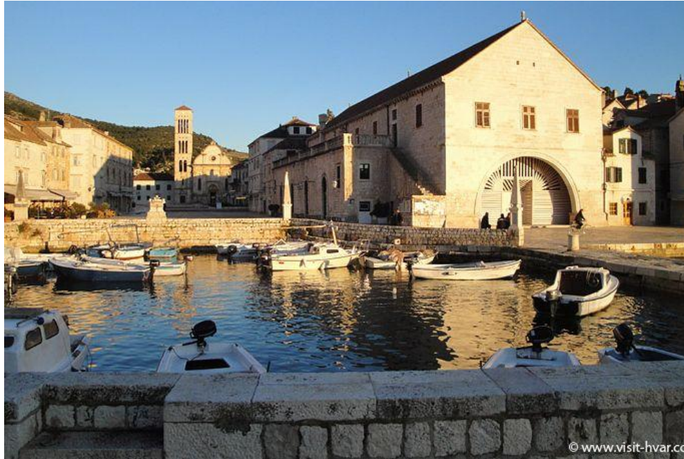
Slika 1.: Arsenal u gradu Hvaru