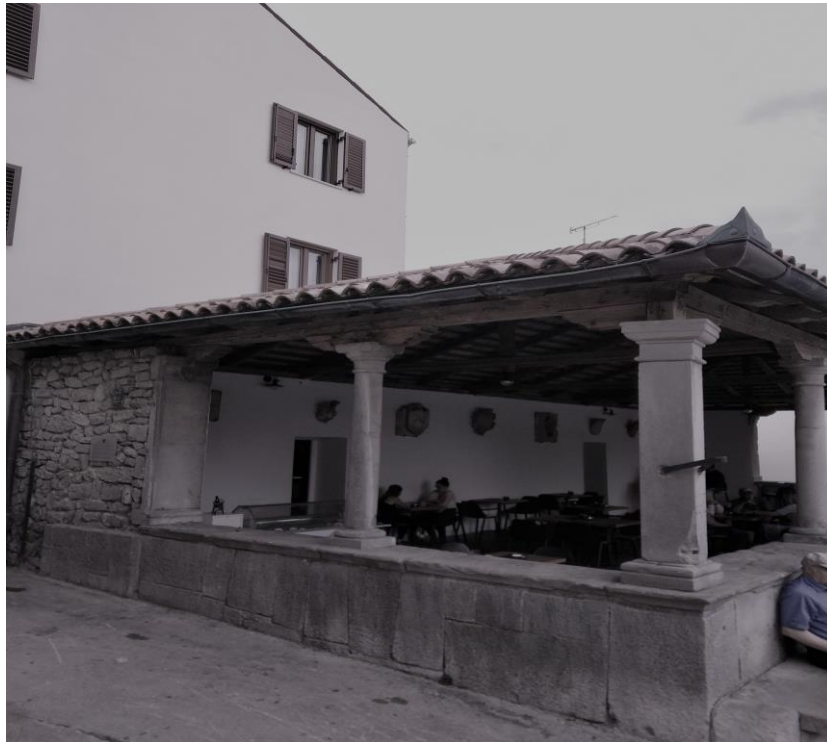
Izvor: vlastiti izvor (06. rujan, 2019.)