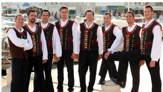
Slika 15. Klapa Bunari

„Omiš je meka klapskog pjevanja, pobjeda na njegovim pozornicama godinama se prepričava, ondje nastaju legende. Klapa je krug, a središte mu je u Omišu.“ (Maljković i Opačić, 2017: 281). Dalmacija je kolijevka te vrste glazbe, no Zagreb i Rijeka postupno postaju značajna središta. Klape osnivaju u dijaspori hrvatski iseljenici.