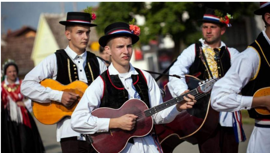
Slika 8. Izvođenje bećarca ( https://www.dnevnik.ba )

„Budući da je omiljen i duboko usađen u kulturu istočne Hrvatske, bećarac se na novije naraštaje i danas prenosi pretežno na tradicionalan način, u sklopu spontanog procesa enkulturacije.“ (Maljković i Opačić, 2017: 200). Uključivanje bećarca na UNESCO-ov Reprezentativni popis nematerijalne kulturne baštine čovječanstva zbilo se 2011. godine, a u nacionalni registar kulturne baštine 2007. godine.