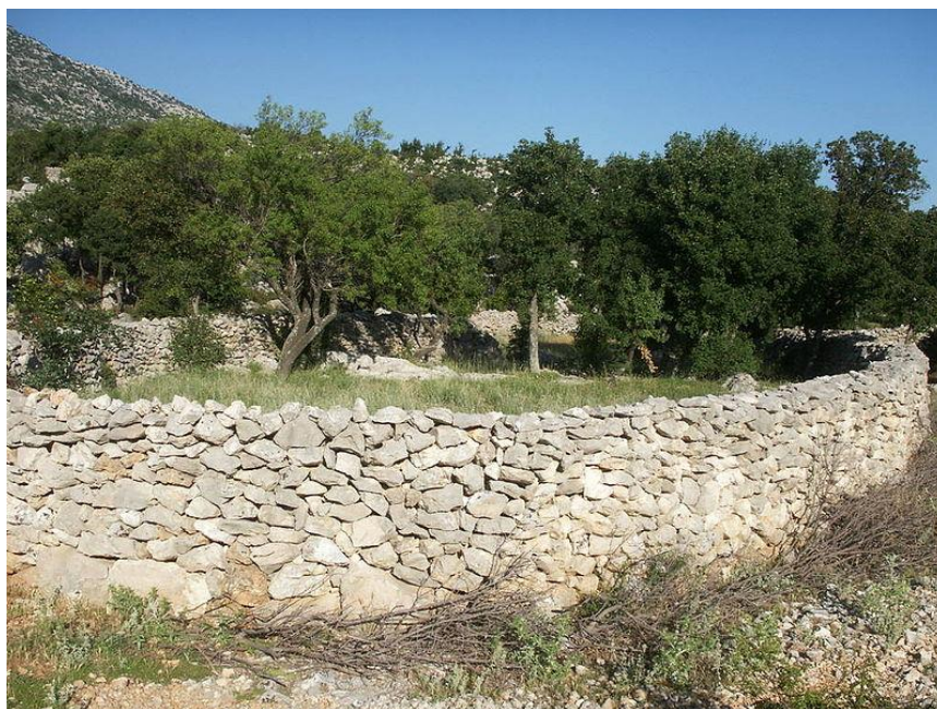
Slika 13. Suhozid

Umijeće suhozidne gradnje obuhvaća slaganje kamenja jednog na druge bez upotrebe vezivnog materijala, osim ponekad suhe zemlje. Stabilnost strukture osigurava pažljiv izbor i slaganje kamena. Ovo se umijeće gradnje koristi na jadransko-dinarskom području od prapovijesti do današnjeg dana. Kamene konstrukcije obično se grade na seoskim područjima – unutar i izvan naseljenih prostora, a može ih se pronaći i u urbanim područjima. „Vitalna uloga suhozida je i u sprječavanju klizišta, poplava i lavina, te u borbi protiv erozije i pustinjaka zemlje, u povećanju biološke raznolikosti i u stvaranju odgovarajućih mikroklimatskih uvjeta za poljoprivredu.“ ( https://www.otoci.eu/unesco-umijece-suhozidne-gradnje-zasticena-je-nematerijalna-kulturna-bastina-covjecanstva/ ). Suhozid je nezamjenjiva tehnika za izradu putova, prepreka i zaklona, a posebno za prilagodbu kamenitih terena u poljodjelstvu. Najveći dio gradnje odvija se tijekom ograđivanja, oslobađanja zemlje od kamena, izvedbe terasa i gradnje kamenih zaklona koji služe kao privremeno boravište.