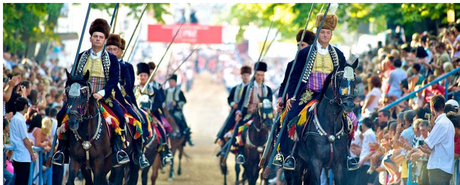
Slika 14. Sinjska alka

Sinjska alka održava se od 1717. godine te je samo jedanput bila odgođena na više mjeseci zbog kolere (1855. godine), a tijekom Drugog svjetskog rata nije se održavala (osim 1944. godine). Dan održavanja alke nakon Drugog svjetskog rata je prva nedjelja u kolovozu.