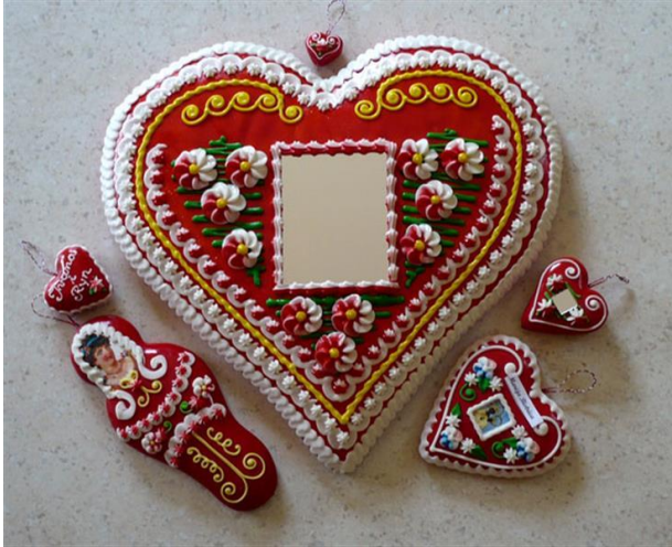
Slika 11. Međičarski obrt ( https://www.zhrmku.org )

Na UNESCO-ovu Reprezentativnu listu svjetske nematerijalne baštine čovječanstva ovaj fenomen upisan je 2010. godine.