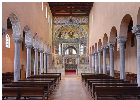
Slika 2. Unutrašnjost Eufrazijeve bazilike

Važnost Eufrazijeve bazilike je uvođenje troapsidalnosti koja je tada predstavljala inovaciju u sakralnoj arhitekturi te zbog bogate dekorativnosti i ornamenata koja su imala bizantska obilježja. Pozlaćeni figurativni mozaici koji su vidljivi na srednjoj apsidi predstavljaju jedne od najvažnijih spomenika toga tipa iz 6. stoljeća.