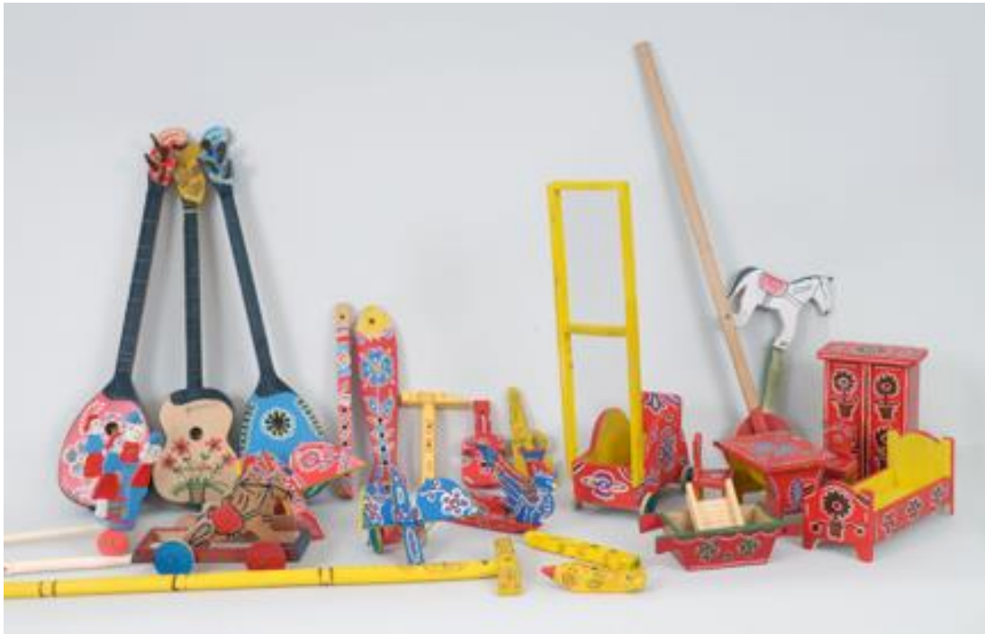
Slika 9. Drvene tradicijske igračke s područja Hrvatskog zagorja ( https://www.min-kulture.hr )