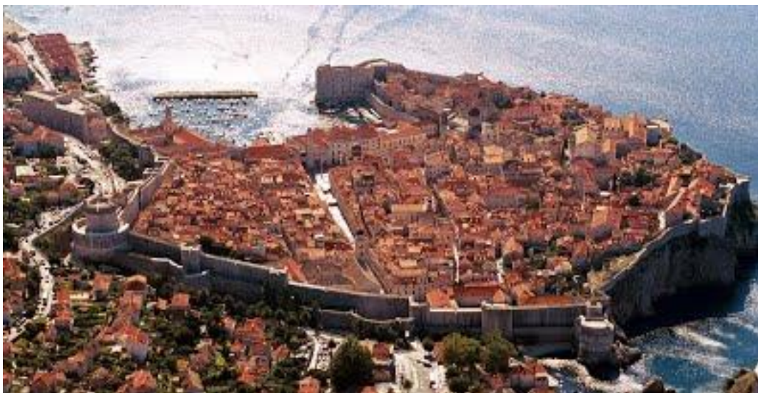
Slika 7. Stari Grad Dubrovnik

Na kraju glavne ulice Straduna koja se proteže u smjeru istok-zapad i grad dijeli na 2 dijela nalaze se palača Sponza iz 16. stoljeća i palača Knežev dvor iz 15. stoljeća. Na zapadu su Vrata od Pila koja služe kao prvi ulaz u grad, a na istoku se nalaze Vrata od Ploča koja predstavljaju drugi ulaz u grad. Franjevački samostan, koji je smješten na zapadnom ulazu, sagrađen je u 15. stoljeću, a u crkvi se nalazi grob hrvatskog književnika Ivana Gundulića. Katedrala koja je obnovljena nakon potresa sadrži renesansne i barokne karakteristike. Crkva Svetog Vlaha romanička je crkva koju je zahvatio požar, stoga ju je 1715. godine obnovio Marino Gropelli u baroknom stilu. U crkvi je kip svetog Vlaha, izgrađen u 15. stoljeću. Sveti Vlaho, zaštitnik Dubrovnika, drži model grada i predstavlja jedinstveni dokument o izgledu grada prije potresa 1667. godine.