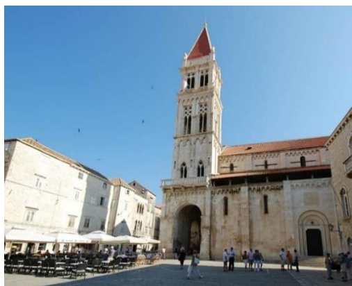
Slika 4. Katedrala Svetog Lovre

Najpoznatiji objekt je katedrala Svetog Lovre s čuvenim zapadnim portalom, koja je rad majstora Radovana iz 1240. godine. Smatra se najmonumentalnijim djelom romaničko-gotičkog stila u Hrvatskoj (Grabovac, 2013: 51). Katedrala se sastoji od tri lađe, predvorja i tri polukružne apside. Kapela sv. Ivana Trogirskoga tj. Ursinija, renesansna kapela koja je u 15. stoljeću dodana katedrali Svetog Lovre, jedan je od najljepših spomenika iz razdoblja renesanse u Europi ( http://www.trogir.hr/GradTrogir/o-trogiru/kulturna-bastina/katedrala ).