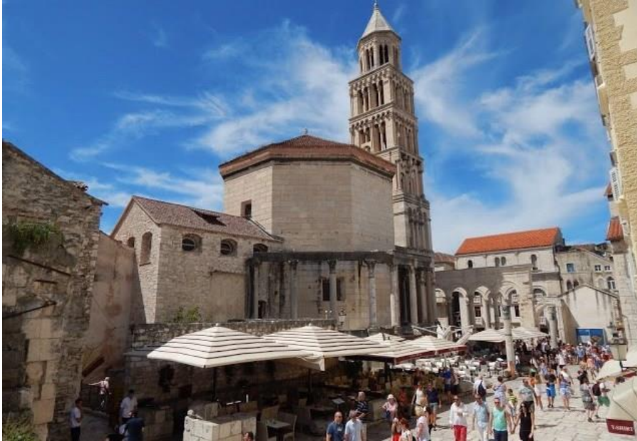
Slika 6. Katedrala Svetog Duje

Tutmozisa 3., a pred ulazom u Jupiterov hram stoji druga sfiga iz doba 22. saiske dinastije. Car Dioklecijan veoma je cijenio egipatsku umjetnost i dao je da se iz Egipta donesu sfinge i stupovi oko Peristila.