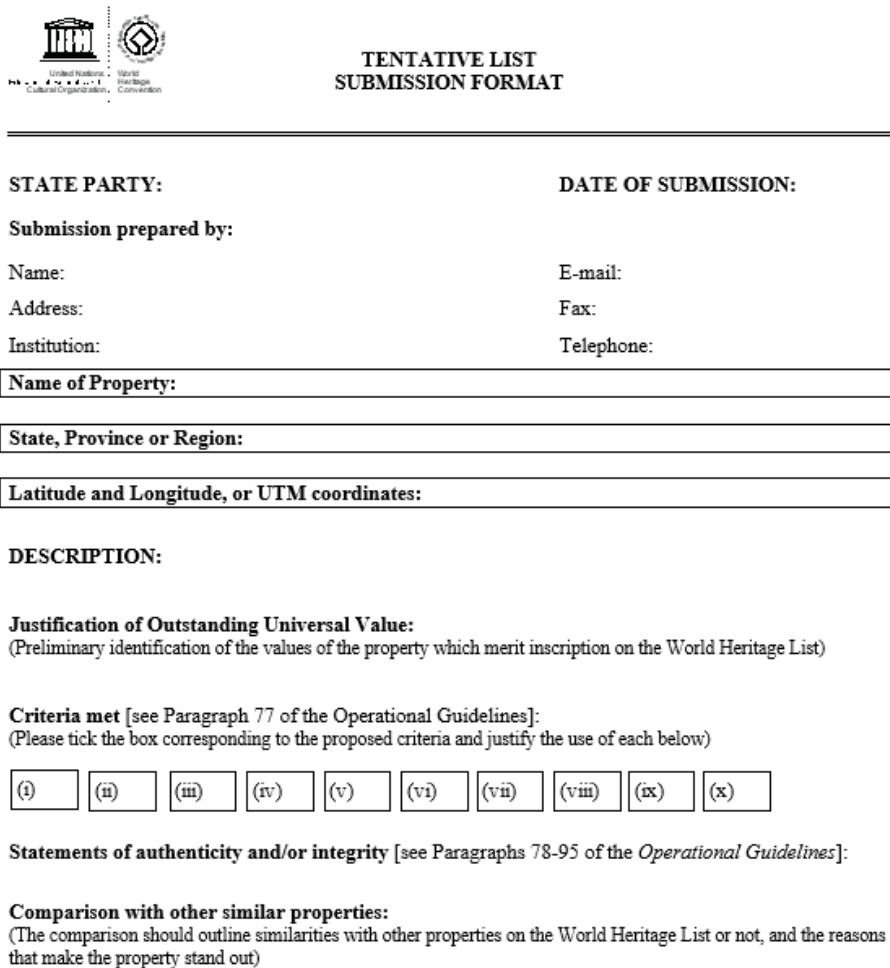
Slika 16. Dio dosjea za podnošenje Tentativne liste ( http://whc.unesco.org )

„UNESCO-ov Savjet prema predanim podacima odlučuje je li lokalitet doista vrijedan nominacije. Od vlade države koja nominira lokalitet zahtijeva se da ima pravne i regulatorne okvire te mehanizme upravljanja kojima bi mogla poduprijeti samu nominaciju.“ (Jelinčić, 2008: 89). Države potpisnice trebaju se preispitati i ponovno dostaviti svoju Tentativnu listu u roku od najmanje svakih deset godina. Kulturno ili prirodno dobro, jednom upisano na Listu svjetske baštine, miče se s popisa Tentativne liste.