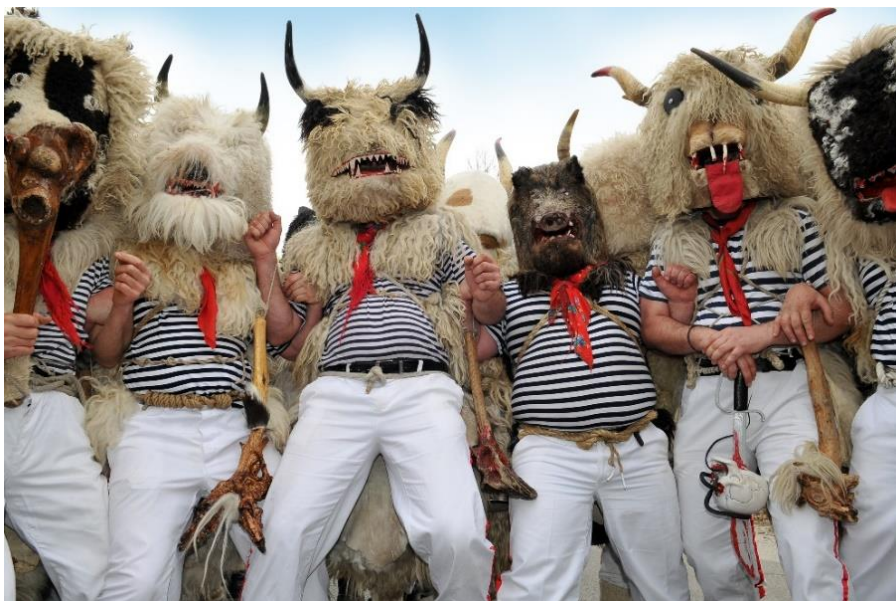
Slika 12. Zvončari s područja Kastavštine ( https://www.tz-viskovo.hr )