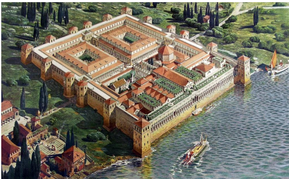
Slika 5. Rekonstrukcija Dioklecijanove palače

Vanjski zidovi Dioklecijanove palače gotovo su pravokutni i veoma debeli s prozorima u gornjem dijelu. Fasada joj je bila utvrđena sa 16 kula. Na južnom dijelu koji se izdizao iz mora bio je veliki trijem, šetnica s 42 prozora i tri lođe. U palaču se moglo ući sa sve četiri strane: kroz Zlatna vrata, koja su bila na sjeveru i imala su funkciju glavnog ulaza, Brončana vrata na južnoj strani, Željezna vrata na zapadu, te Srebrna vrata, smještena na istočnoj strani.