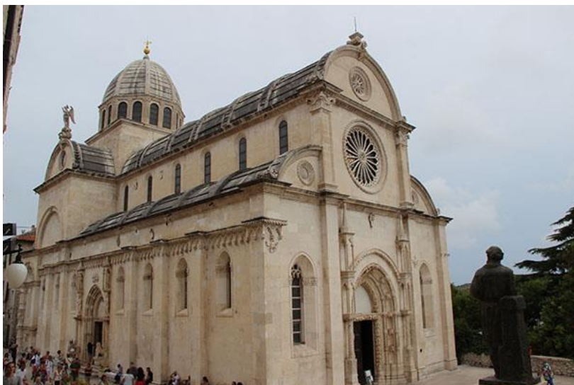
Slika 3. Katedrala Sv. Jakova