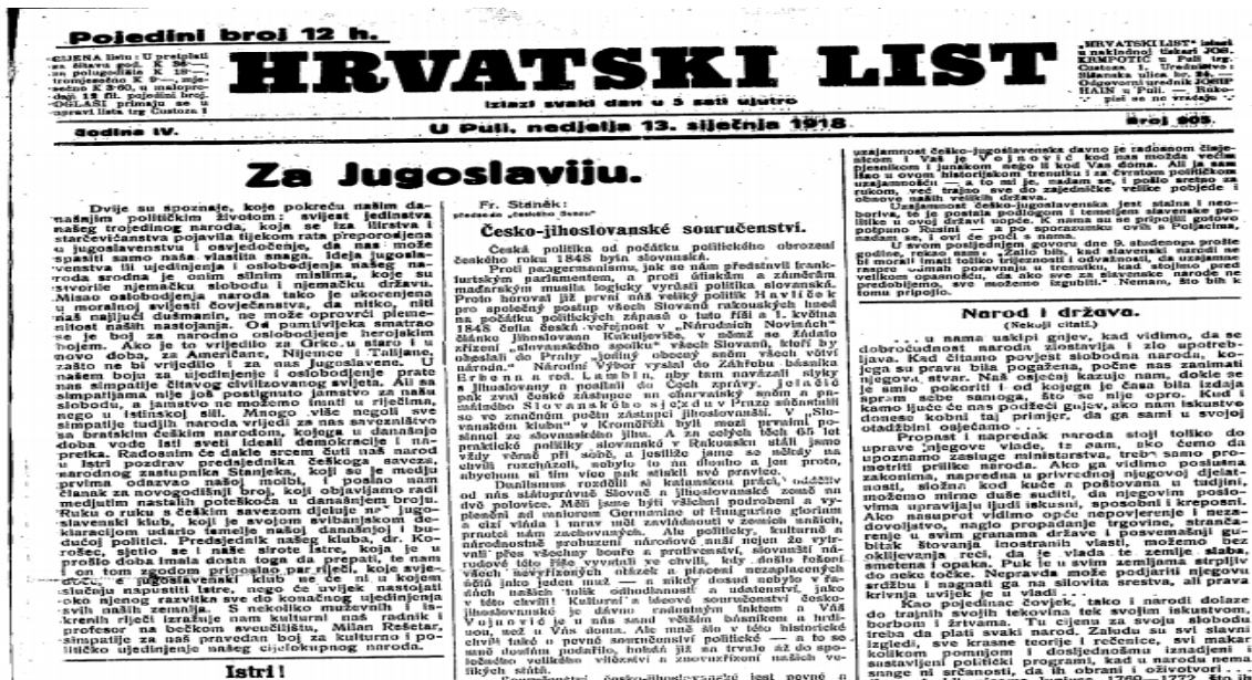
Slika 5: „Hrvatski list“, dnevnik, broj iz 13.siječnja 1918.