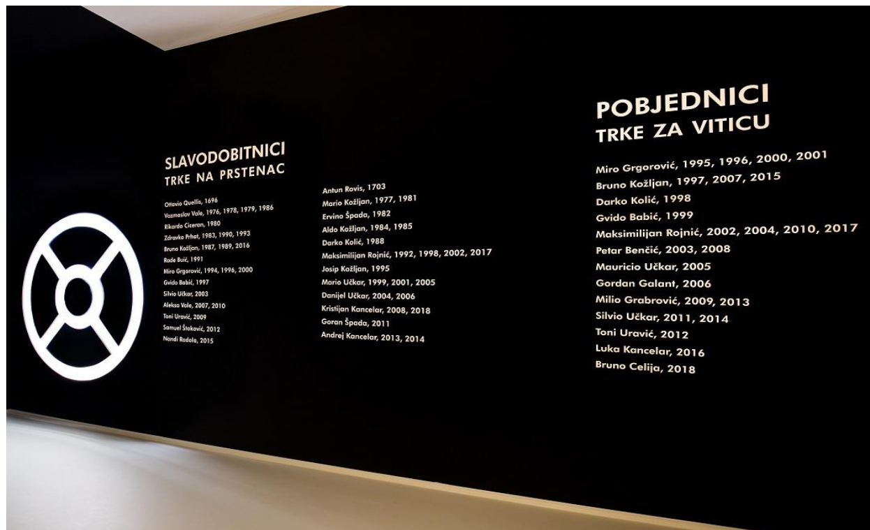
Slika 4. Slavodobitnici Trke na prstenac i Trke za viticu