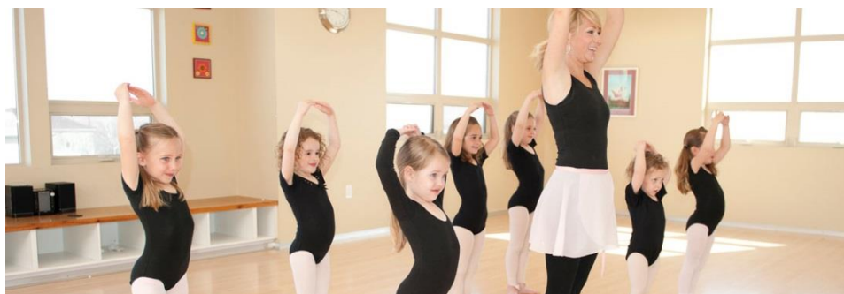
Slika 9. Sat sportskog vježbanja u sportskom klubu s djevojčicama

Sat sportskog vježbanja najčešće traje 60 ili 45 minuta i najčešće se provodi samo s djecom starije dobne skupine.